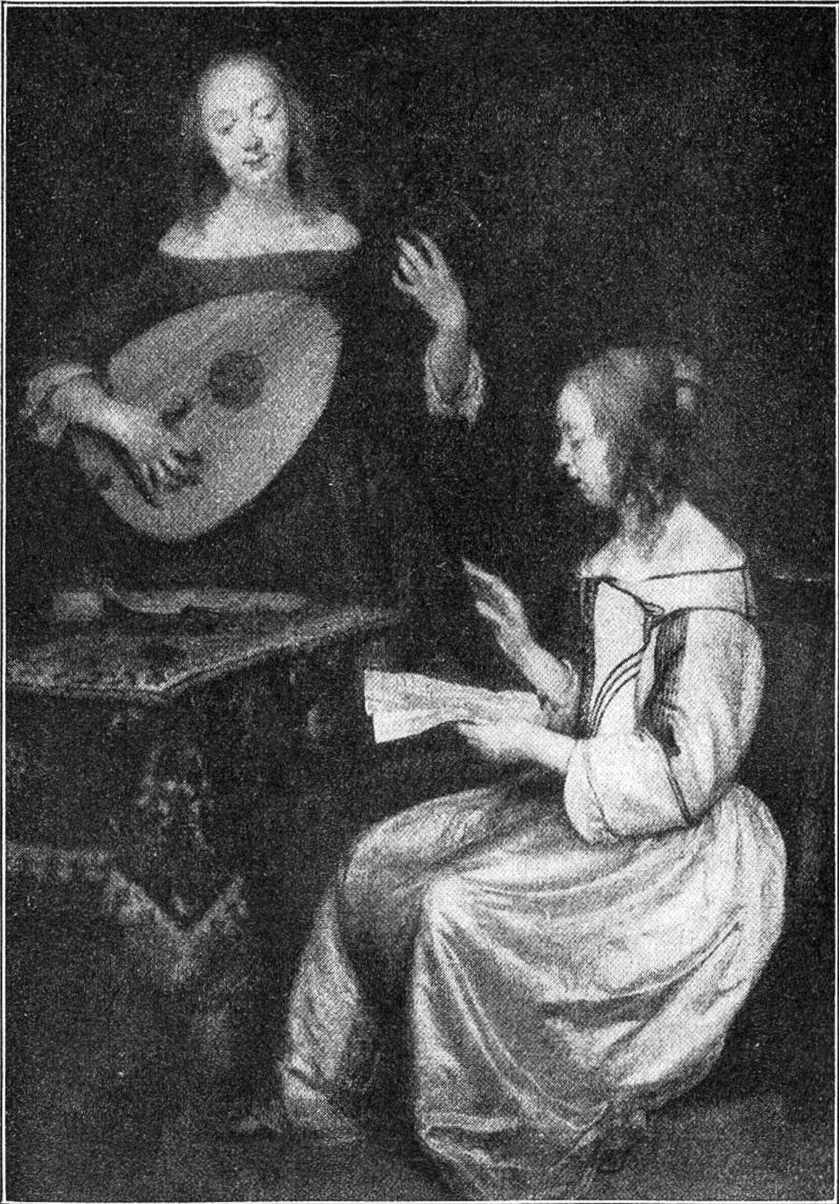
DAS KONZERT Gemälde von Gerard Terborch.