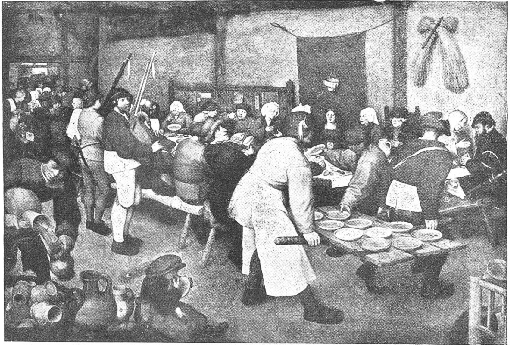
BAUERNHOCH- ZEIT. Gemälde v. Pieter Breughel.