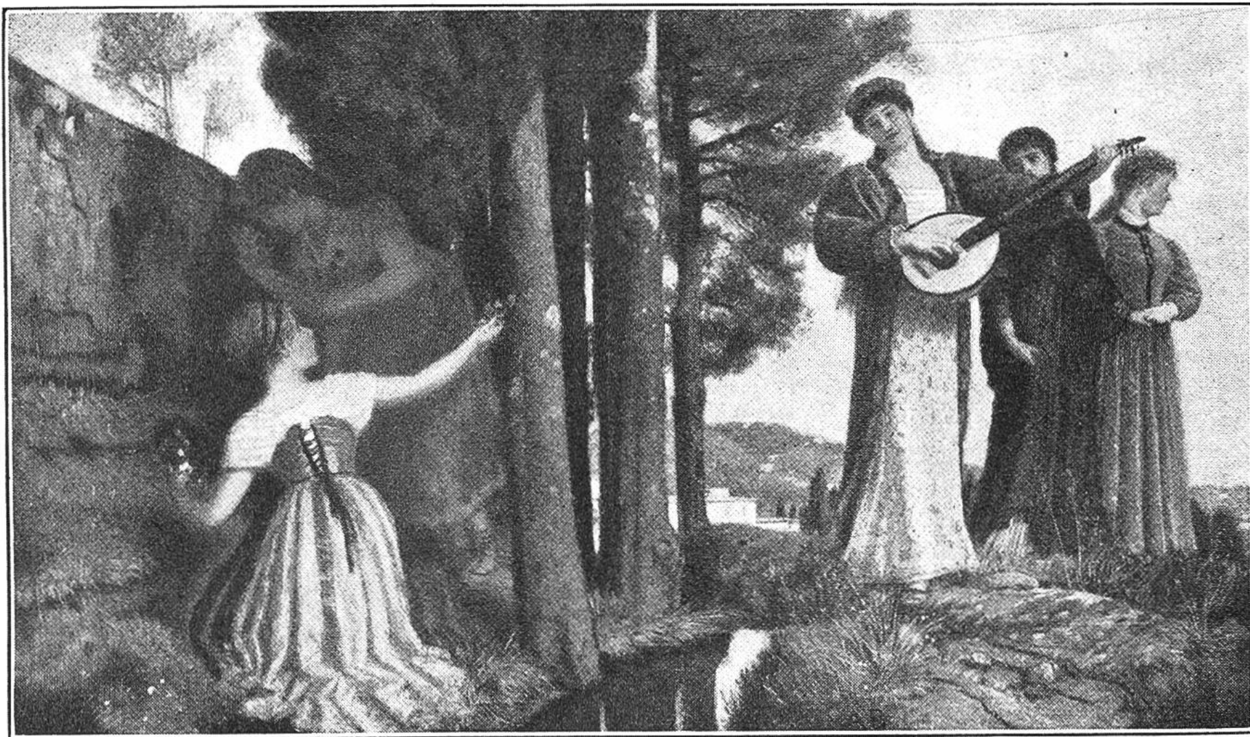
SIEH, ES LACHT DIE AU! Gemälde von Arnold Böcklin.