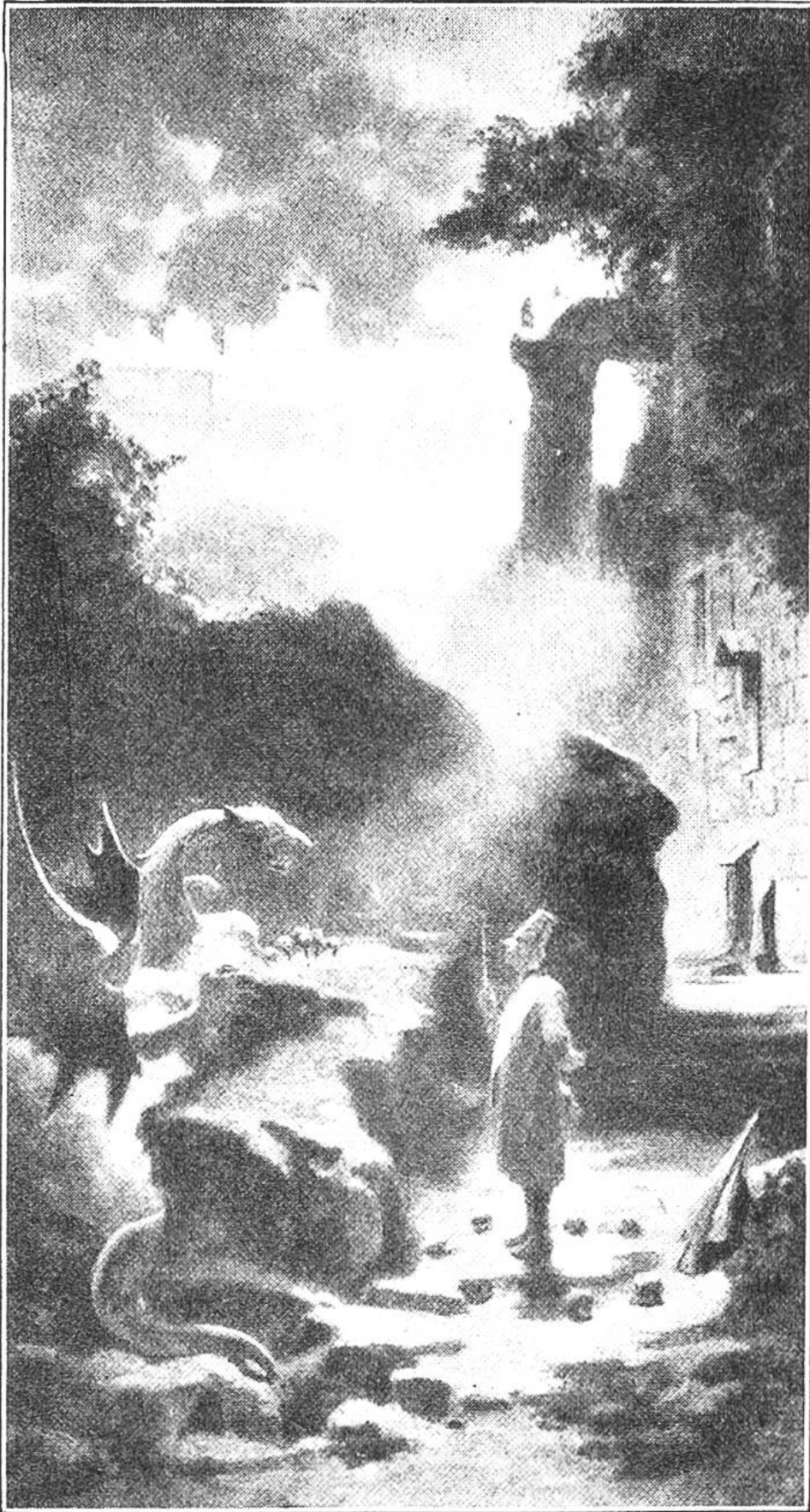
DER HEXENMEISTER Gemälde von Carl Spitzweg.