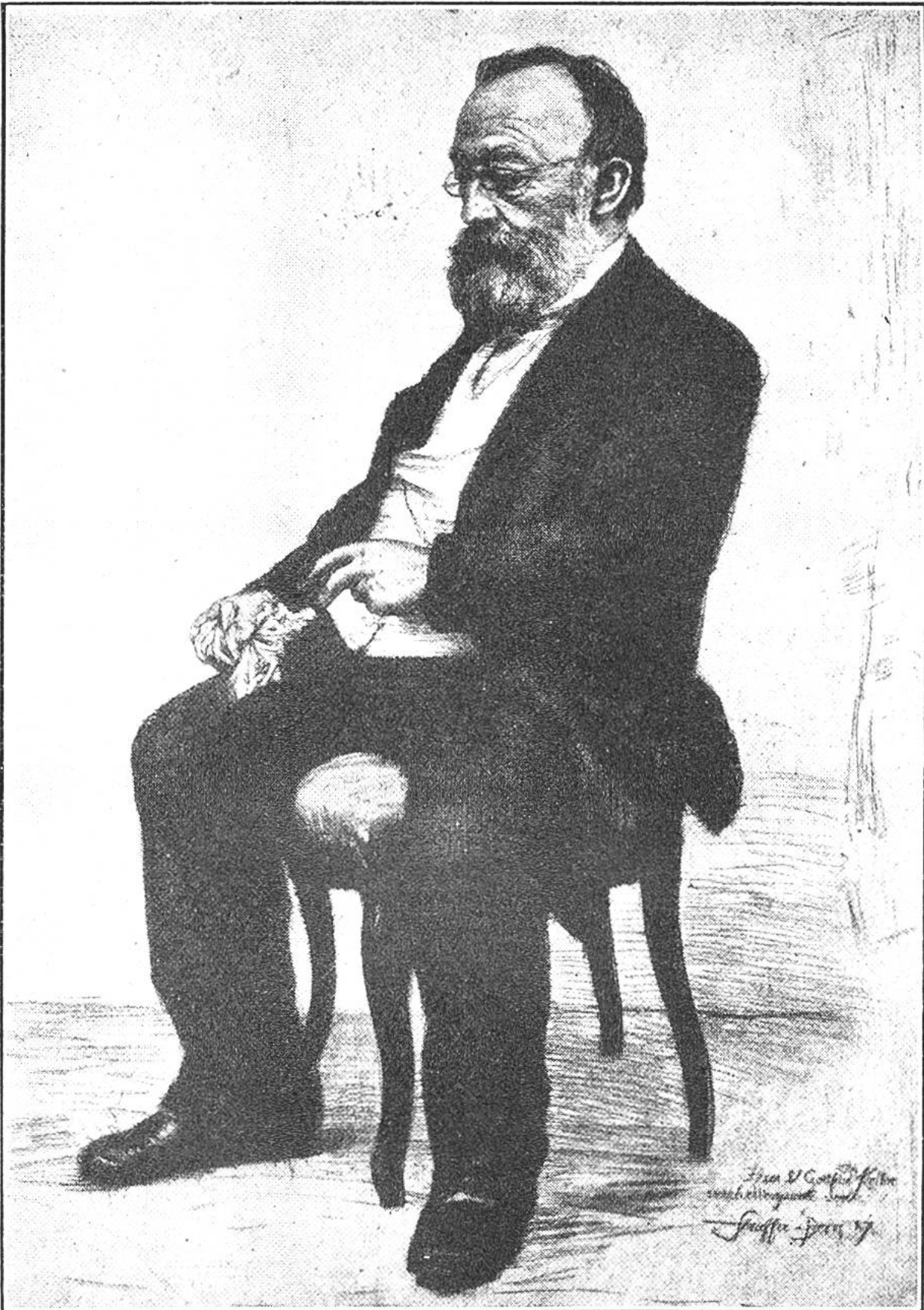
GOTTFRIED KELLER Radierung von Karl Stauffer.