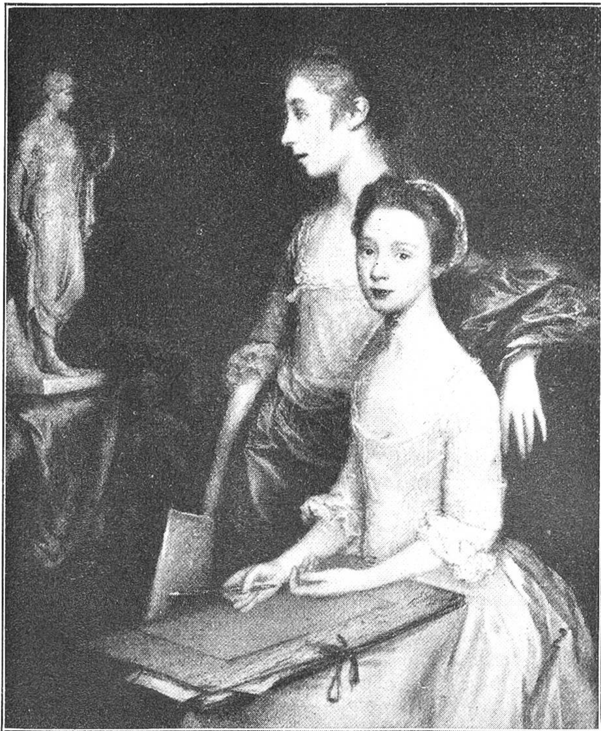
DIE TÖCHTER DES MALERS Gemälde von Thomas Gainsborough.