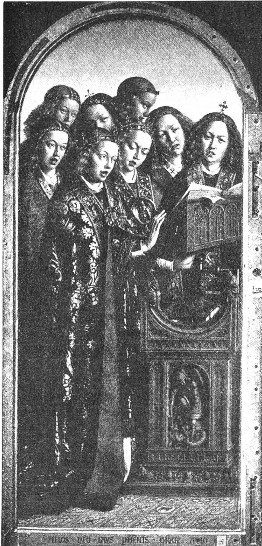
DIE MUSIZIERENDEN ENGEL Teilstück des Genter Altars, Gemälde von Jan und Hubert van Eyck.