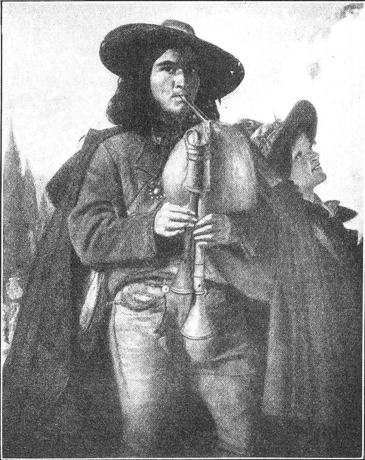
„PIFFERARI“, DUDELSACKPFEIFER Gemälde von Frank Buchser.