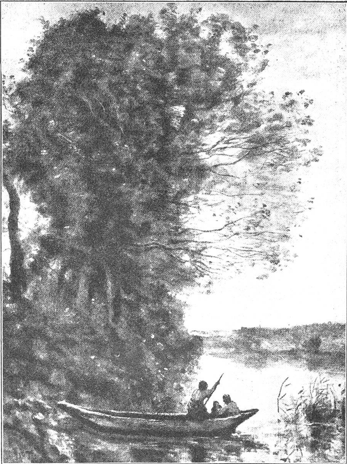
DIE FÄHRE Gemälde von Camille Corot.