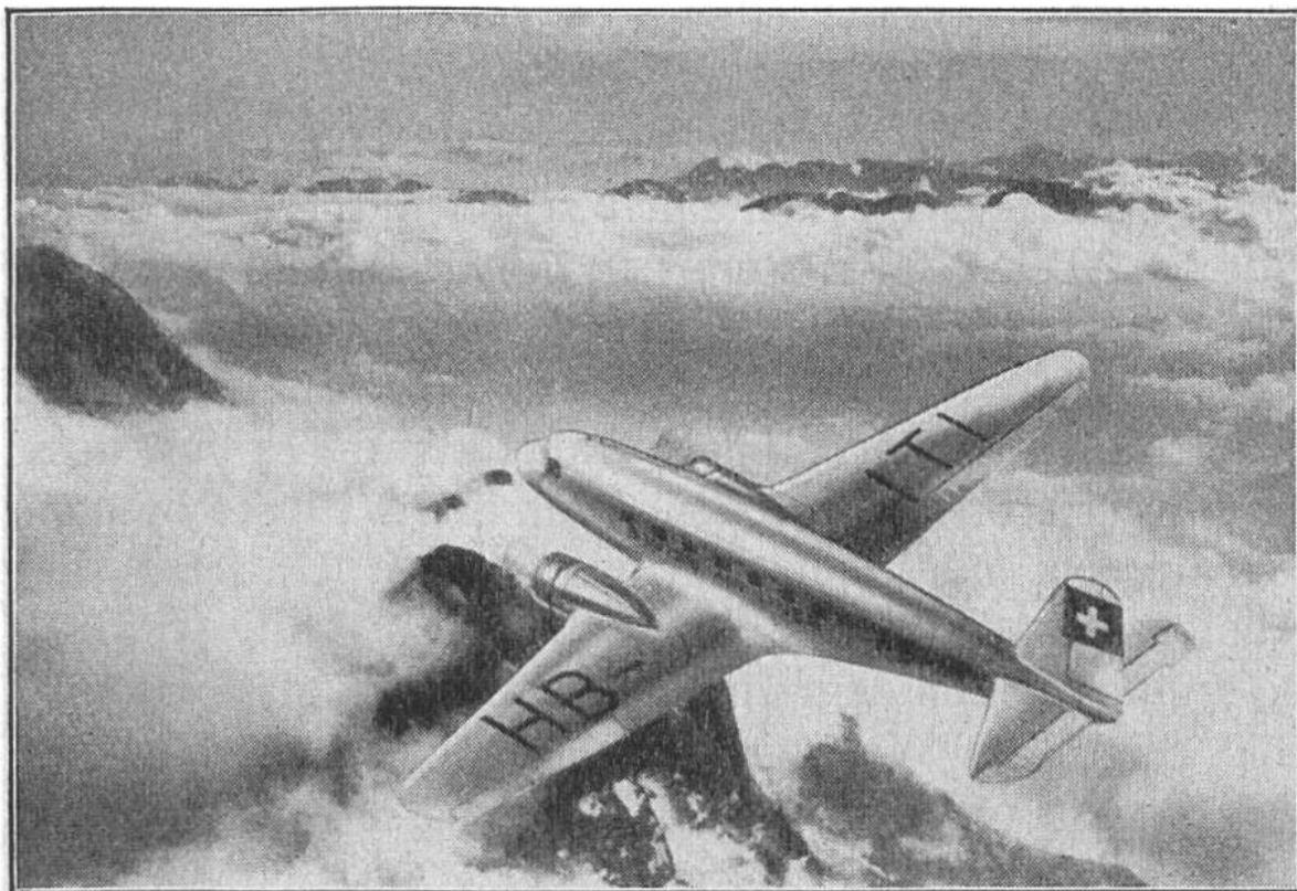
Swissair Zürich, Phot. Walter Mittelholzer.

Um den Luftwiderstand dieser Maschine so viel als möglich zu verringern, hat man ihr eine vollkommene Stromlinienform gegeben. (Sogar das Fahrgestell wird während des Fluges eingezogen.) Mit den beiden Motoren — das Flugzeug kann im Notfall auch nur mit einem fliegen — wird eine Geschwindigkeit von 350 Kilometern in der Stunde erreicht. Die Kabine ist schalldicht und fasst 15 Passagiere. Doch die grösste Neuerung besteht im sogenannten „automatischen Piloten“, einer Einrichtung, die allfällige falsche Handhabungen des wirklichen Piloten selbsttätig berichtigt.