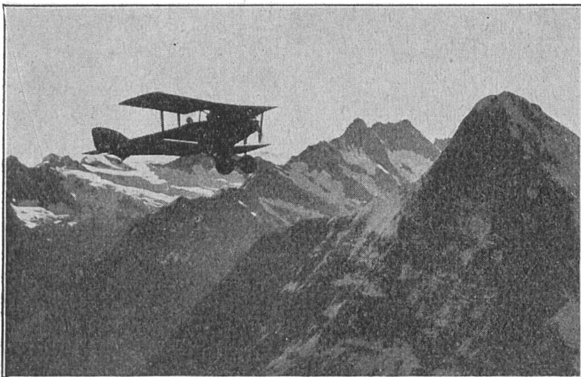
Flugzeug über Eiger und Schreckhörner in 4000 Meter Höhe.