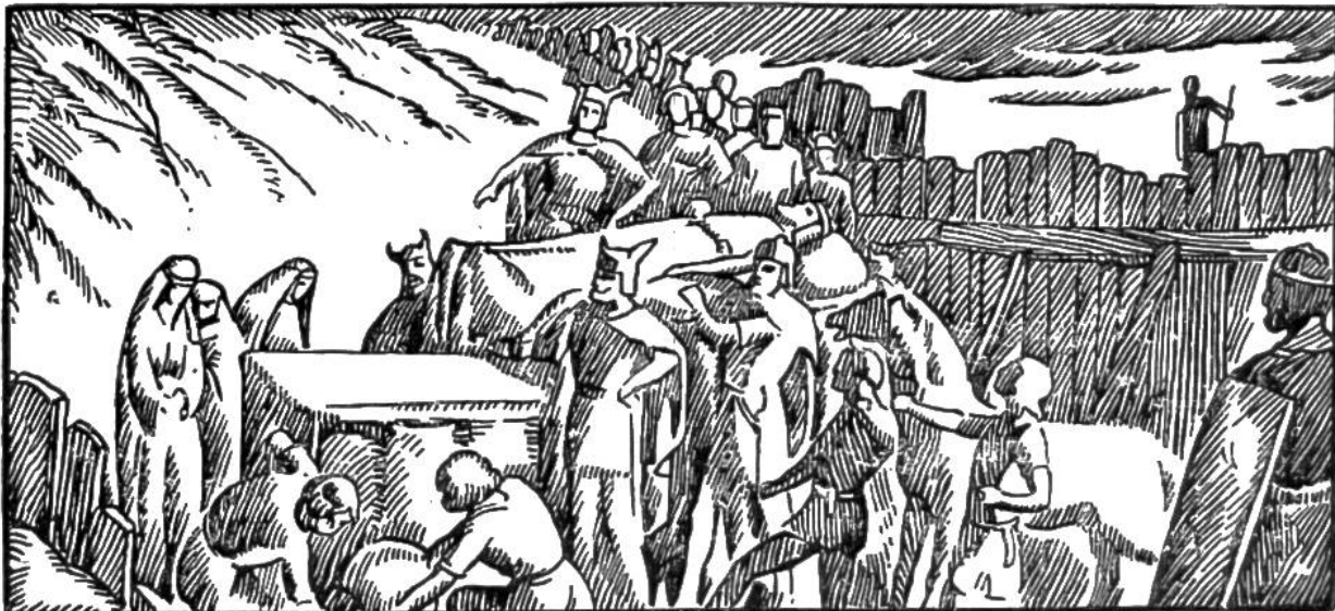
Bestattung Alarichs im Busento.