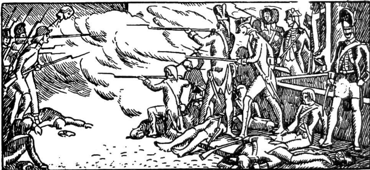
Verteidigung der Tuileries durch die Schweizergarde.

1756–1763 Siebenjähriger Krieg. Preussen behält Schlesien. Frankreich tritt Kanada an England ab. 1761 Gründung der Helvetischen Gesellschaft. Iselin, Balthasar, Hirzel, Zimmermann, Salis, Haller, Gessner, Lavater, Pestalozzi, Johannes von Müller. 1766 Lothringen und Korsika werden französisch.