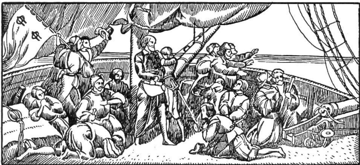
Kolumbus und seine Gefährten sahen Land.