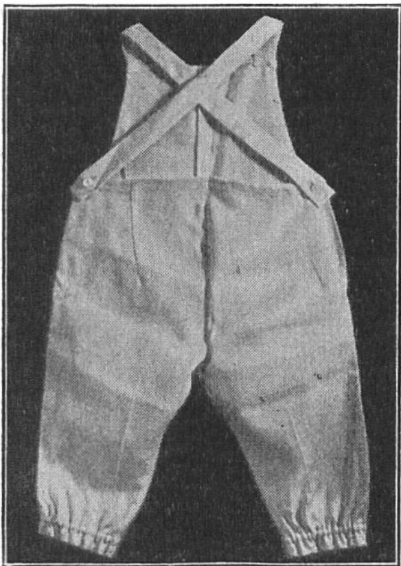
Spielhose, von hinten.

aufgeheftet; durch deren Mitte wurde mit H.C.-Flor-garn in der Farbe des Höschens eine farbige Zackenlitze mit einem schrägen Stich aufgenäht (siehe Schnittmusterbogen).