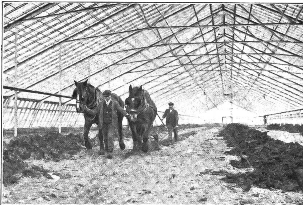
Land unter Glas. Eines der grössten Gewächshäuser der Welt in England. Der Bauer pflügt den Boden, um dann Tomaten anzupflanzen.

gesucht werden, den die Gärtner in den Treibbeeten für frühe Gemüse und Blumen verwenden. Dies tun sie weniger um zu düngen, als darum, dass der Pferdemist beim Gären im Boden Wärme entwickelt. Diese Wärme für die „Füsse“ der Pflanzen soll jetzt der elektrische Strom liefern. Wahrscheinlich aber wird es die elektrische Bodenheizung dem Gärtner immer mehr ermöglichen, unabhängig von den Jahreszeiten in den Glashäusern zu pflanzen und zu ernten.