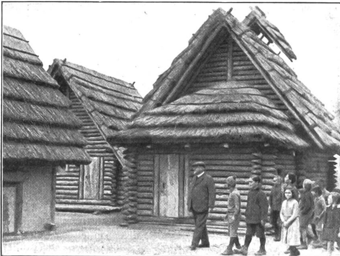
Eine Schulklasse besichtigt mit dem Lehrer das Pfahlbauerdorf. Die Häuser sind in Grösse und Form möglichst genau den Bauten nachgebildet, die einst an dieser Stelle standen.