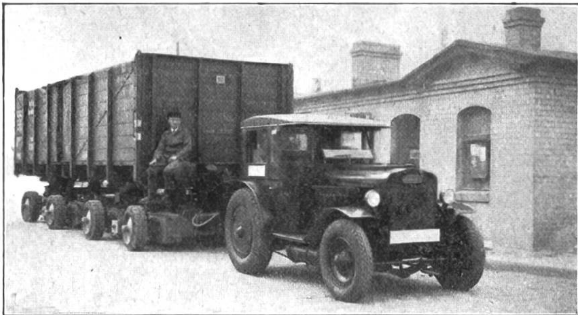
Ein Traktor zieht das Fahrgestell, das mit einem Güterwagen beladen ist, durch die Strassen vom Bahnhof zum Lagerhaus.

selbst Automobile in ihren Dienst gestellt, um an den Bahnhöfen Zu- und Abfuhr zu besorgen. Aber dies hat bei Gütersendungen immer noch den Nachteil, dass die Ware zweimal umgeladen werden muss; das ist zeitraubend und teuer und verlangt auch eine kostspieligere Verpackung. Im Auto kann selbst brüchige Ware lose, in Stroh gebettet, an den Bestimmungsort gebracht werden. Um den gleichen Vorteil bieten zu können, hat die Eisenbahn in Deutschland und anderswo eine Neuerung eingeführt: „Das fahrende Geleise“. Die fahrbaren Schienenstücke befinden sich auf einem niedrigen Strassenfahrzeug. Der Frachtwagen wird darauf geschoben, ein Traktor vorgespannt, und dann fährt der Bahnkoloss auf der alten, guten Landstrasse direkt zur Ein- oder Abladestelle. So muss also selbst die mächtige Eisenbahn heute vielen ihrer Kunden nachgehen, weil diese sonst nicht zu ihr kommen.