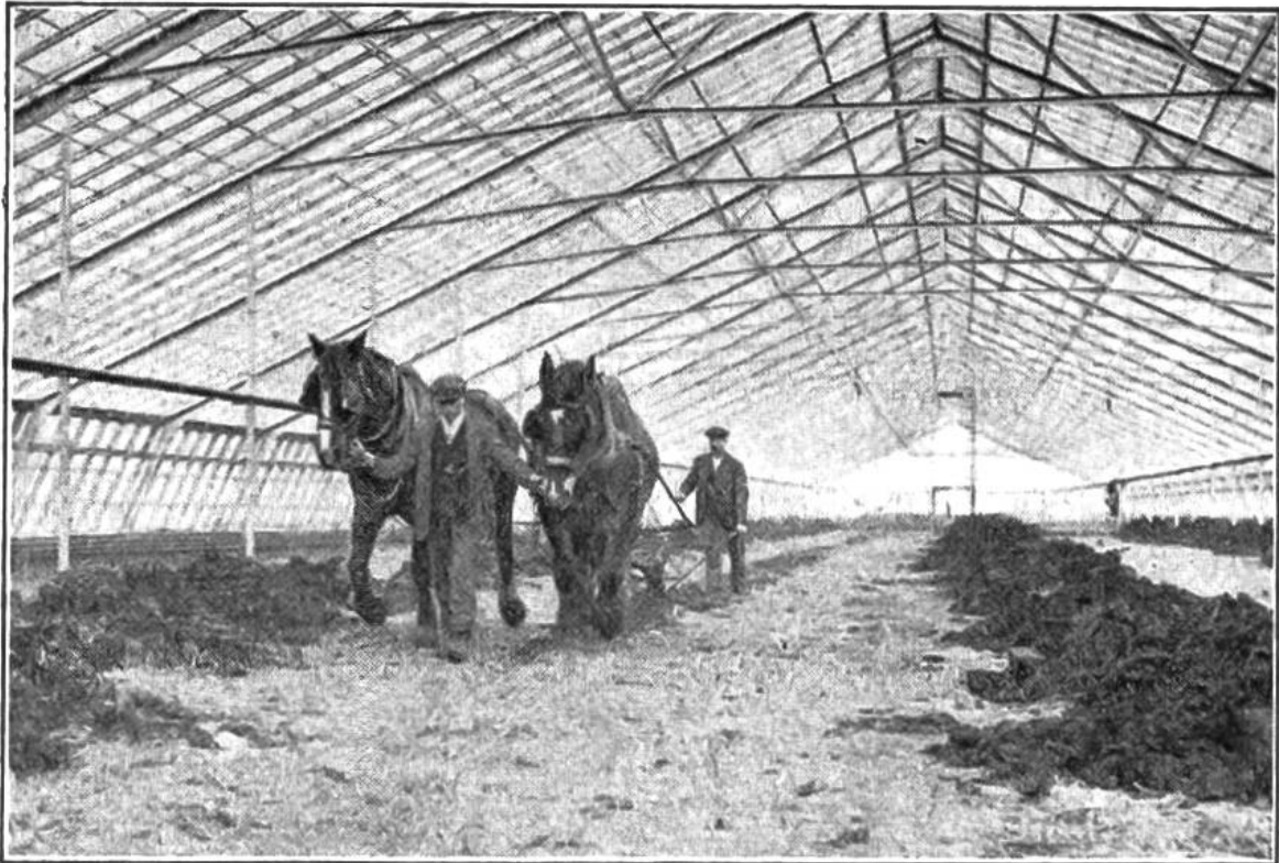
Land unter Glas. Eines der grössten Gewächshäuser der Welt in England. Der Bauer pflügt den Boden, um dann Tomaten anzupflanzen.

gesucht werden, den die Gärtner in den Treibbeeten für frühe Gemüse und Blumen verwenden. Dies tun sie weniger um zu düngen, als darum, dass der Pferdemist beim Gären im Boden Wärme entwickelt. Diese Wärme für die „Füsse“ der Pflanzen soll jetzt der elektrische Strom liefern. Wahrscheinlich aber wird es die elektrische Bodenheizung dem Gärtner immer mehr ermöglichen, unabhängig von den Jahreszeiten in den Glashäusern zu pflanzen und zu ernten.