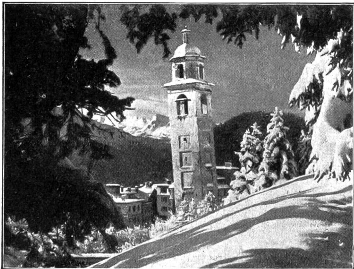
Der schiefe Kirchturm von St. Moritz, erbaut im Jahre 1573.

Jahren der Untergrund des Turmes gegen das Wasser abgedichtet und zementiert worden, so dass das „unfreiwillige Wunder der Baukunst“ noch Jahrhunderte überdauern dürfte.