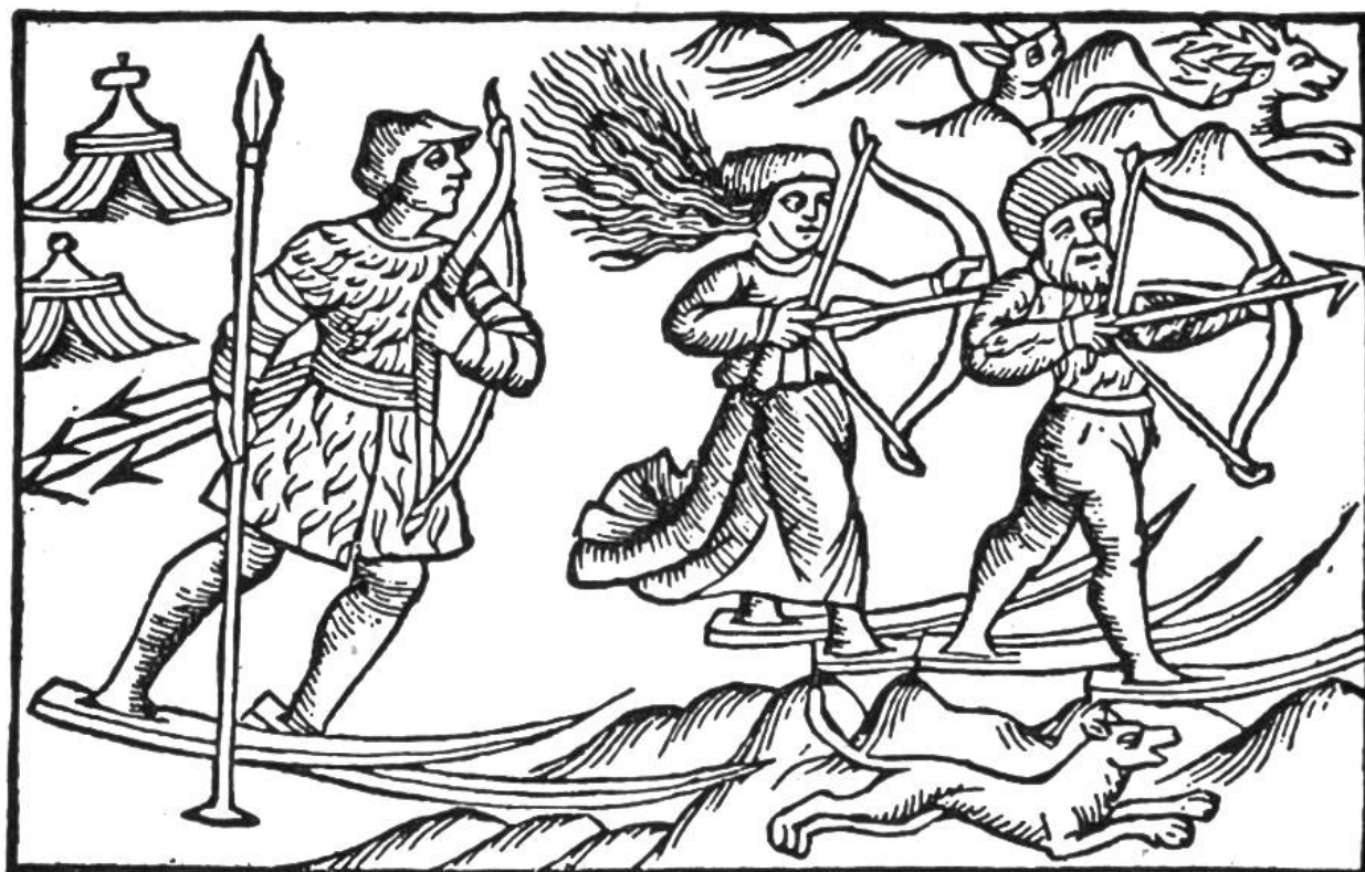
„Wildt-Lappen“ auf der Jagd. (Aus dem Buche des Olaus Magnus, 1567, Basel.)

Bretter jung und alt erfasste, da begann man nicht allein die Skisprünge, sondern auch die Ursprünge des Ski genauer zu erforschen. Da zeigte sich denn, dass dieses wundervolle Fahrzeug, — die Bretter „die den Schnee besiegen“ — schon einige tausend Jahre alt ist, und dass die Skier in verschiedenen Ländern unabhängig voneinander erfunden wurden. Gar viele Völker hatten in ihren schneereichen Ländern zur Winterszeit einen harten Kampf ums Dasein auszufechten; die mit Pfeil und Bogen ausgerüsteten Jäger vermochten bei lockerem Schnee dem flinkeren Wild nicht mehr zu folgen. Sie alle machte die Not erfindereich. So wurde denn ein uraltes Verkehrsmittel, nämlich der Schuh, den Verhältnissen auf dem Schnee angepasst. Um das Einsinken zu verhindern, wurden die Sohlen „einfach verlängert“, und zwar mit Brettern oder fellbespanntem Flechtwerk. Aus dem Schreiten wurde ein Gleiten, und so ward ein neues Verkehrsmittel, eine Art Ski, erfunden. Ganz so einfach wie