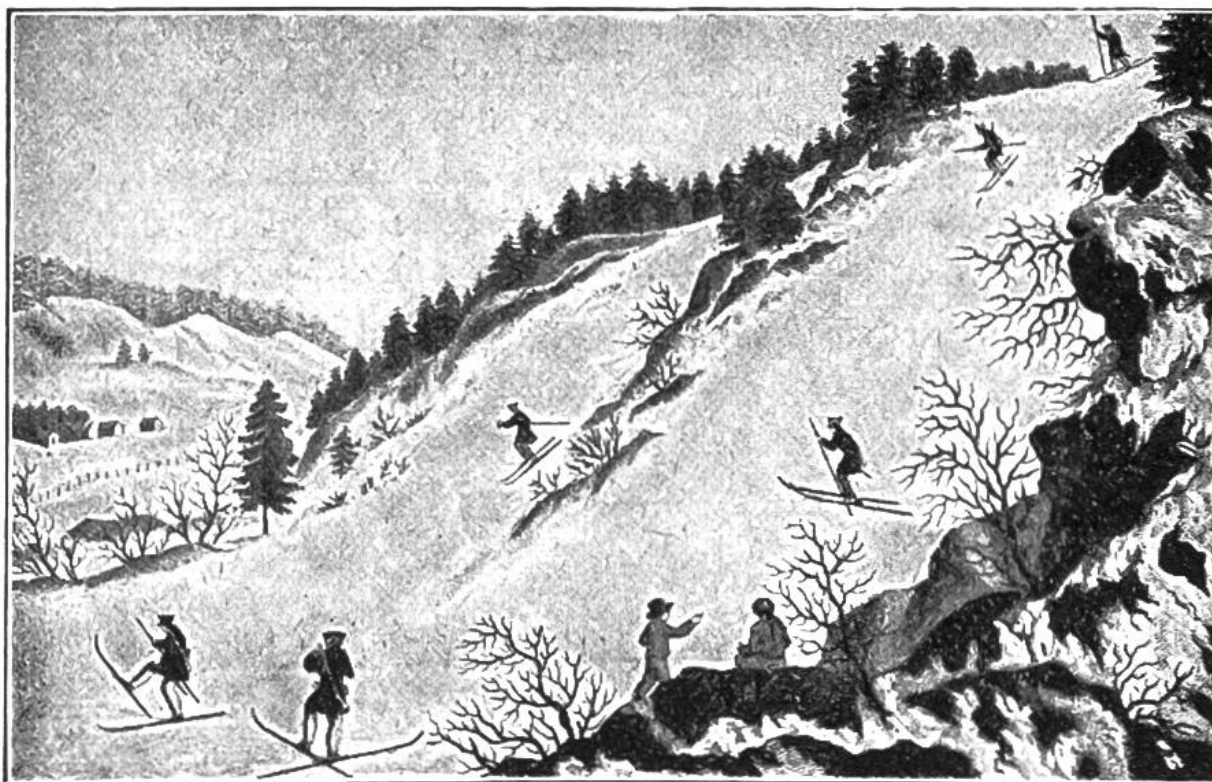
Norwegische Militär-Skiläufer im 18. Jahrhundert. (Nach einem alten Stich.)

überhaupt zwei verschiedene Skiarten zu einer einzigen vereinigt. Die alten skandinavischen Skier waren nämlich ungleich lang. Der rechte mass gegen 3,3 m, der mit Pelz überzogene linke dagegen höchstens 2,1 m. Dieser linke Ski diente bloss zum Abstossen; der rechte dagegen trug das Körpergewicht. Das Laufen mit solchen Skiern ist am ehesten dem Trottnet-fahren (Roller) der Kinder zu vergleichen. Der rechte gleitende Ski hatte jene Rinne auf der Unterseite, wie sie auch die modernen Skier durchwegs an beiden aufweisen. Die letzten Läufer auf solchen ungleichpaarigen Hölzern wurden vor noch nicht langer Zeit in Norwegen gefilmt zur Erinnerung an diese Art des Skilaufs. Noch vor 100 Jahren waren die berühmten norwegischen Skikompanien zum Teil mit solchen ungleichen Brettern ausgerüstet.