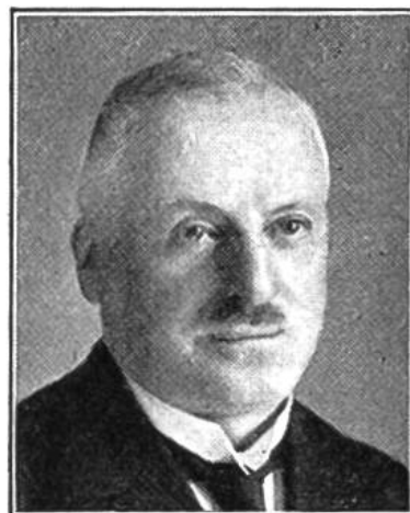
Dr. Giuseppe Motta von Airolo *1871, seit 1912 i. Amte