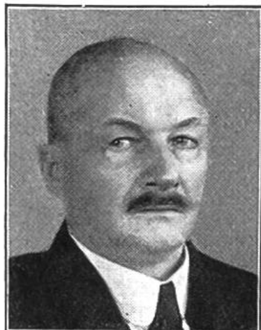
Dr. Albert Meyer von Fällanden (Zürich) *1870, seit 1930 i. Amte

Dr. Motta: Chef d. Politischen Departements. Dr. Meyer: Chef des Finanz- u. Zolldepartements. Dr. Baumann: Chef d. Justiz- u. Polizeidepartements. Minger: Chef des Militärdepartements. Dr. Schulthess: Chef d. Volkswirtschaftsdepartements. Dr. Pilet: Chef des Post- und Eisenbahndepartements. Etter: Chef des Departements des Innern.