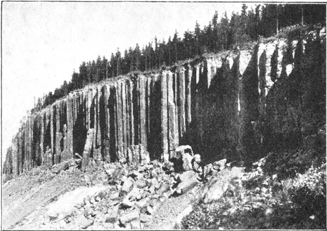
„Die Orgelpfeifen“. Basaltsäulen im Erzgebirge, die früher als Steinbruch benutzt wurden, jetzt aber unter Naturschutz gestellt sind.

bildeten, türmten sich die Basaltmassen zu kegelförmigen Bergen auf. Das Merkwürdige ist, dass dieser Basalt, vielleicht infolge rascher Abkühlung, oft die Gestalt von ziemlich regelmässigen Säulen annahm. Der ganze Vulkankegel schichtet sich dann aus derartigen Säulen auf. Dort, wo der Basalt in Steinbrüchen gewonnen wird, ist das ein Vorteil. Aber nicht jeder Basalt ist so hart, dass sich der Abbruch lohnte. Manche Sorten verwittern rasch, andere dagegen geben ein vorzügliches Strassenpflaster. Basaltsäulen messen im Durchmesser meist etwa 25 cm. Die Säulenhöhe ist verschieden.