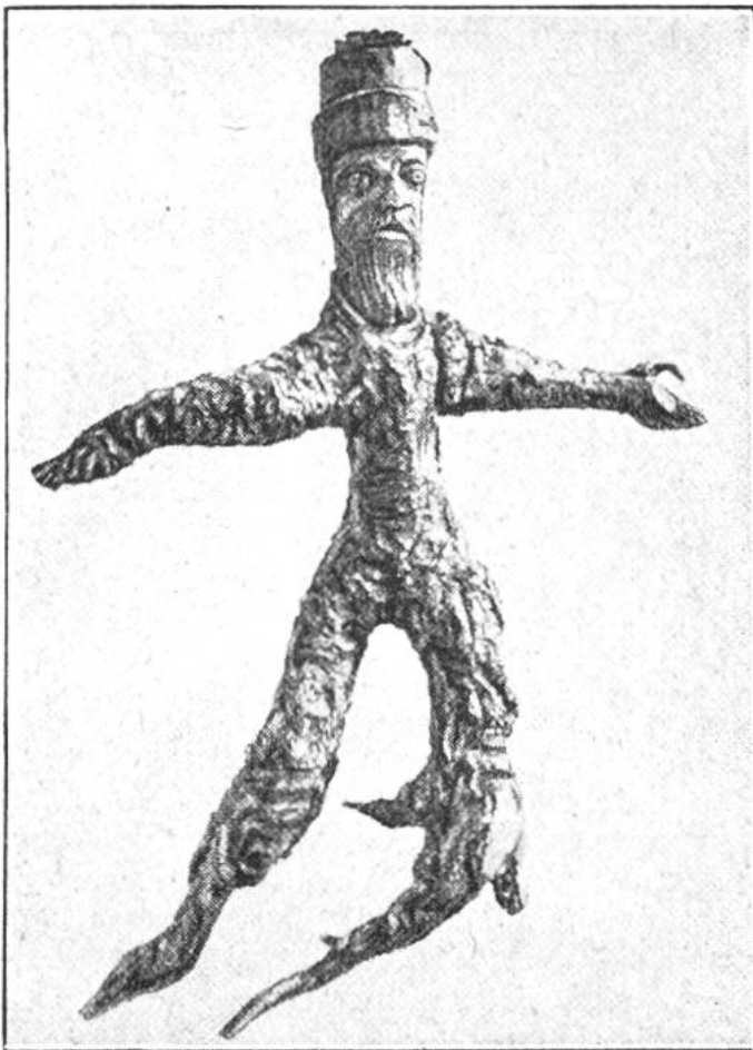
Ein fertiges Alräunchen, ein Glücksbringer, der von Abergläubischen mit Gold aufgewogen wurde.

zu binden, und das Tier dann zu locken, so dass es sie ausriss. Natürlich mussten die Alraungräber noch mehr können als Brot essen und in Hokuspokus, Zauberei und Beschwörungen durchaus beschlagen sein. Unheimlich war ja auch der angebliche Standort der wunderbar bewurzelten Pflanze, gerade unter dem Galgen. In Wirklichkeit indes gehört die Wurzel zu einer Giftpflanze des Mittelmeergebiets, Mandragora geheissen.