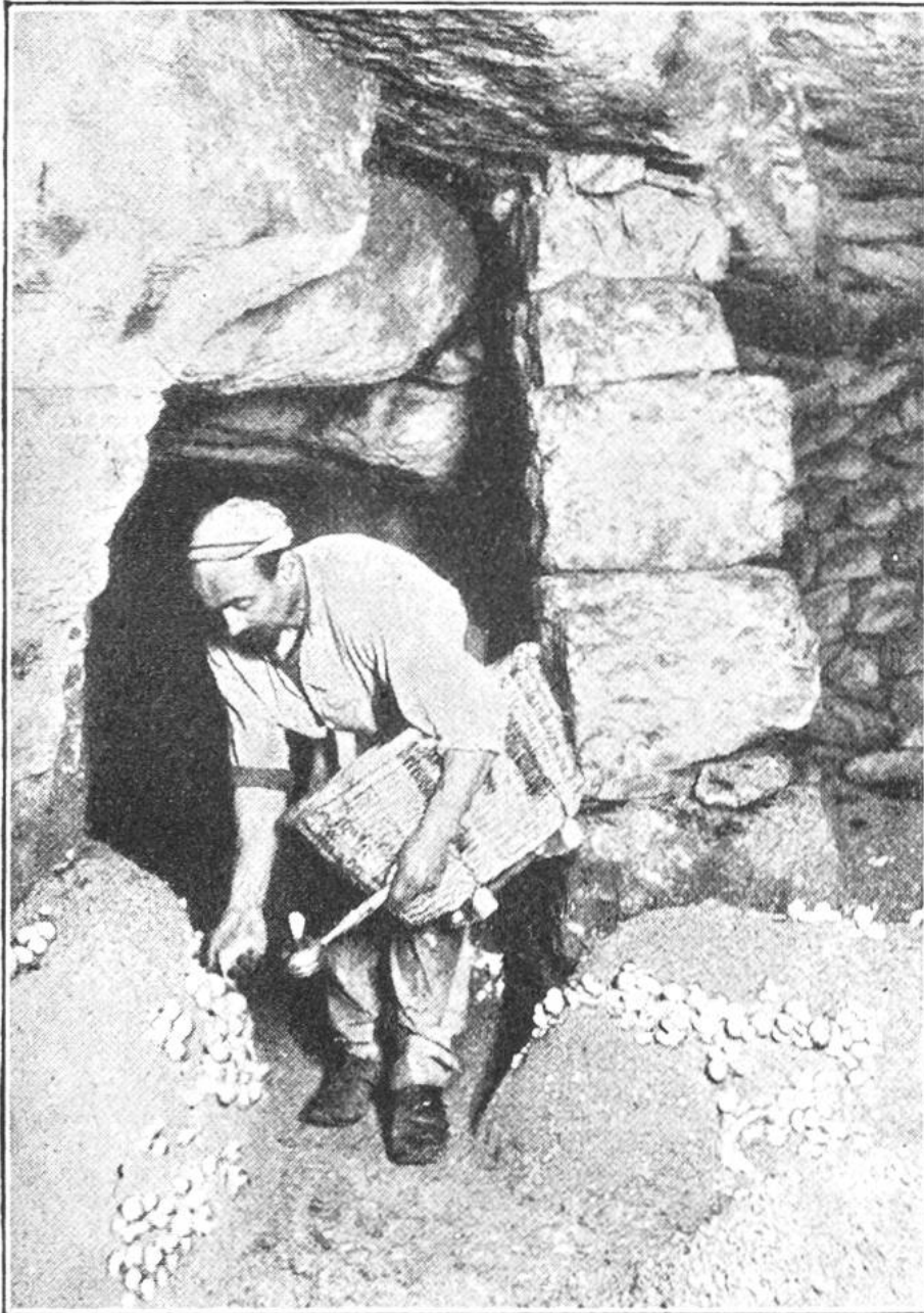
Der Pilzzüchter sammelt die „reifen“ Champignons, ein Lämpchen in der Hand, in einen Korb.