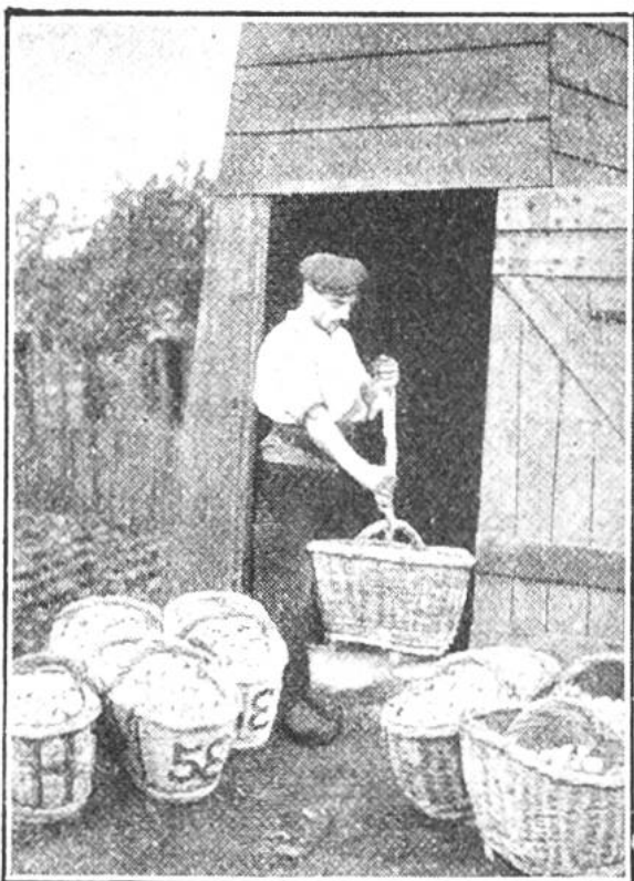
Die vollen Körbe werden mit einer Seilwinde an die Erdoberfläche gefördert.

nen, wurzelartigen Fäden der „Pilzbrut“ äusserst schnell aus, bis die Nährstoffe des Nährbodens aufgezehrt sind. In diesem Augenblick beginnen die eigentlichen Champignons zu spriessen. Sie werden geerntet, bevor der „Hut“ dieser Pilze zu stark in die Breite gewachsen ist. Die Züchter unterscheiden 3 Champignons-Sorten: weisse, blonde und graue. Für fast 3 Millionen Schweizer Franken liefern die Pariser Pilzkulturen alljährlich Champignons für den Handel.