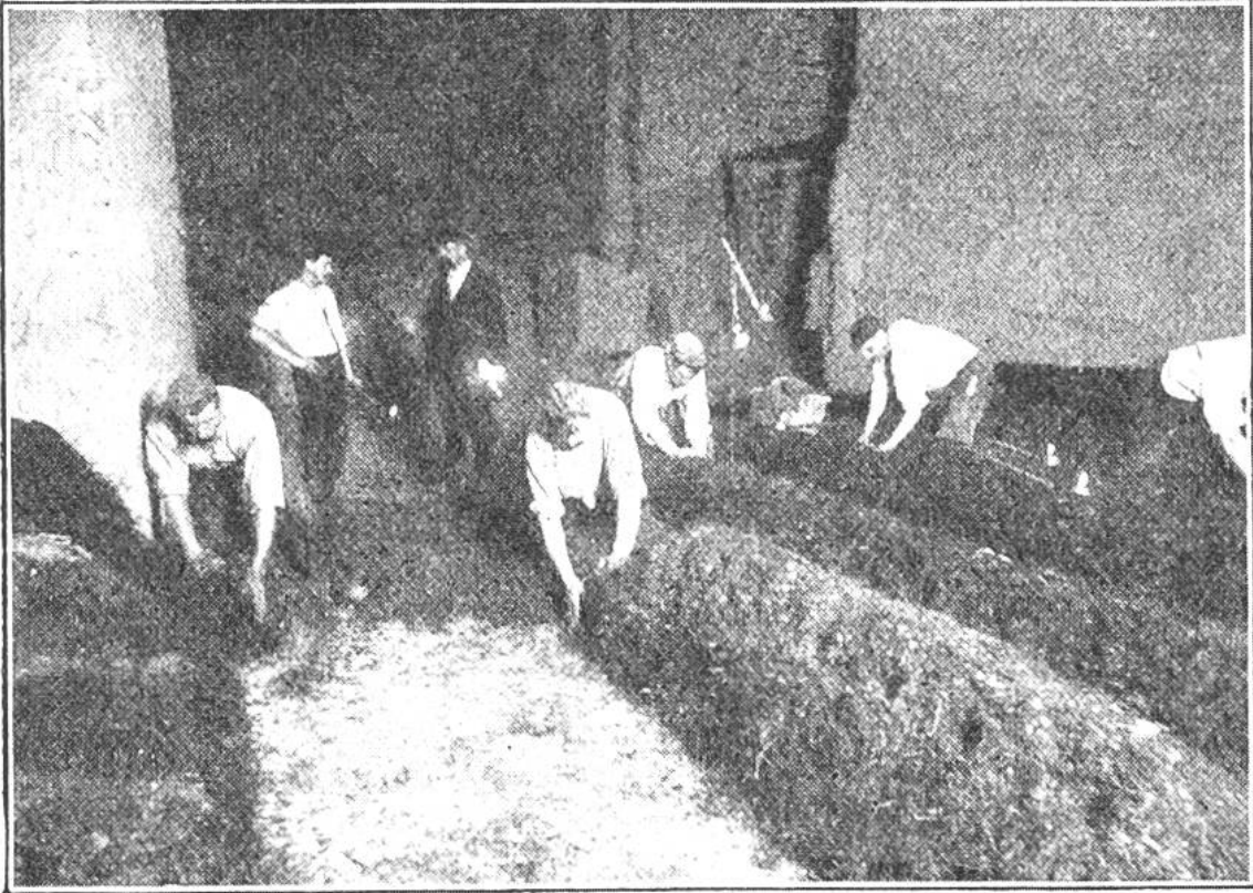
Die Pilzbeete werden aus Pferdemist in einem verlassenen Steinbruch hergerichtet.

Pariser Gärtner namens Chambry auf den Gedanken, Pilzgärten in verlassenen unterirdischen Steinbrüchen und Gewölben anzulegen. Sein Erfolg war gross, und so wurde das Unternehmen eifrig nachgeahmt. Heute gibt es in der Umgebung von Paris ungezählte solcher unterirdischer Champignons-Zuchten.