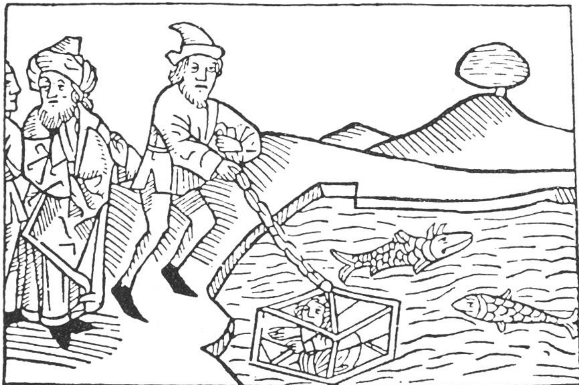
Wiederum der Taucherversuch Alexanders des Grossen in anderer Darstellung. (Beide Darstellungen nach mittelalterlichen Buchillustrationen.)

Beschreibungen von ähnlichen Taucherausrüstungen liefert schon der griechische Philosoph Aristoteles, 350 v. Chr. Sehr viel beschäftigte sich der geniale Maler und Erfinder Leonardo da Vinci mit der Konstruktion