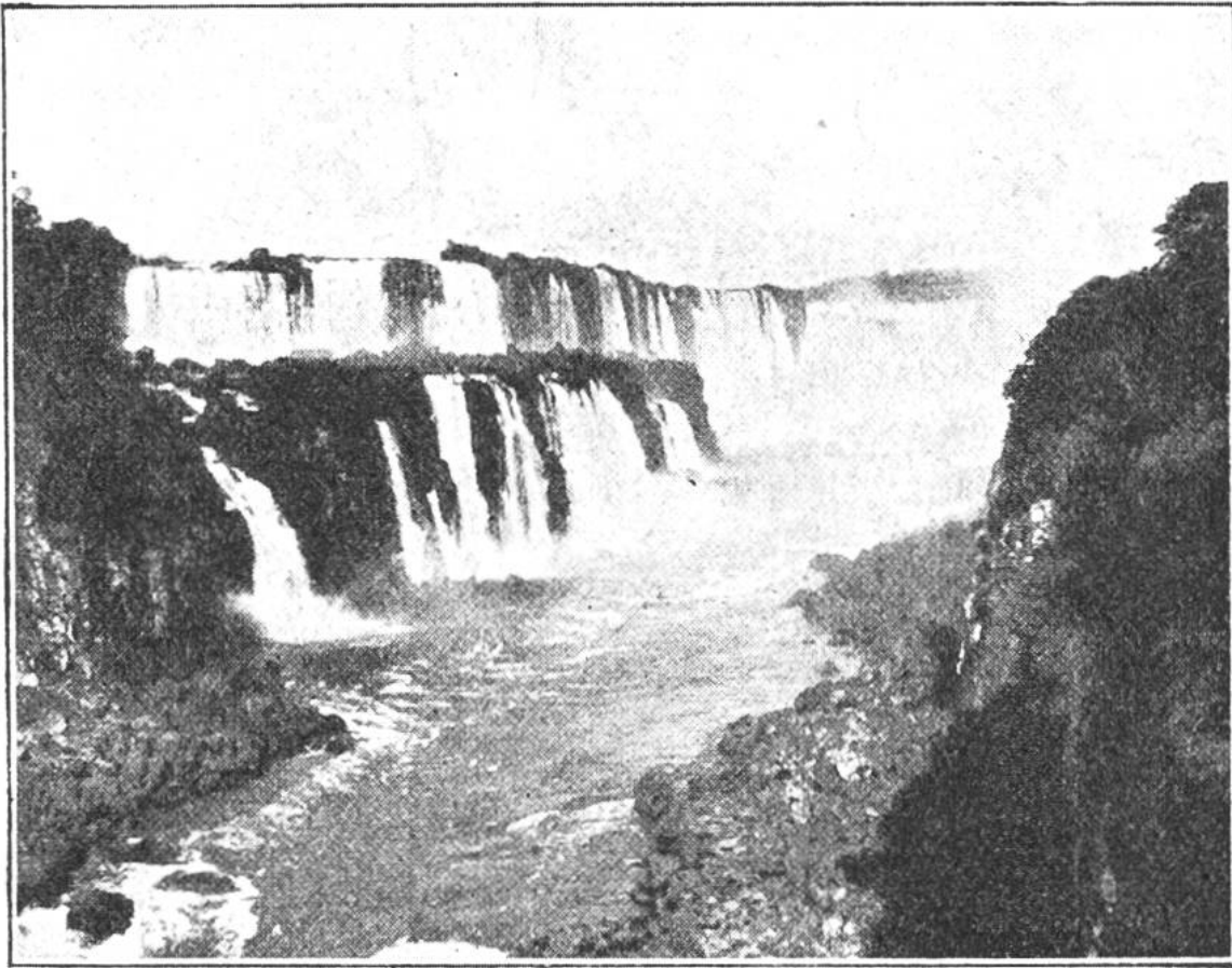
Der Salto-Victoria („Siegeßsprung“) des Iguasu-Flusses (Südamerika) ist der wasserreichste aller Fälle.

Auch der Iguasu bildet zum Teil einen hufeisenförmig gebogenen Fall wie der Niagara. Er wird aber viel weniger besucht als dieser, ist er doch in schwer zugänglicher Tropenwildnis. Einen gewaltigen Fall „tut“ auch der zweitgrösste der Ströme Afrikas, der Sambesi. Livingstone hat die Sambesifälle, die bei den Eingebornen „donnernder Rauch“ heissen, 1854 entdeckt. Es ist berechnet worden, dass sie 35 Millionen Pferdestärken (PS) liefern könnten. Da übertreffen die Kongofälle allerdings sie noch bei weitem mit 100 Millionen PS. Die Wasserkraft des Niagara wird auf „nur“ 6—8 Millionen PS geschätzt. Ein Teil davon wird tatsächlich durch ein Kraftwerk nutzbar gemacht. Durch einen Tunnelkanal durch Felsen strömt das Wasser zu einer riesigen Turbinenanlage.