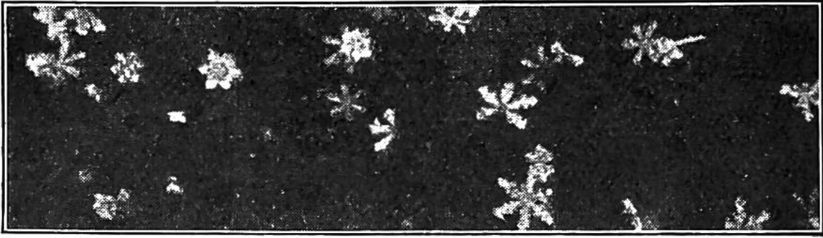
Einzelne Eiskristalle, aus denen die Schneeflocken, aber auch Rauhreif und Eisstücke bestehen. Unten: Die Eisjuwelen des Rauhreifs an einem Gitter.

der kalten Fensterscheibe niederschlägt; die Tröpfchen gefrieren, und zwar in der uns überraschenden, pflanzenähnlichen Anordnung, in der sie die stets bewegte, wenn auch nicht immer fühlbar bewegte Luft an die Scheibe trägt. Das Gegenstück im Freien ist der Rauhreif, eines der zartesten Wunder des Winters. Hier sind es die kalten Nebeltröpfchen, die gefrieren, sobald sie an irgend etwas Festes, an Zweige, Telephondrähte, Grashalme, anstossen. Die kleinen kristallinen Eisjuwelen bilden dann ganze Geschmeide, die im Sonnenstrahl aufblitzen, um dann zu vergehen.