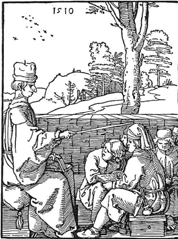
Der Schulmeister, Holzschnitt von Albrecht Dürer (1471–1528).