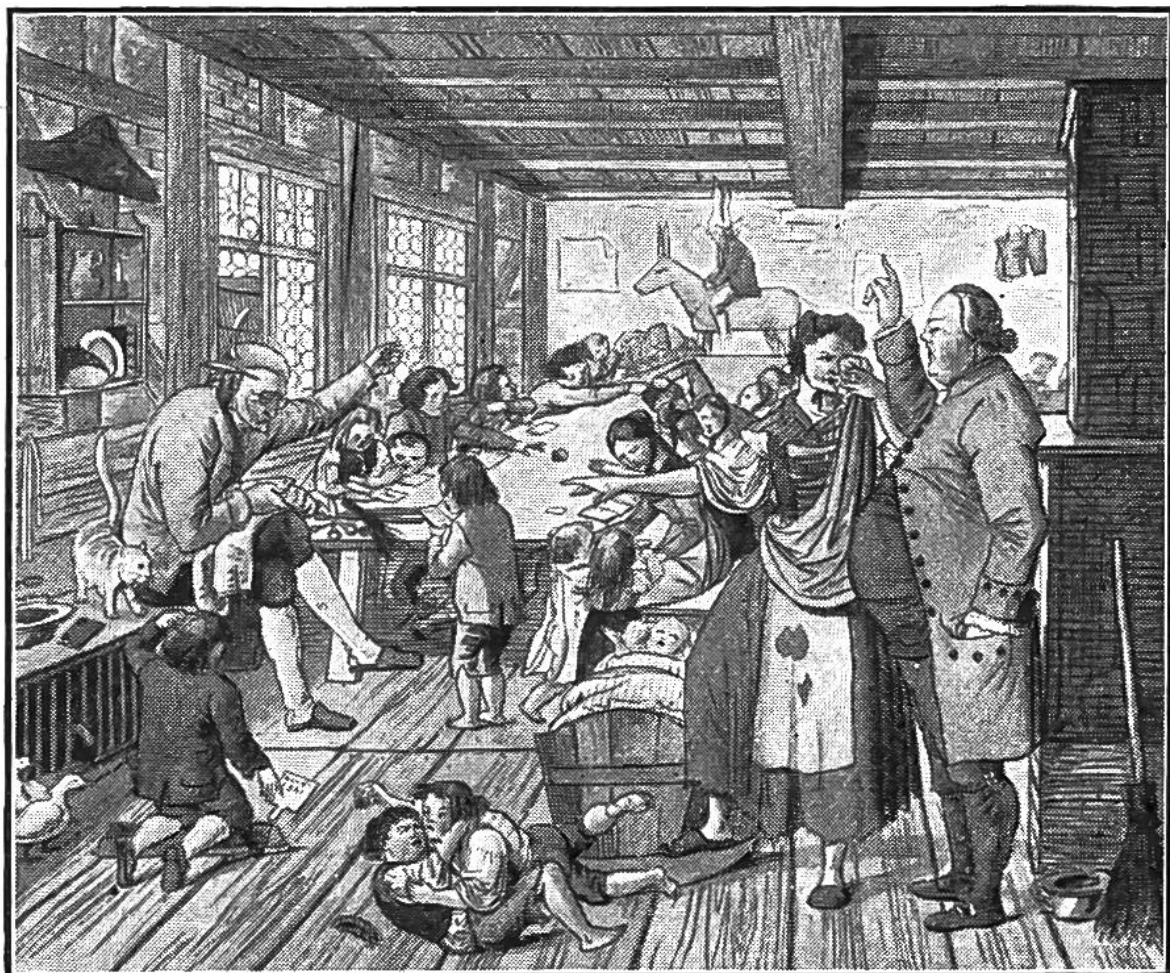
Landschule vor 120 Jahren. Der Dorfschneider ist zugleich Schulmeister. — Ein Schüler sitzt zur Strafe auf dem „Schulesel“, ein anderer muss auf einem kantigen Scheit knien.

notwendig, dass sie noch ein Handwerk ausübten. In einem Dörfchen des Berner Oberlandes verdiente noch ums Jahr 1800 der Ziegenhirt mehr als der Lehrer. Wenn man davon liest, dass die Lehrer „der guten alten Zeit“ wahre Prügelmeister waren, so hat man anderseits auch Beispiele von Lehrern, die tatsächlich aus Liebe zur Jugend ihres Amtes walteten.