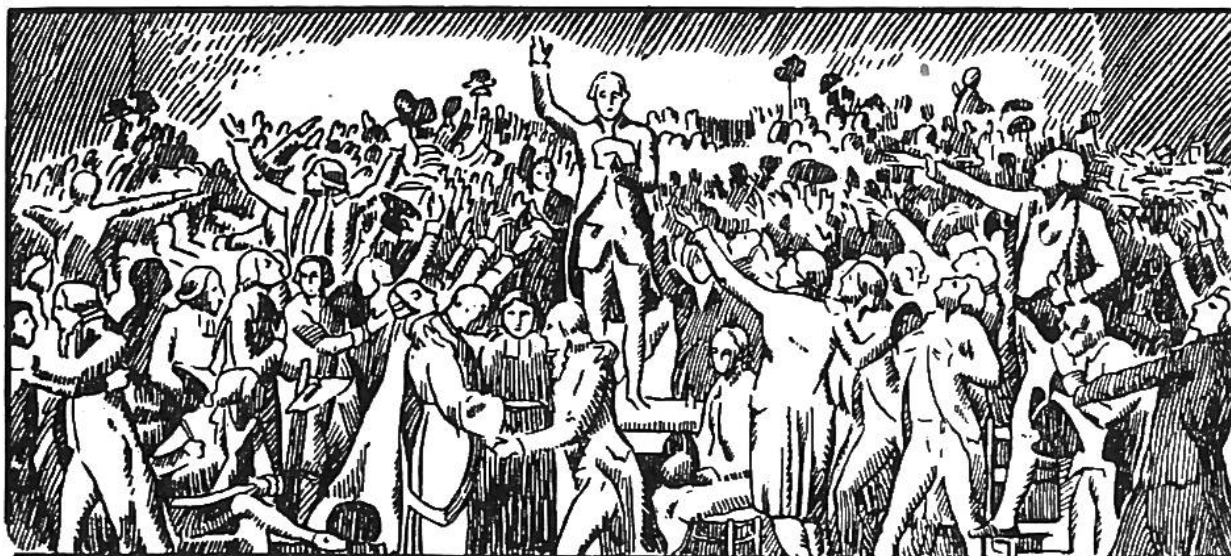
Der Schwur im Ballspielhause zu Versailles am 20. Juni 1789.