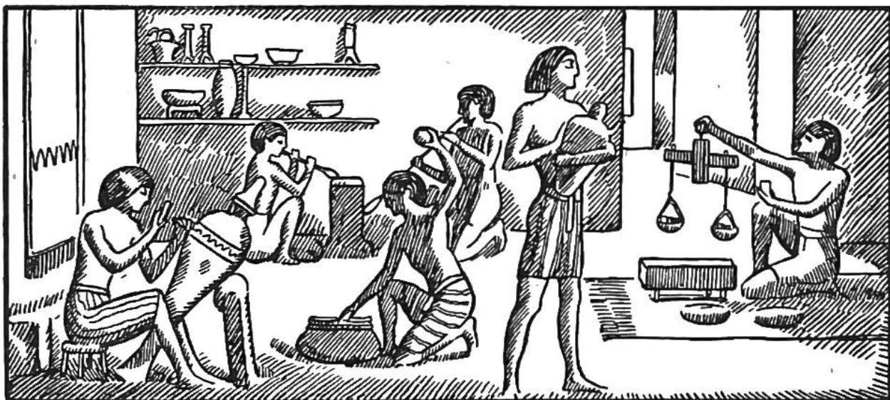
Handwerker in Ägypten.