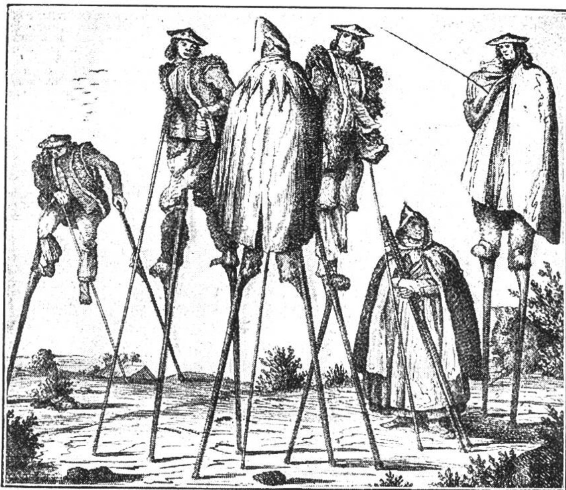
Stelzenlaufen in der Gascogne. (Nach einer Darstellung aus dem Jahre 1836.)

staltet, und zwar unter der Leitung von Lehrern und Schulbehörden. Jedenfalls eilen die Jungen von Inglewood im Stelzschritt nicht weniger flink und gewandt als die Bewohner des französischen Departements der Landes, die einmal vor mehr als hundert Jahren einen königlichen Besuch an ihrer Landesgrenze abholten und mit den Kutschen der hohen Herrschaften Schritt hielten, selbst wenn die Pferde scharfen Trab anschlügen. Übrigens gehen die Leute in den Landes noch heute vielfach hoch gestelzt einher und durchqueren trockenen Fusses bequem die vielen Sümpfe und Tümpel ihrer Heimat. Wer weiss, ob ihnen nicht der hochbeinige Storch, dieser natürliche Stelzenläufer, als Vorbild gedient hat für die Erfindung des praktischen Gehwerkzeuges.