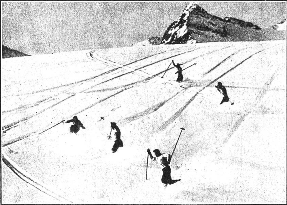
Pulverschnee. Mühelos zieht der Skifahrer seine Telemark-Schwünge in die aufstiebende, weisse Pracht.

Pulverschnee. Tritt nämlich nach Neuschneefall Frost ein, so wird der Schnee leicht und pulverig. Gewöhnlich ist Neuschnee erst nach 2—3 Tagen prima „skifertig“. Dann ist er genügend ausgekaltet und hat sich gesetzt, das Ideal für den Telemarkspezialisten. Kühn zieht er seine eleganten Schwünge mühelos in die aufstiebende Herrlichkeit. Aber auch für den Skisäugling wie für das Skibaby bietet der Pulverschnee das Ideal des „skirechten“ Schnees. Die Hölzer haben eine tadellose Führung und speziell das Fallen ist „viel angenehmer“.