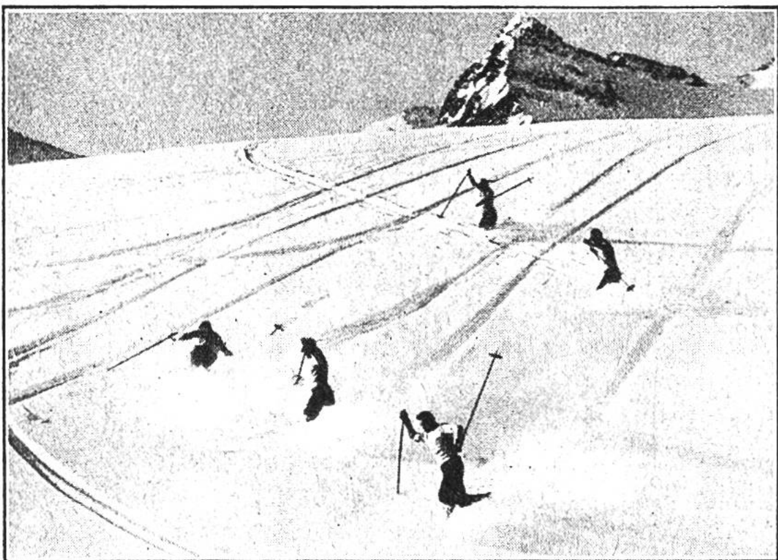
Pulverschnee. Mühelos zieht der Skifahrer seine Telemark-Schwünge in die aufstiebende, weisse Pracht.

Pulverschnee. Tritt nämlich nach Neuschneefall Frost ein, so wird der Schnee leicht und pulverig. Gewöhnlich ist Neuschnee erst nach 2—3 Tagen prima „skifertig“. Dann ist er genügend ausgekaltet und hat sich gesetzt, das Ideal für den Telemarkspezialisten. Kühn zieht er seine eleganten Schwünge mühelos in die aufstiebende Herrlichkeit. Aber auch für den Skisäugling wie für das Skibaby bietet der Pulverschnee das Ideal des „skirechten“ Schnees. Die Hölzer haben eine tadellose Führung und speziell das Fallen ist „viel angenehmer“.