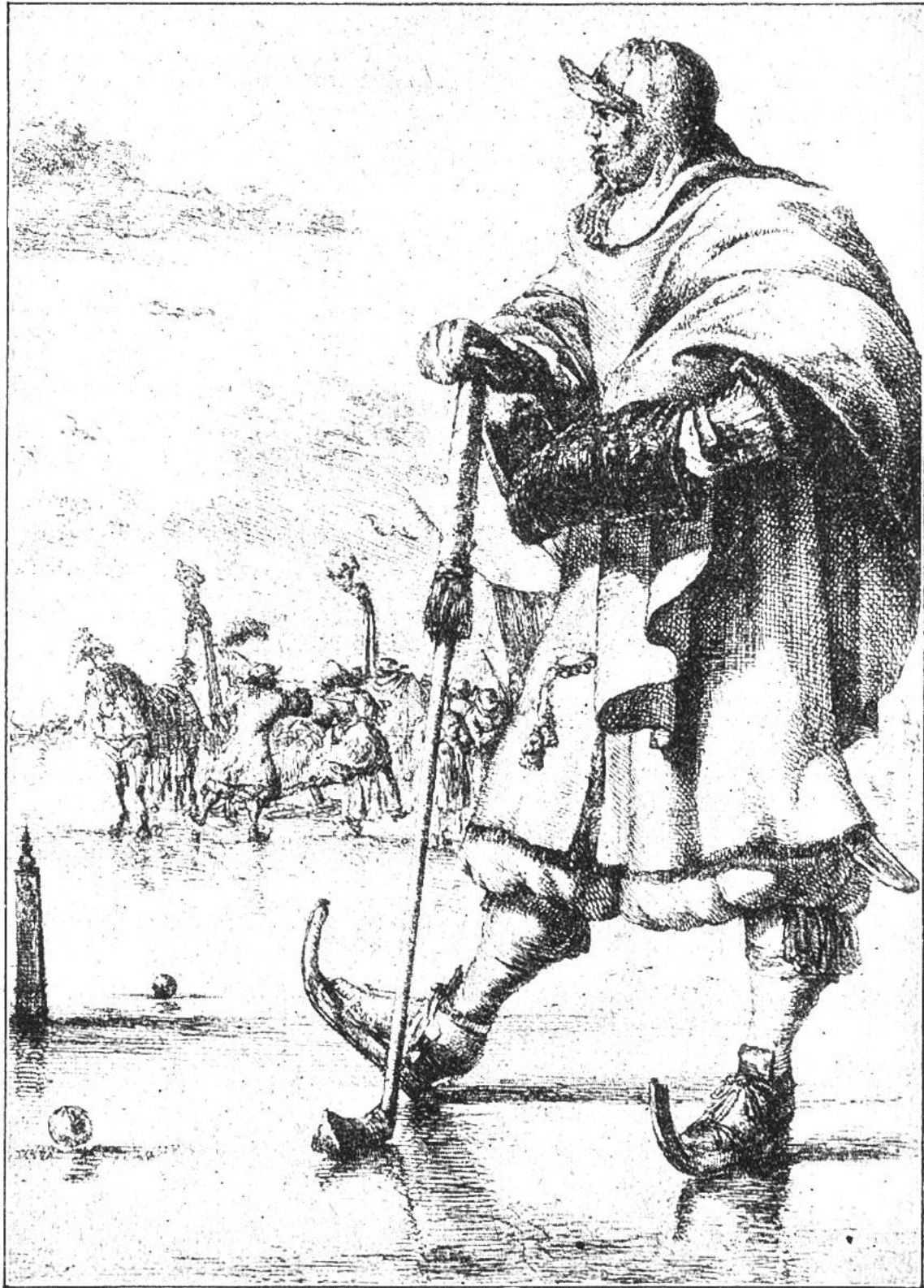
Holländer in malerischer „Sporttracht“ bei einem hockey- oder polo-ähnlichen Spiel auf dem Eise. (Nach einem Stich Romeyn de Hooghes vom Jahre 1675.)