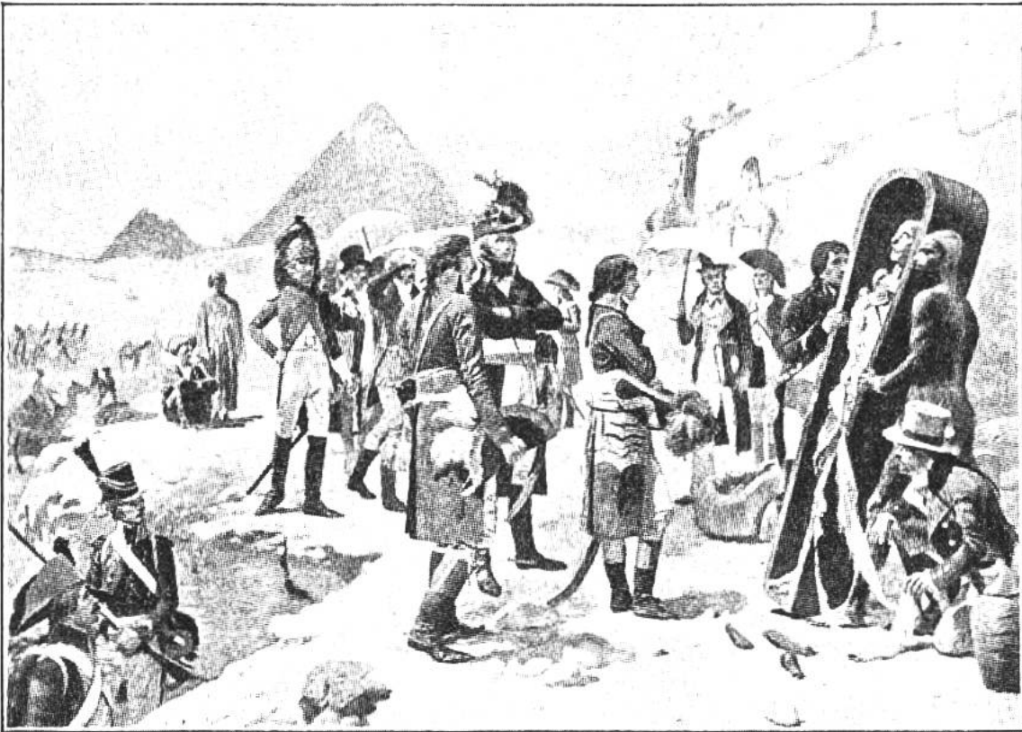
General Napoleon Bonaparte vor der Mumie eines ägyptischen Königs.

Arzt Dr. Young auf den glücklichen Gedanken, umrandete Schriftzeichen bedeuteten wohl Königsnamen. An Hand des griechischen Textes fand er seine Annahme bestätigt; er konnte so eine Anzahl Schriftzeichen deuten.