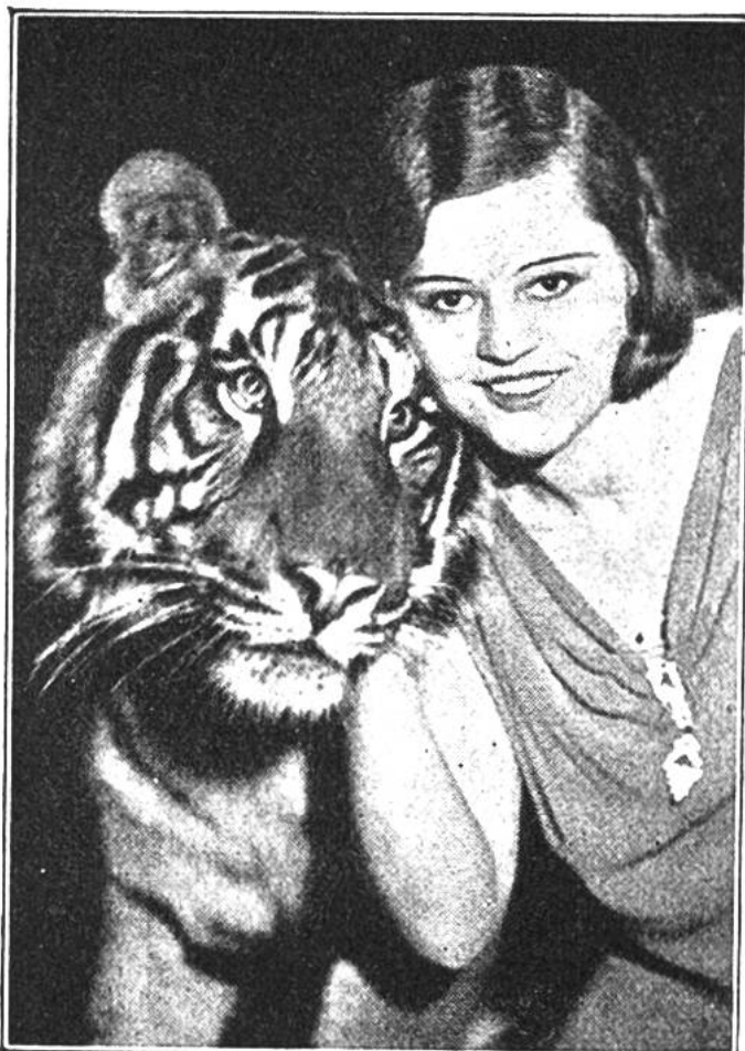
Bildnis zweier guter Freunde. Auch der Tiger hat ein Gefühl dafür, wer es gut mit ihm meint.

Gehorsam fordern darf, sondern mehr ein überlegener Freund, der seinen Schutzbefohlenen gegenüber eine grosse Verantwortung trägt. Wie gut hat es da die Bauernjugend. Von früh auf kennt sie die Tiere in Haus, Feld und Wald, kann die eigentümlichen Gewohnheiten eines jeden beobachten, seinen Kampf ums Dasein, seine Lebensfreude und seine dumpfe Not.