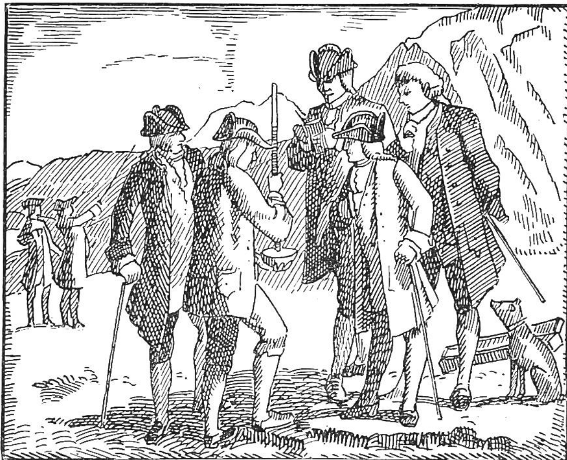
Périers Versuch mit der Torricellischen Röhre (am 20. Sept. 1648 auf dem Puy de Dôme) zum Nachweis der Abnahme des Luftdrucks in der Höhe. Périer misst die Höhe der Quecksilbersäule.