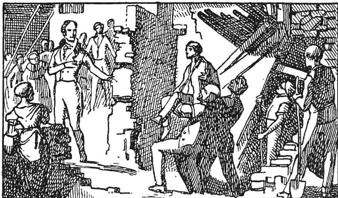
Der Glaserlehrling Fraunhofer wird aus den Trümmern eines eingestürzten Hauses gerettet.