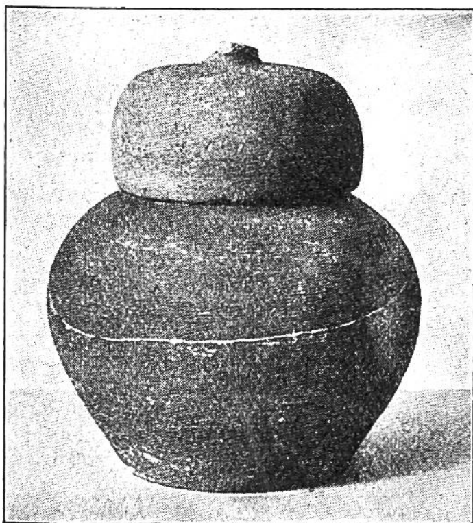
Bild des Topfes aus unglasiertem Ton, der den Silberschatz enthielt.

und die überraschten Arbeiter sahen einen Haufen silberglänzender Münzen in die frisch aufgewühlte Erde herausrieseln. Ein Aufseher trat hinzu; Münzen und Scherben wurden gesammelt. Bis auf kleine Bruchstücke konnte der urnenförmige Topf zusammengekittet werden.