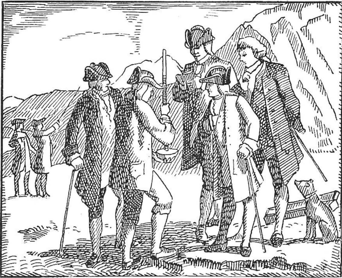
Périers Versuch mit der Torricellischen Röhre (am 20. Sept. 1648 auf dem Puy de Dôme) zum Nachweis der Abnahme des Luftdrucks in der Höhe. Périer misst die Höhe der Quecksilbersäule.