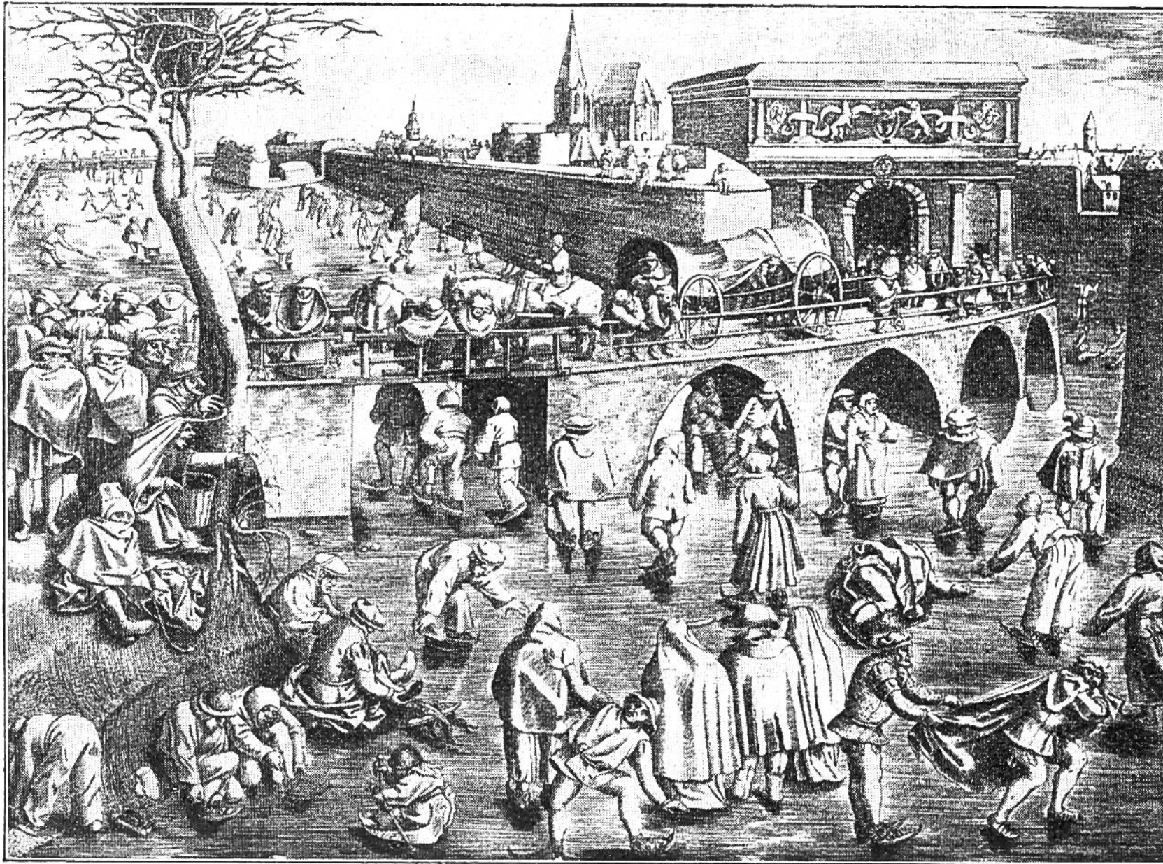
Eislauf. Nach einem Stich aus dem Jahre 1525.