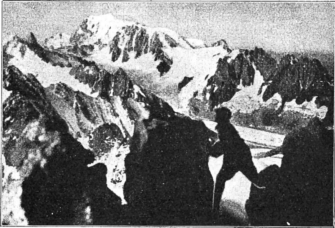
Naturaufnahme? Waghalsige Kletterei im Montblanc-Gebiet!