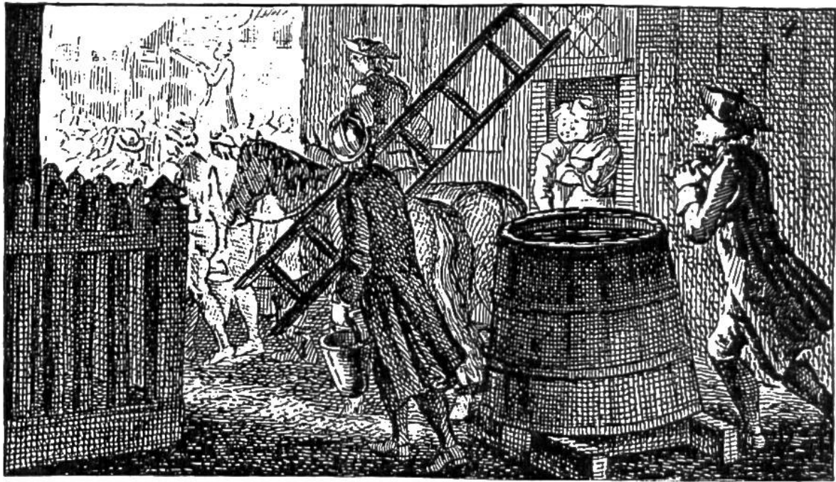
Auf zur Brandstätte! (Nach einem Stich Chodowieckis, 1726-1801.)

weglicher zu machen und den kräftigen Wasserstrahl aus noch grösserer Nähe auf die Flammen niederprasseln zu lassen.