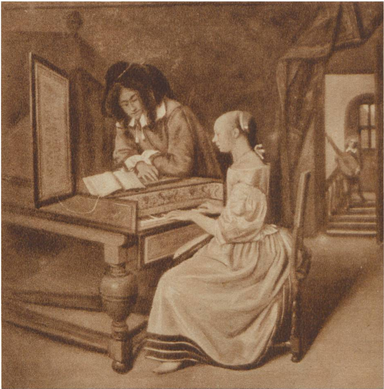
Musikstunde, von Jan Steen, Leiden, 1626—1679. Nationalgalerie, London.