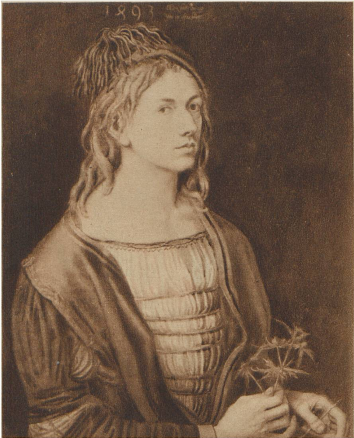
Selbstbildnis von Albrecht Dürer im Alter von 22 Jahren. (1471– 1528). Louvre, Paris.