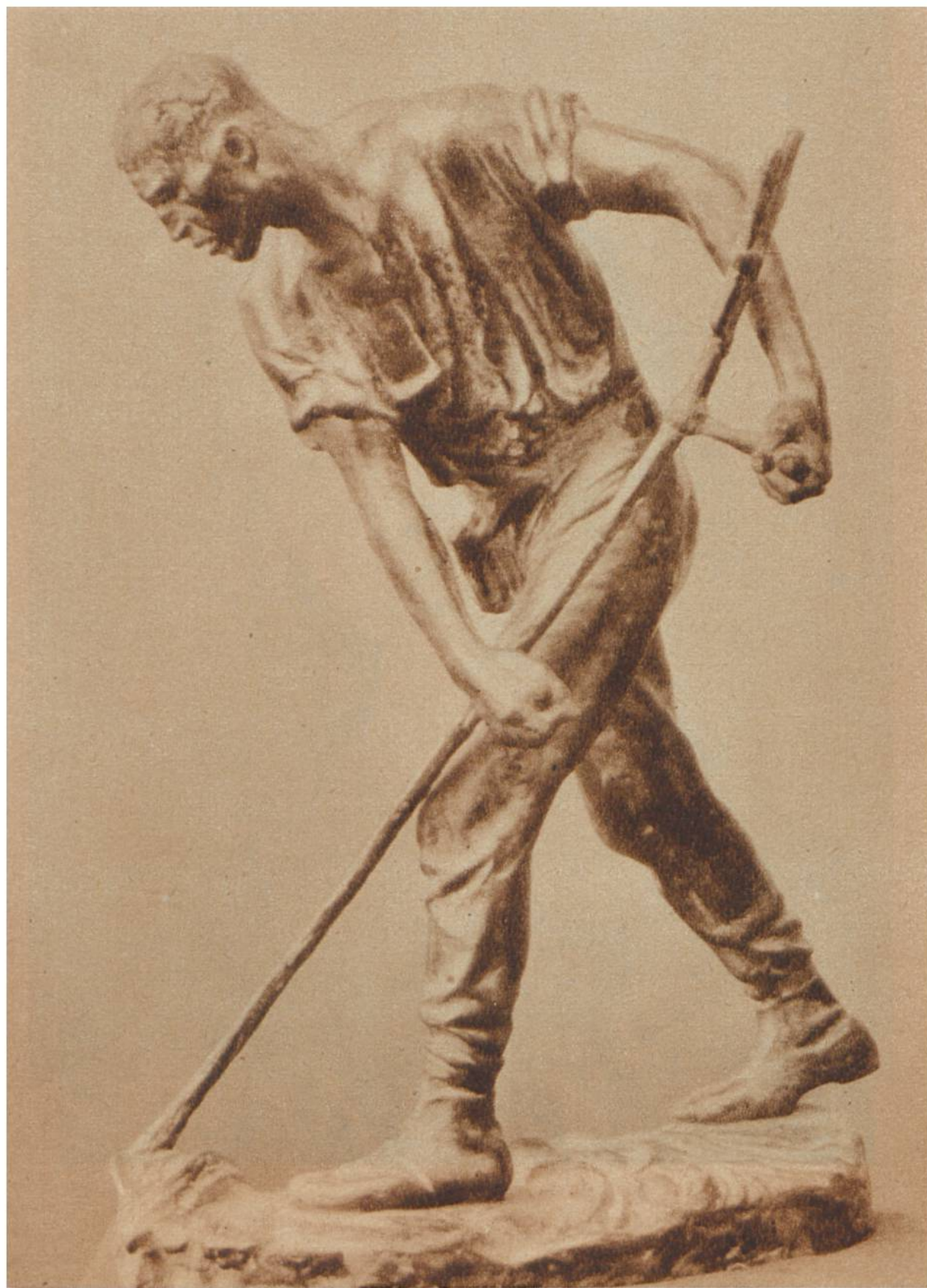
Der Schnitter, Skulptur von Constantin Meunier, Brüssel, 1831—1905.