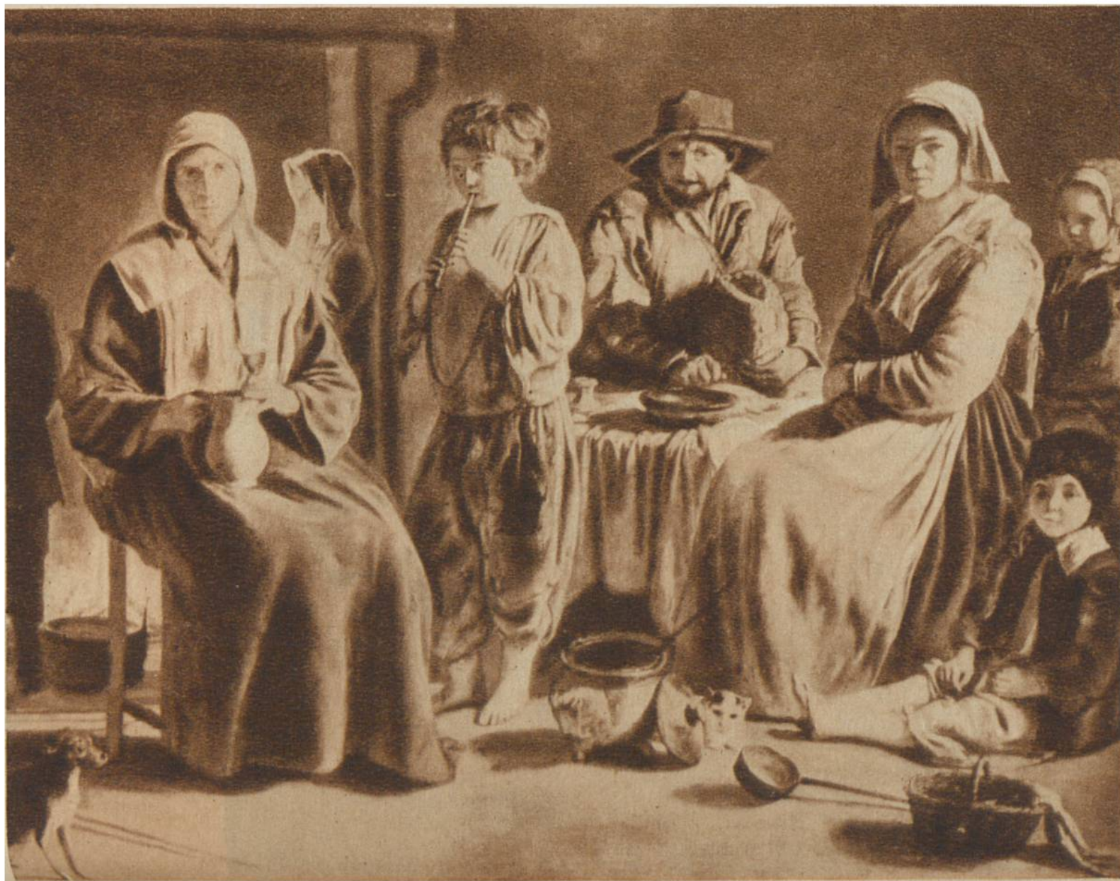
Bauernfamilie, v. Lenain, Laon, um 1600. Louvre, Paris.