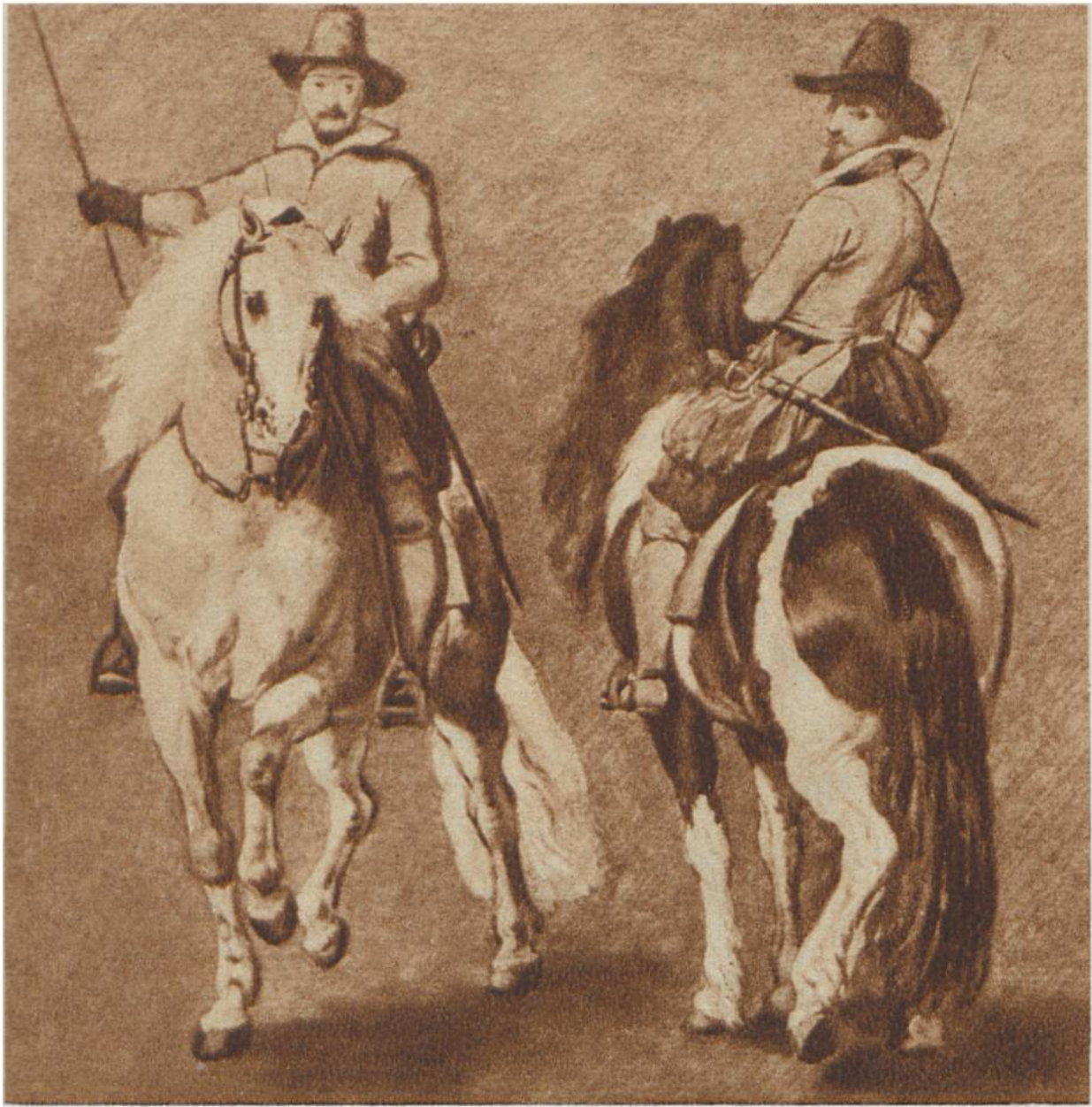
Reiterstudien, von Anthonis van Dijck, Antwerpen, 1599—1641. Buckingham Palast, London.