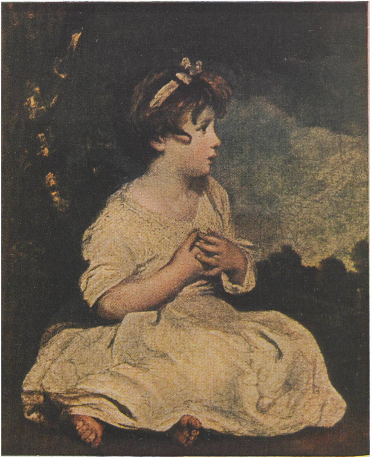
K I N D H E I T von Joshua Reynolds, Plymouth 1723—1792. Nationalgalerie, London.