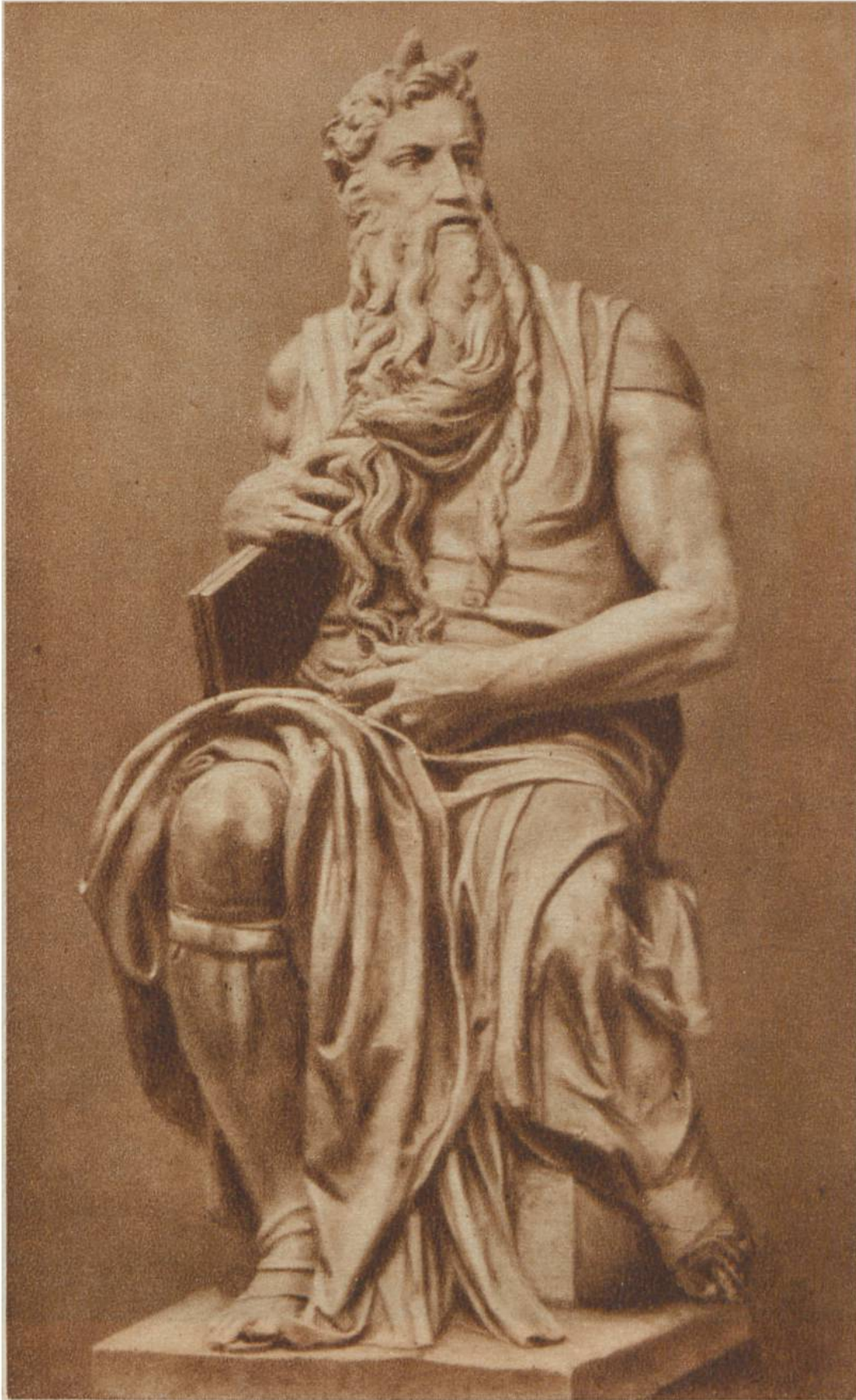
Moses, Hauptfigur des Grabmales von Papst Julius II., ausgeführt von Michelangelo, um 1530, in der Kirche San Pietro in Vincoli zu Rom.