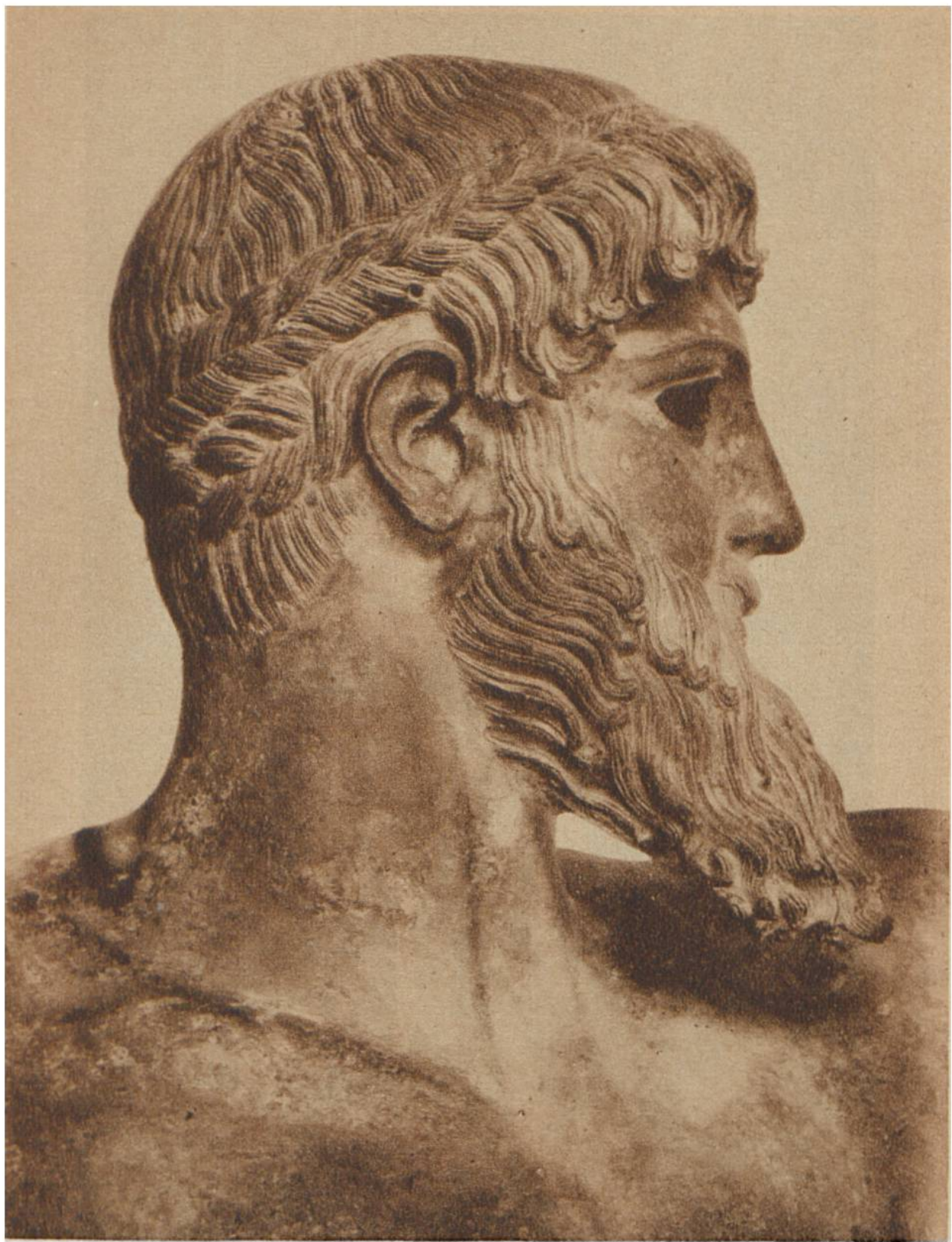
Kopf der Bronzestatue des Zeus (a. d. Meere v. Artemision, Griechenld., gehoben). Ca. 460 v. Chr. Nationalmuseum, Athen.