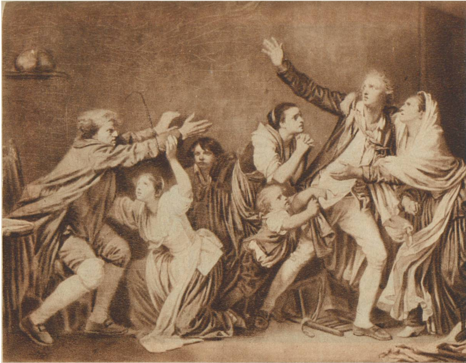
Des Vaters Fluch, von Jean Baptiste Greuze, Paris. 1725-1805. Louvre, Paris.