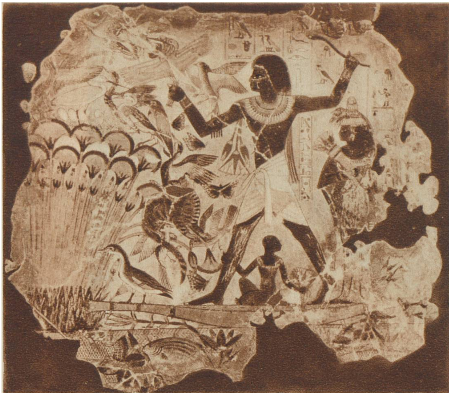
Auf der Vogeljagd. Wandgemälde in einer Grabkammer von The- ben. Um 1200 v. Chr.