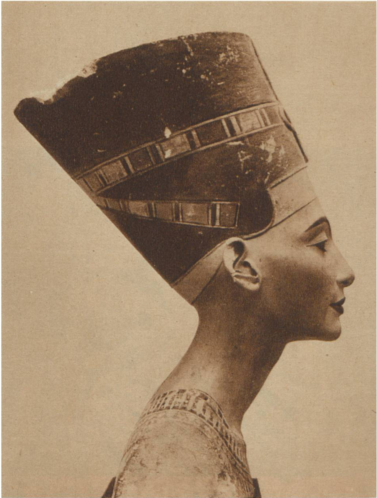
Königin Nofret-ete, Gemahlin des Amenophis IV. (um 1400 v. Chr.) Aegyptisches Museum, Berlin.