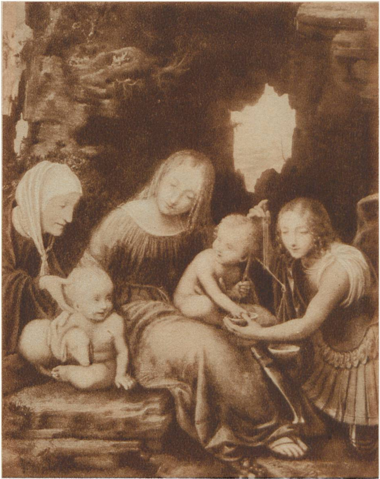
Madonna, von Leonardo da Vinci, Florenz, 1452—1519. Louvre, Paris.