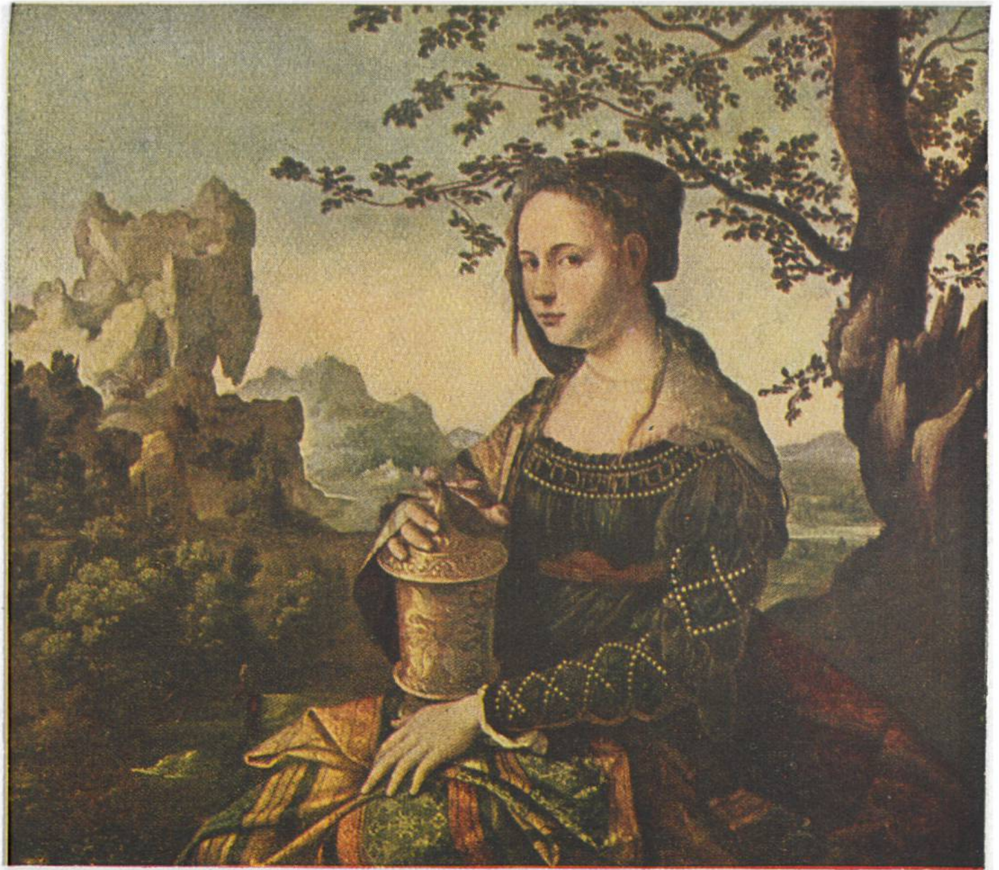
HEILIGE MAGDALENA von Jan Scorel, Utrecht 1495—1562. Rijksmuseum, Amsterdam.