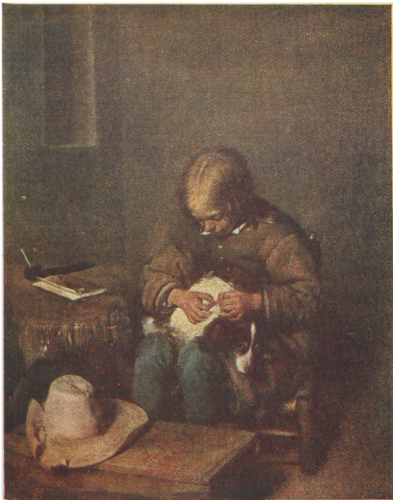
KNABE MIT HUND von Gerard Terborch, Haarlem 1617—1681. Alte Pinakothek, München.