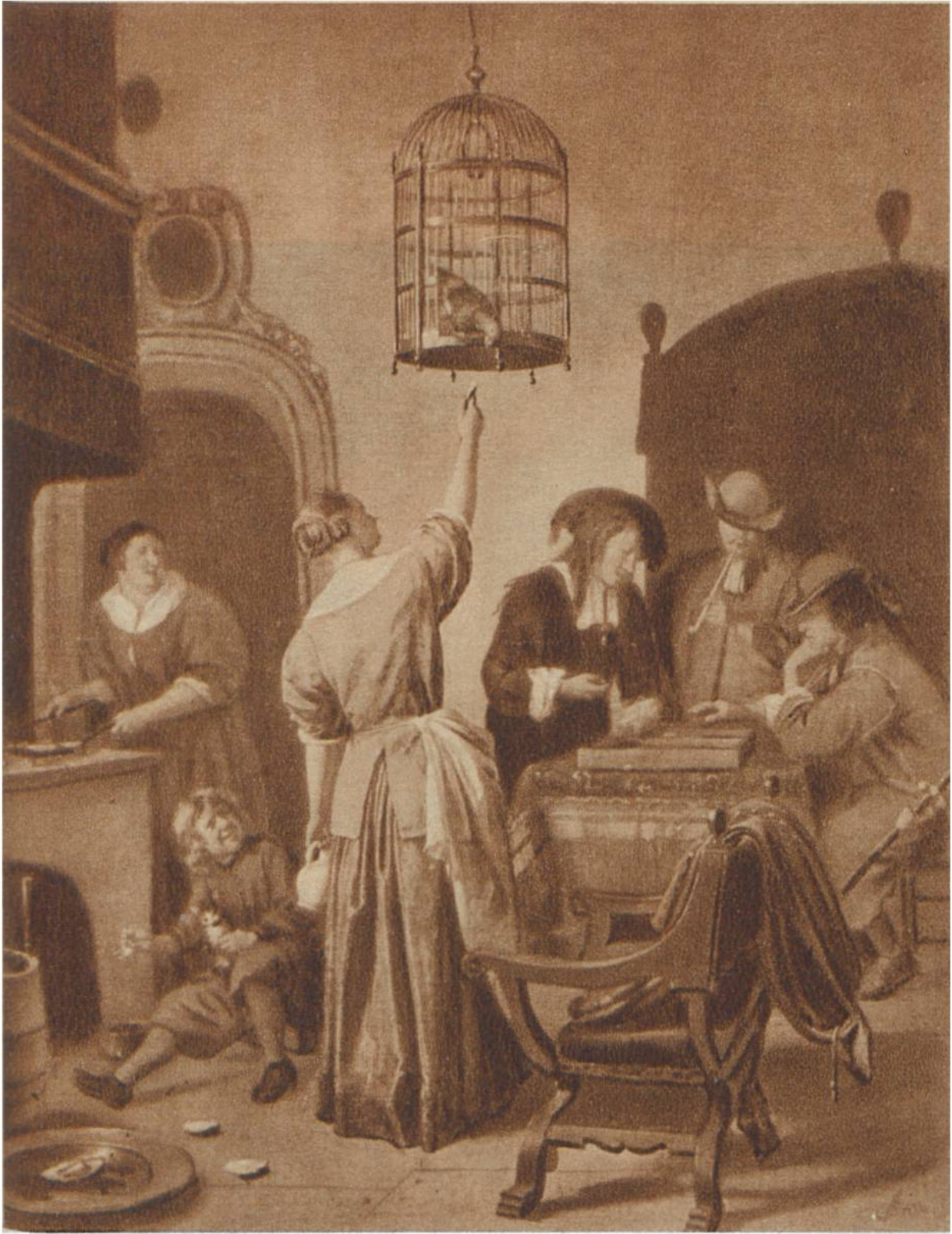
Der Papageienkäfig, von Jan Steen, Leiden, 1626—1679. Rijksmuseum, Amsterdam.