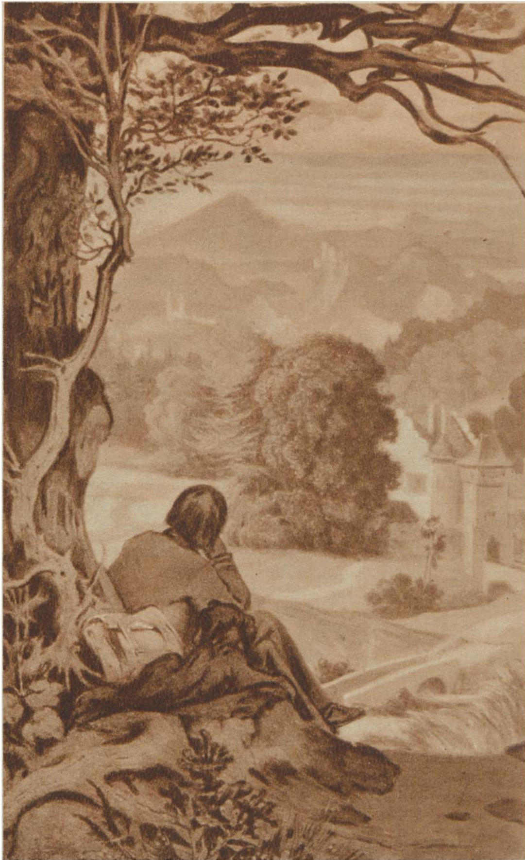
Auf der Wanderung, von Moritz von Schwind, München, 1804 — 1871. Schack-Galerie, München.