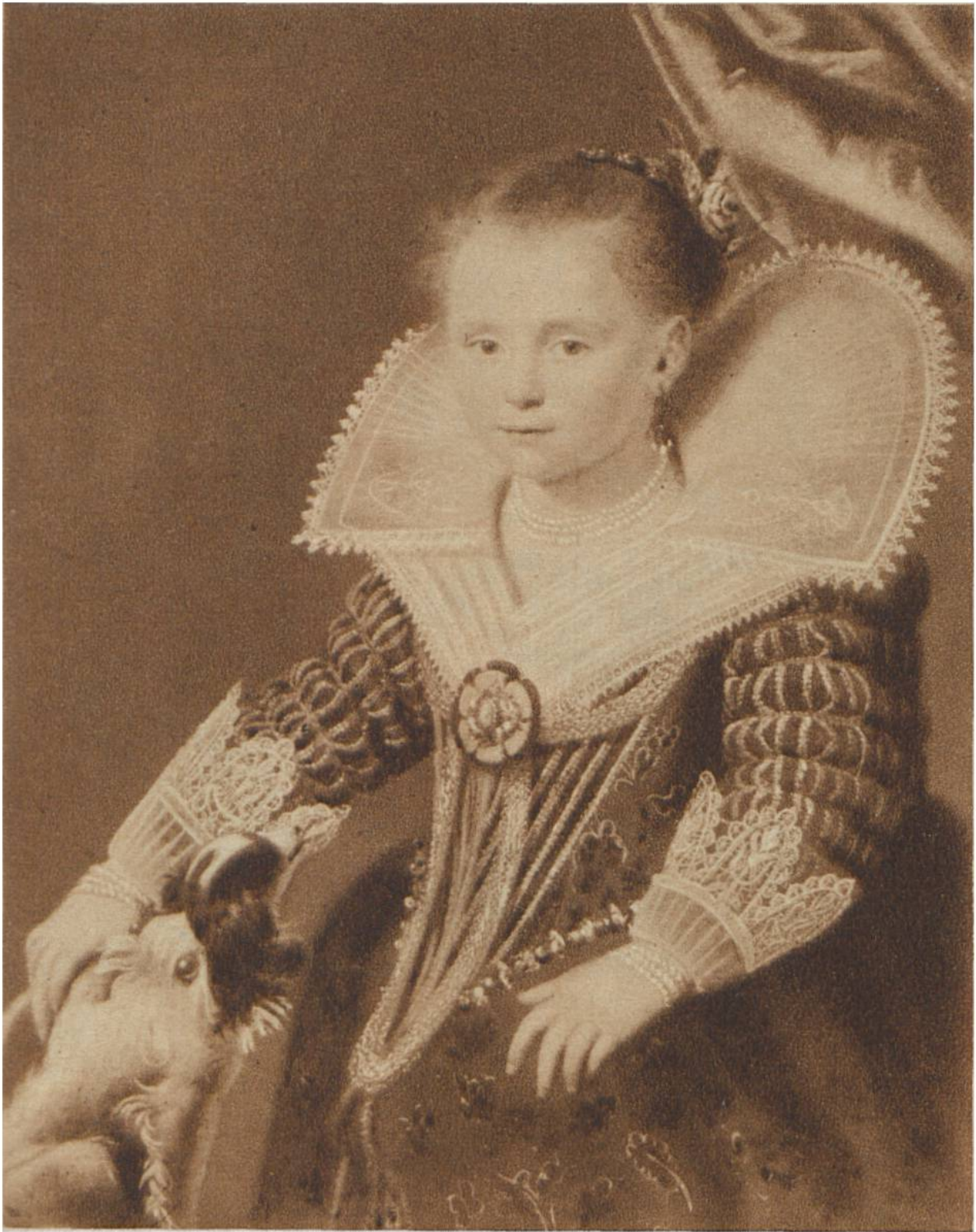
Die kleine Prinzessin, von Paulus Moreelse, Utrecht, 1571—1638. Rijksmuseum, Amsterdam.