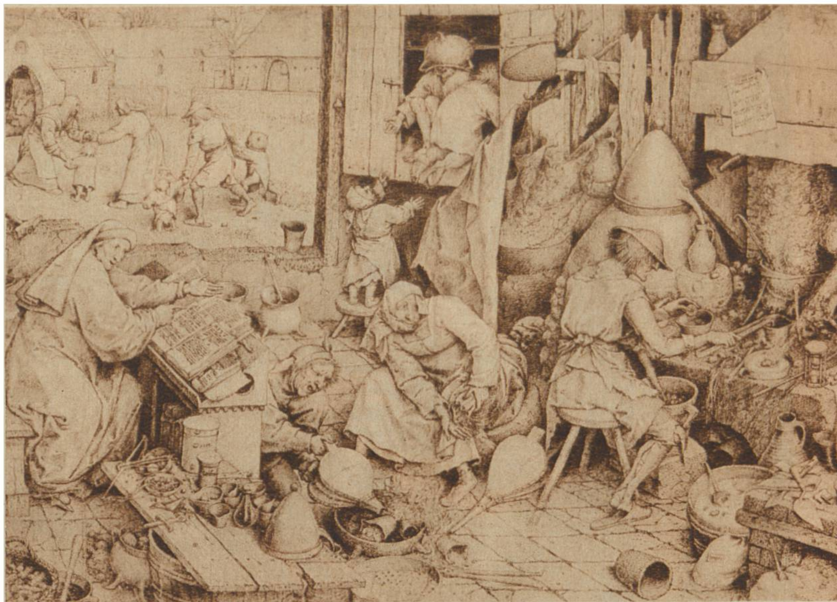
Der Alchimist, v. Pieter Bruegel- hel, dem Äl- tern, Brüssel, 1525 — 1569.