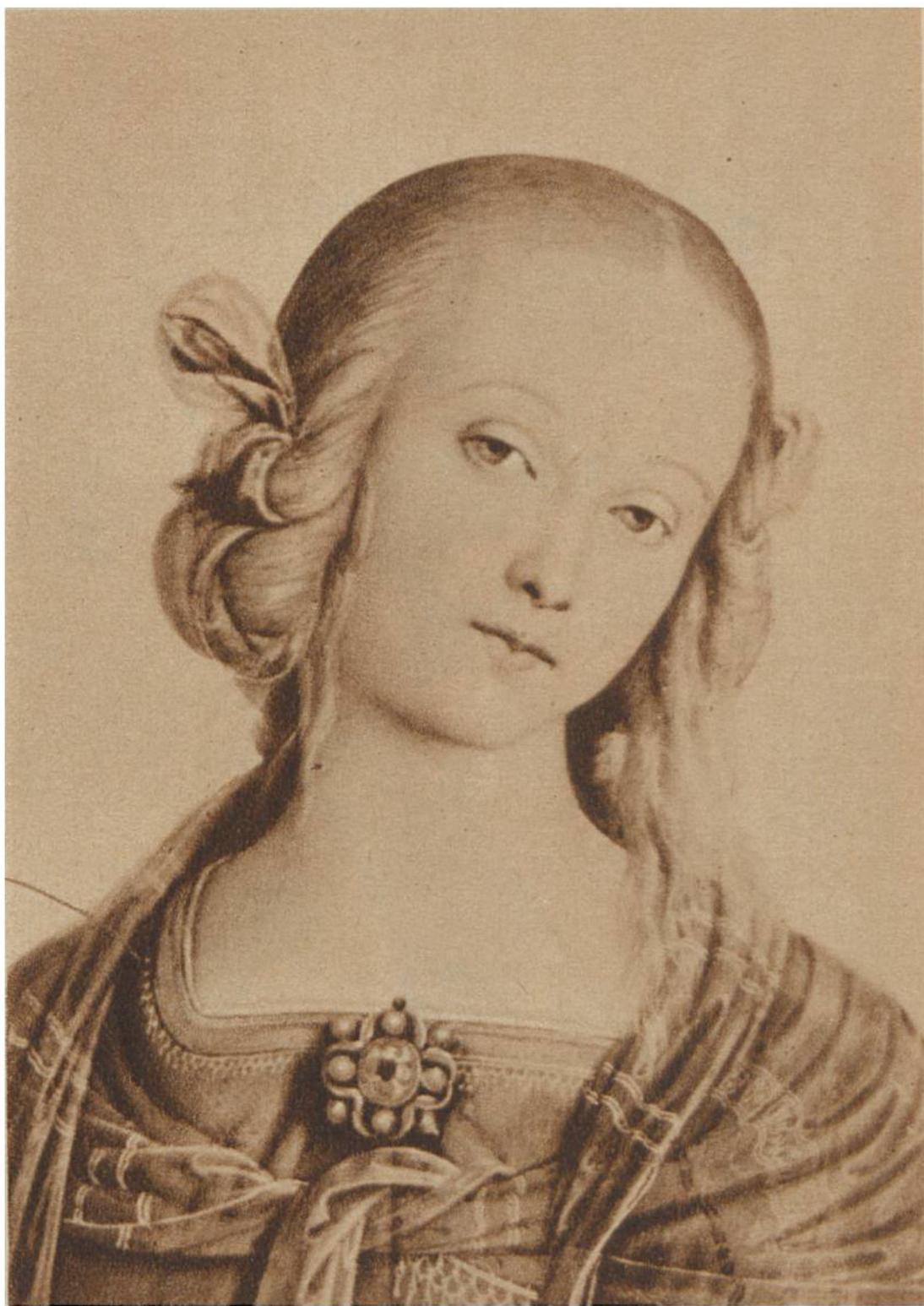
Bildnis der Maria aus dem Gemälde «Maria mit dem Kinde», von Perugino, Perugia, 1446—1523. Louvre, Paris.