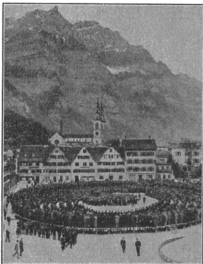
Die Landsgemeinde von Glarus. Seit 1352, dem Jahr der Befreiung von Oesterreich, findet in Glarus alljährlich eine Landsgemeinde statt.

hatte vom Jahre 1389 hinweg bis 1848 seine Landsgemeinde.