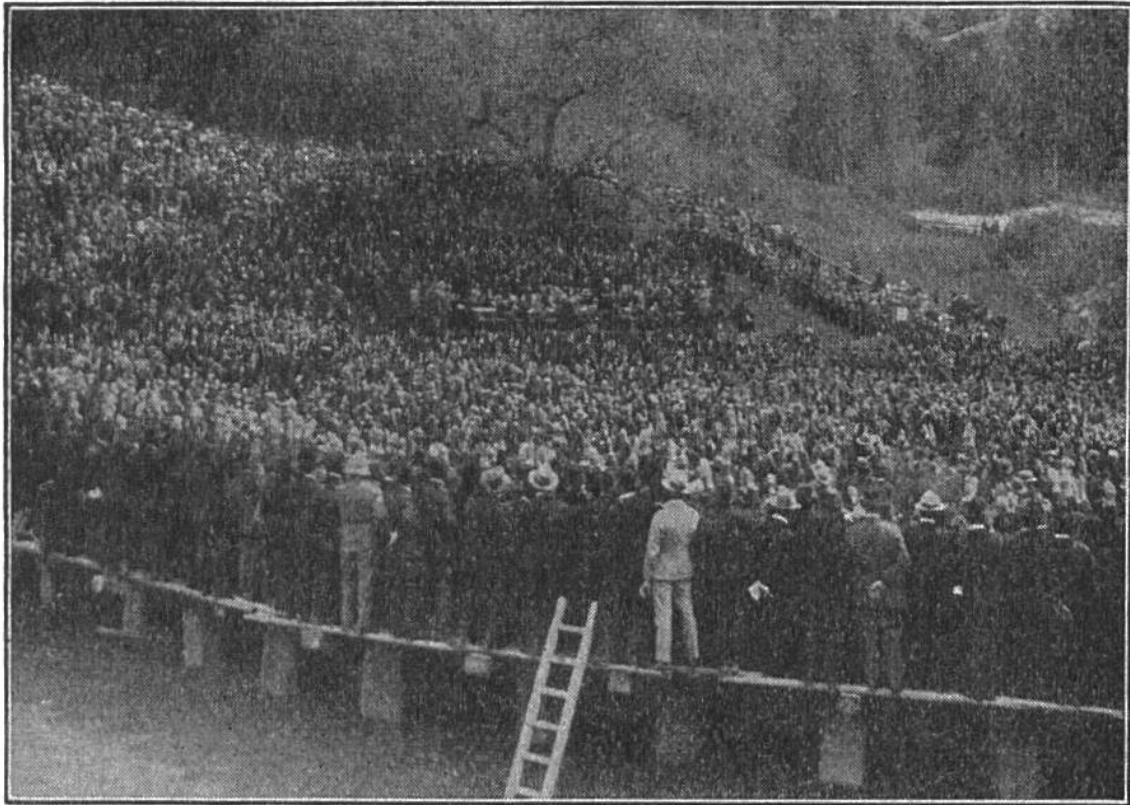
Urner Landsgemeinde vom Jahre 1928 auf dem „Ackerli“ bei Bötzingen, an welcher das Volk die Aufhebung der altherwürdigen Versammlungen beschloss.

platz des Fleckens Schwyz bewegte sich jeweils der Zug aller Teilnehmer hinaus nach Ibach. Voran marschierten, in die Schwyzer Farben gekleidet, die 36 Landstrommler und die 12 Landspfeifer. Dann kam die Obrigkeit. Früher sassen die Herren zu Pferd, jetzt gehen sie bescheiden zu Fuss wie das übrige Volk. Sie waren alle schwarz gekleidet, in Mantel und weisser Halskrause, und trugen den Degen. An der Spitze gingen der Landammann und der Regierungsstatthalter, ihnen zur Seite acht stramme Hellebardierte. Der Weibel trug das Zeichen der Macht, das Landesschwert, dem Ammann voran. Nun folgten die Landleute, und den Zug beschloss Gerichtsdiener und zwei Läufer in rotem Gewand. Auf dem Landsgemeindeplatz eröffnete der Landammann die Versammlung. Alle knieten zum Gebet nieder. Dann begann der Landammann mit einer kurzen Rede, in der er das Volk ermahnte, mitzuarbeiten zum Wohle des Landes. Er berichtete, was an