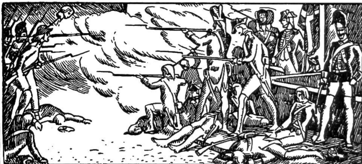
Verteidigung der Tuileries durch die Schweizergarde.