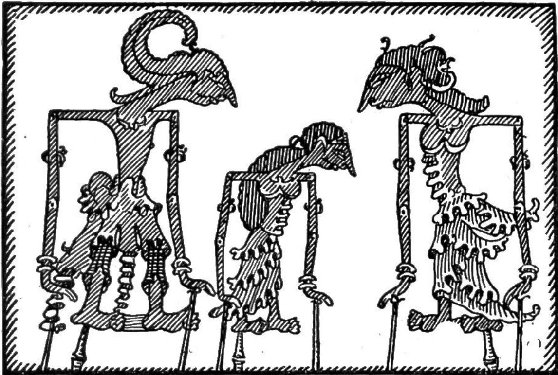
Figuren des javanischen Puppenspiels, Götter und Geister darstellend, aus Büffelleder ausgeschnitten und im Umriss ganz auf übertreibende Schattenwirkung berechnet.

schauer bekommt überhaupt nicht die Puppen selbst zu Gesicht, sondern auf einem grossen, weissen Wandschirm die Schatten der kleinen Schauspieler. Schräg über dem Schirm hängt eine Ampel. Sie spendet das nötige Licht, dem die Schattenwirkungen zu verdanken sind. Unmittelbar vor dem Schirm kauern die Musikanter. Es sind oft bei 20 Mann. Dieses Orchester spielt seltsame Instrumente, und noch seltsamer sind die Klänge, die es ihnen entlockt. Da gibt es einige verschieden grosse und verschieden abgestimmte Schlaginstrumente. Sie sind aus runden Metallplatten zusammengesetzt, die in der Mitte eine bucklige Auswölbung haben, und heissen Gongs. Die Gongs liegen beinahe wie Pfannendeckel auf Kesseln auf. Schlägt der Musikant mit seinen zwei Filzklöppeln die Metallplatten an, so erklingt ein voller Ton, der bald weich, bald ehern hart und fast grell ist, je nach der Art des Anschlags.