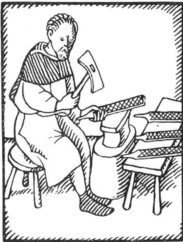
Seilenhauer. (Nach einer Zeichnung aus dem Jahr 1417.)

rauhe Haut dieses Haifisches zum Glätten von Holz und Marmor verwendet, leistete also den Dienst der Seile. Seilen aus Fischehaut sind auch gegenwärtig noch in Gebrauch bei Naturvölkern. Richtige Seile stellte schon der Bronzezeit-Mensch her, offenbar nach dem Vorbild, das ihm die Natur mit der Fischehaut bot.