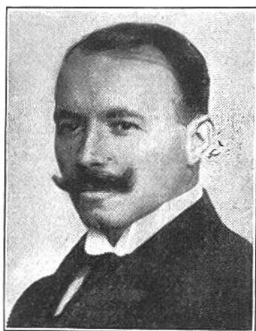
Dr. Jean Musy von Albeuve, Freiburg * 1876, seit 1920 i. Amte