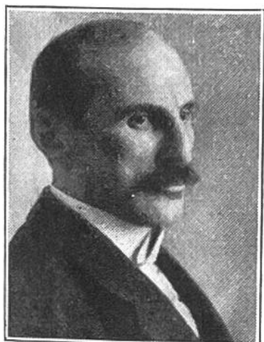
Heinrich Häberlin v. Bilslegg u. Frauenfeld * 1868, seit 1920 i. Amte

Dr. Motta: Chef d. Po- litischen Departements. Dr. Chuard: Chef d. De- partements des Innern. Häberlin: Chef d. Justiz- u. Polizeidepartements. Scheurer: Chef des Mi- litärdepartements. Dr. Musy: Chef des Finanz- und Zolldepartements. Schulthess: Chef d. Volks- wirtschaftsdepart. Dr. Haab: Chef d. Post- u. Ei- senbahndepartements.