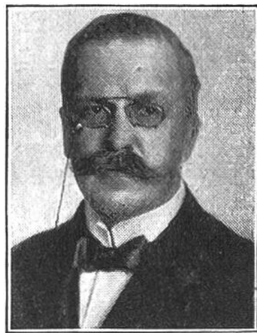
Edmund Schulthess von Brugg * 1868, seit 1912 i. Amte