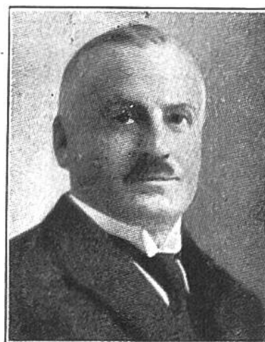
Dr. Giuseppe Motta von Airolo * 1871, seit 1912 i. Amte

Dr. Motta: Chef d. Po- litischen Departements. Dr. Chuard: Chef d. De- partements des Innern. Häberlin: Chef d. Justiz- u. Polizeidepartements. Scheurer: Chef des Mi- litärdepartements. Dr. Musy: Chef des Finanz- und Zolldepartements. Schulthess: Chef d. Volks- wirtschaftsdepart. Dr. Haab: Chef d. Post- u. Ei- senbahndepartements.