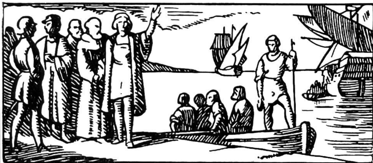
Kolumbus verläßt Spanien zu seiner ersten Entdeckungsreise.

1481 Stanser Verkommnis, Nikolaus von Flüe als Friedensstifter. Freiburg und Solothurn werden in den eidgenössisch. Bund aufgenommen.