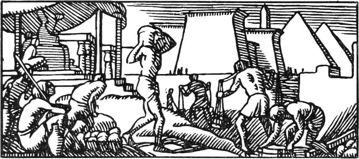
Ägypter beim Pyramidenbau.