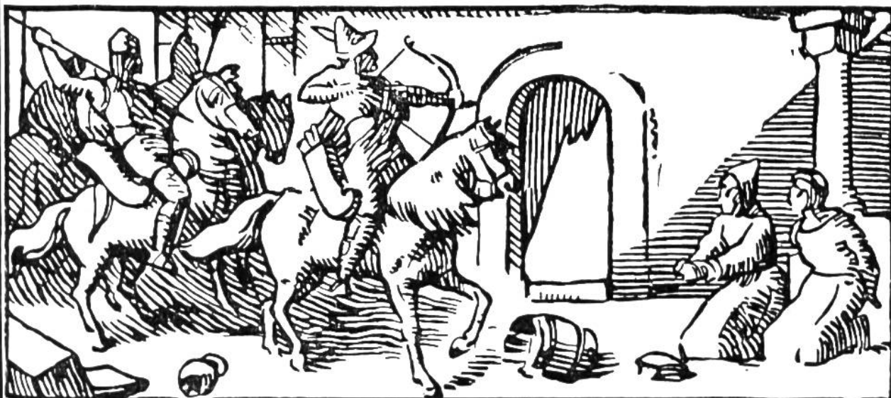
Ein Überfall im Kloster St. Gallen.