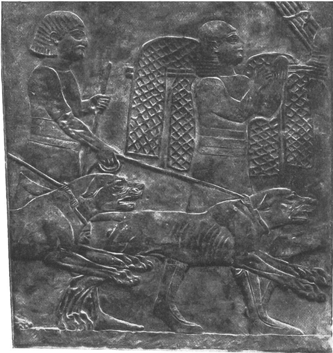
Diener des assyrischen Königs Assurbanipal eilen mit reißenden Doggen und Netzen zur Jagd. Teilstück eines Steinreliefs aus dem 7. Jahrhundert vor Christi Geburt.

balsamierten und ihnen auf besonderem Friedhof schöne Grabmäler errichteten. Auf assyrischen Steinreliefs sind vielfach Jagden von Löwen und Wildpferden dargestellt; mächtige raubtierartige Doggen greifen das Wild an und bringen es zur Strecke. Diese Doggen entstammen, wie der ägyptische Hund, dem Schakal, jedoch einer viel größeren und kräftigeren Art. In welcher Zahl assyrische Herrscher solche Jagddoggen hielten, geht daraus hervor, daß große Städte von allen Abgaben befreit waren, dafür aber für das Hundefutter aufkommen mußten.