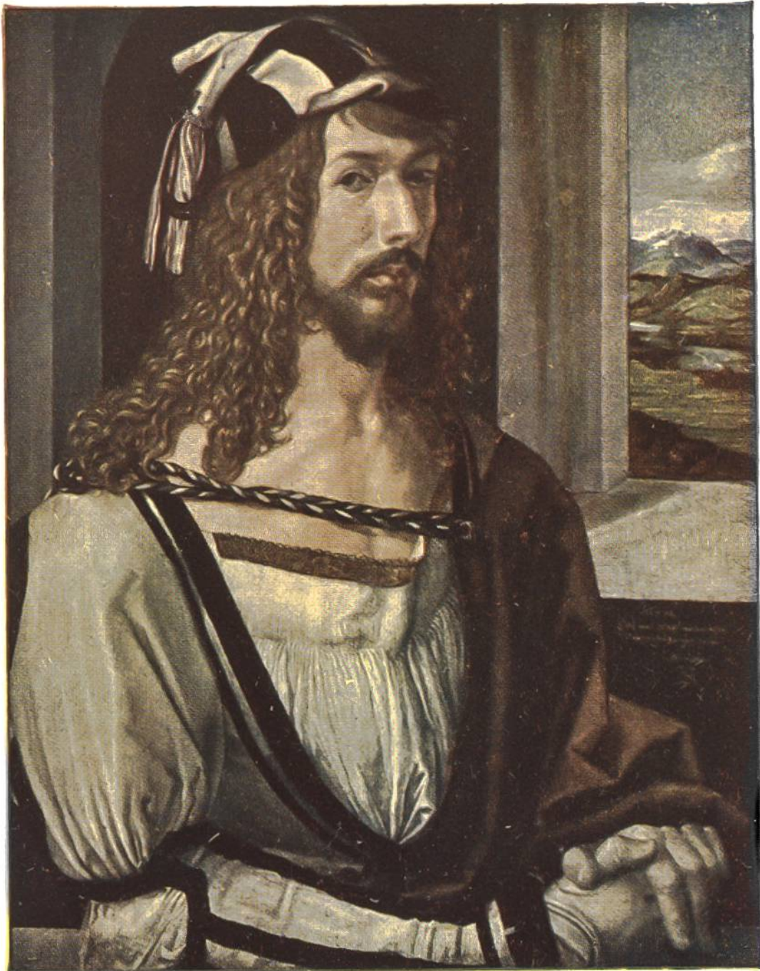
SELBSTBILDNIS IM ALTER VON 26 JAHREN von Albrecht Dürer, Nürnberg 1471–1528. Prado, Madrid.