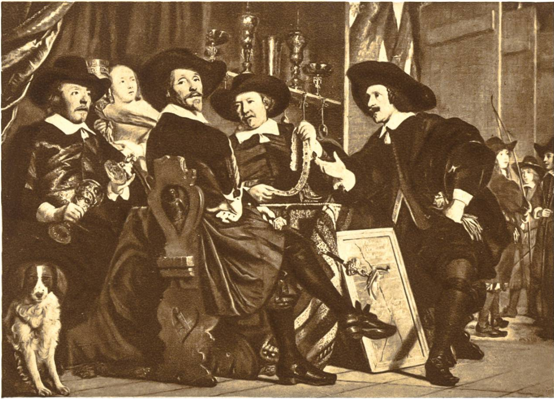
Preisverteilung von Bartholomäus van der Helst, Amsterdam, 1613-1670. Louvre, Paris.