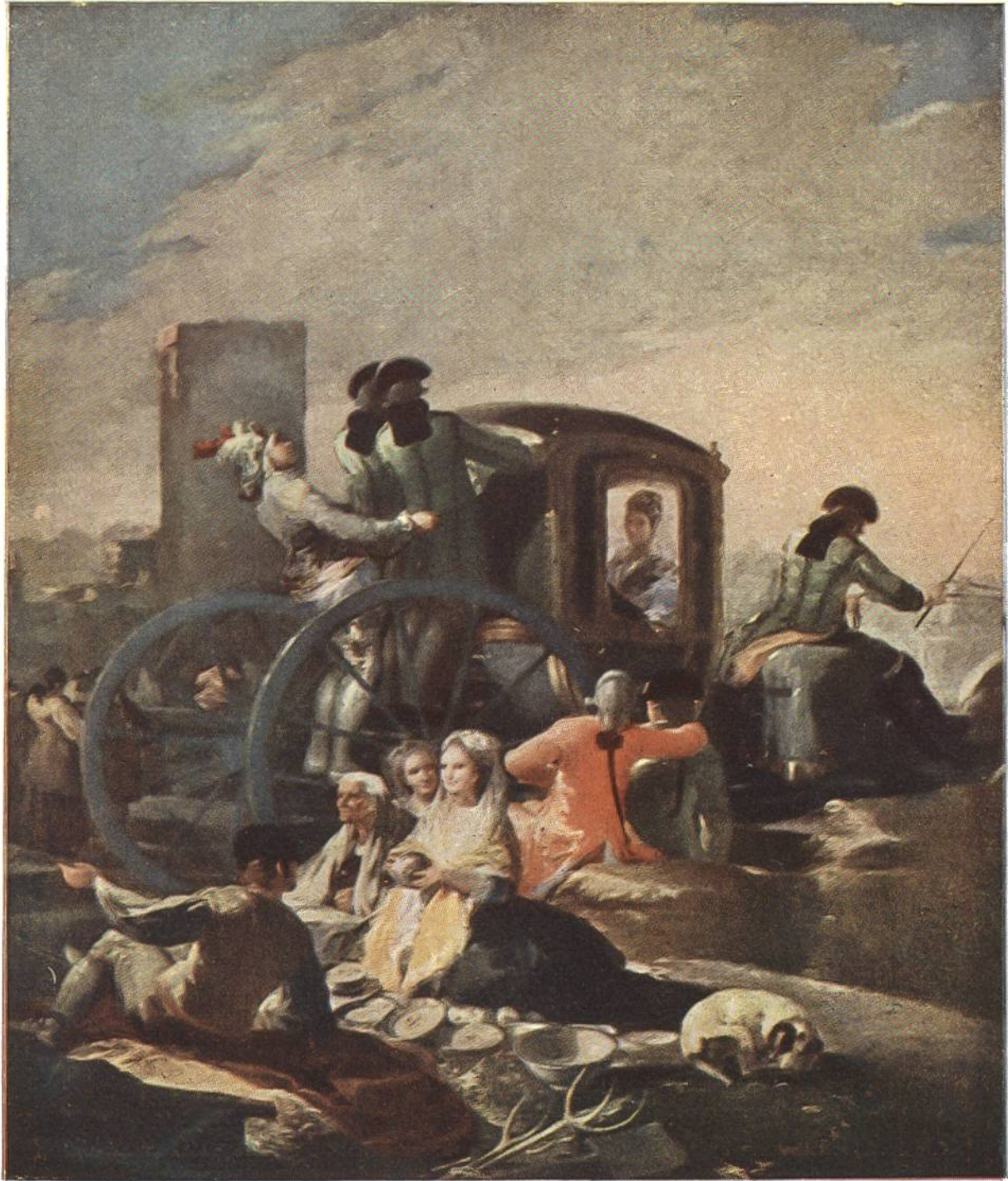
DER TÖPFERWARENHÄNDLER, von Francisco Goya, Madrid 1746—1828. Prado, Madrid.