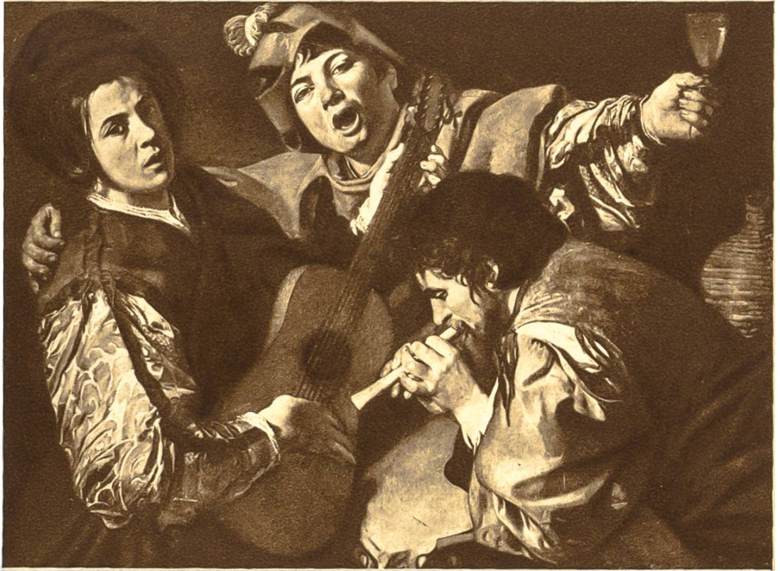
Das Konzert von Michel Angelo da Caravaggio, Venedig, 1560 1609. Collection De- vonshire, London.