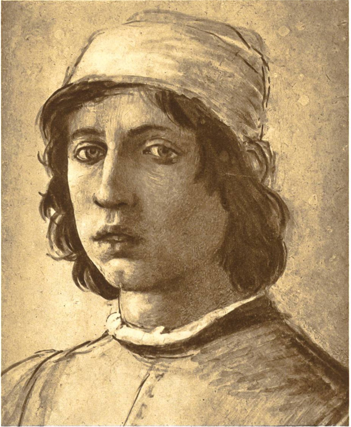
Selbstbildnis von Filippino Lippi, Florenz, 1458–1504. Uffizien, Florenz.