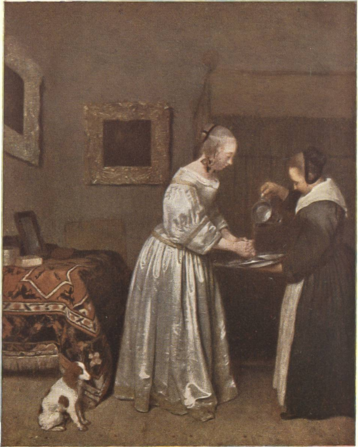
DAME DIE SICH DIE HÄNDE WÄSCHT, von Gerard Terborch, Haarlem 1617–1681. Dresdener Galerie.