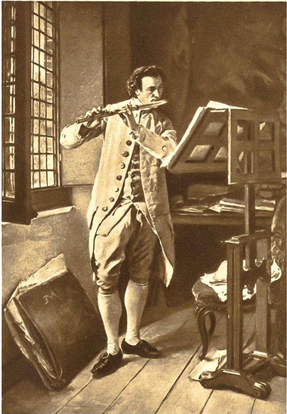
Der Flötenspieler von Jean Louis Ernest Meissonier, Lyon, 1815 – 1891. Louvre, Paris.