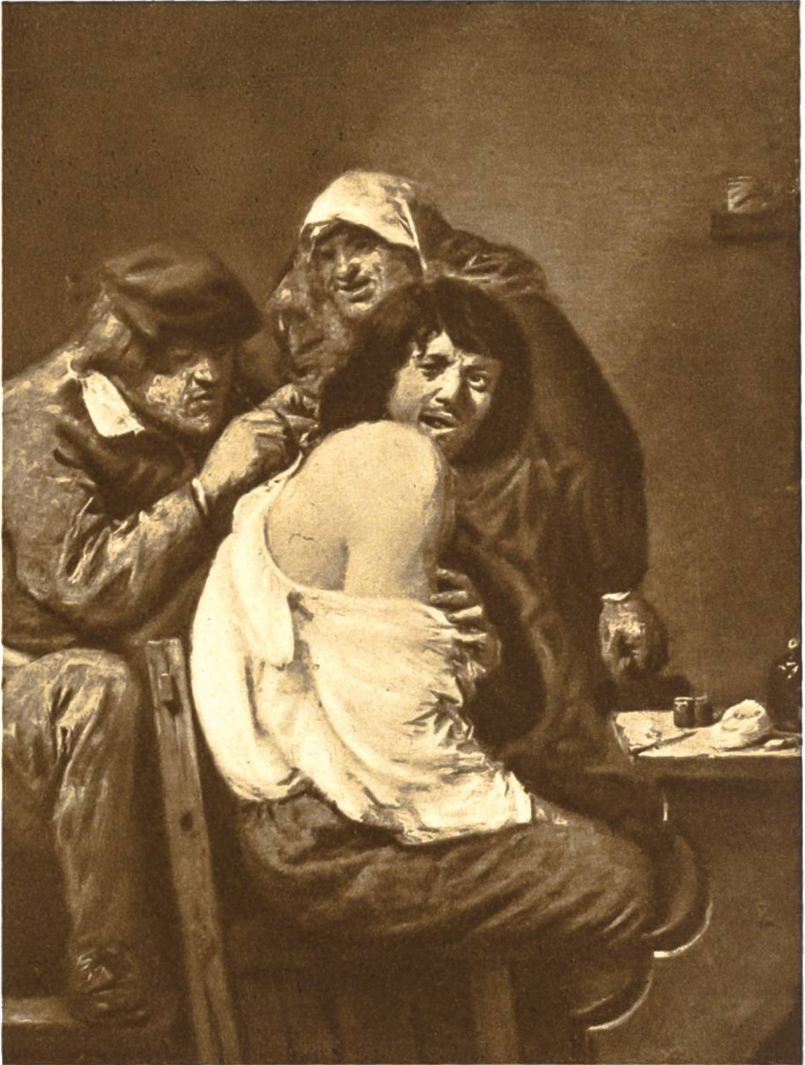
Die Operation am Rücken von Adriaen Brouwer, Antwerpen, 1605–1638. Städelsches Kunstinstitut, Frankfurt.