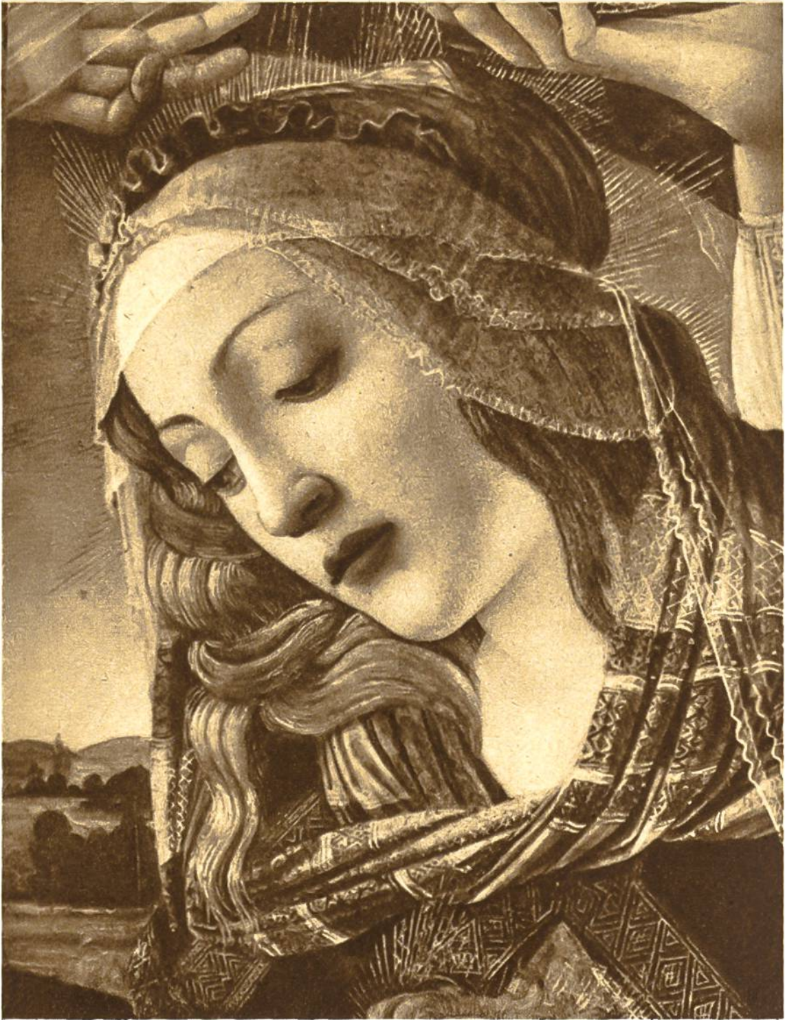
Maria, Teilstück aus dem Gemälde „Die gekrönte Madonna“ von Sandro Botticelli, Florenz, 1444–1510. Uffizien, Florenz.