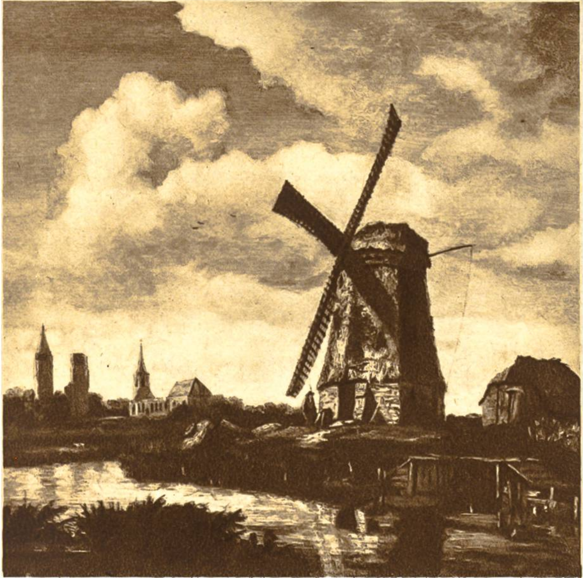
Landschaft mit Windmühle von Jakob Ruisdael, Haarlem, 1628— 1682. Collection Northbrook, London.