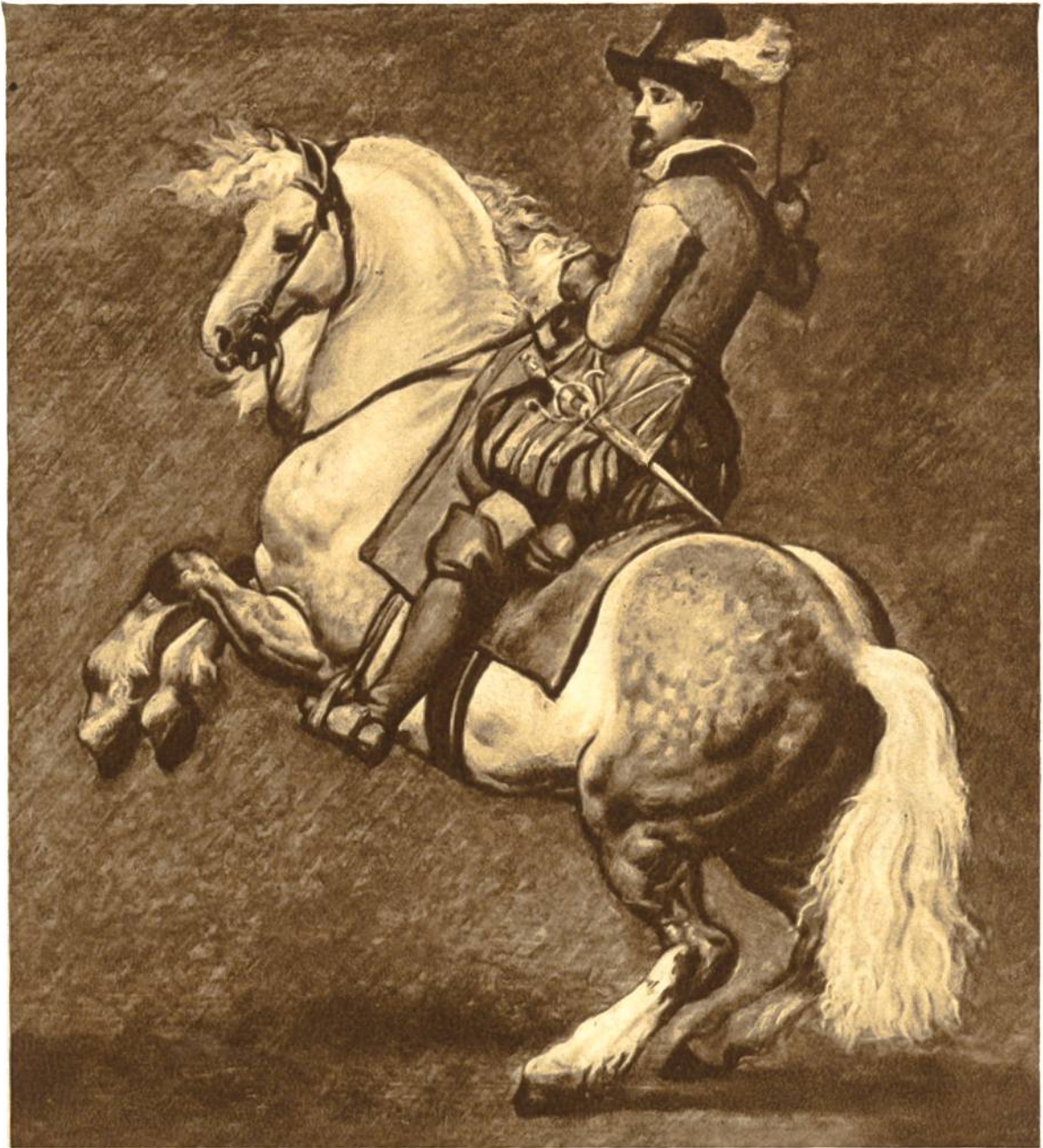
Reiter von Anthonis van Dijck, Antwerpen, 1599 – 1641. Buckingham Palace, London.