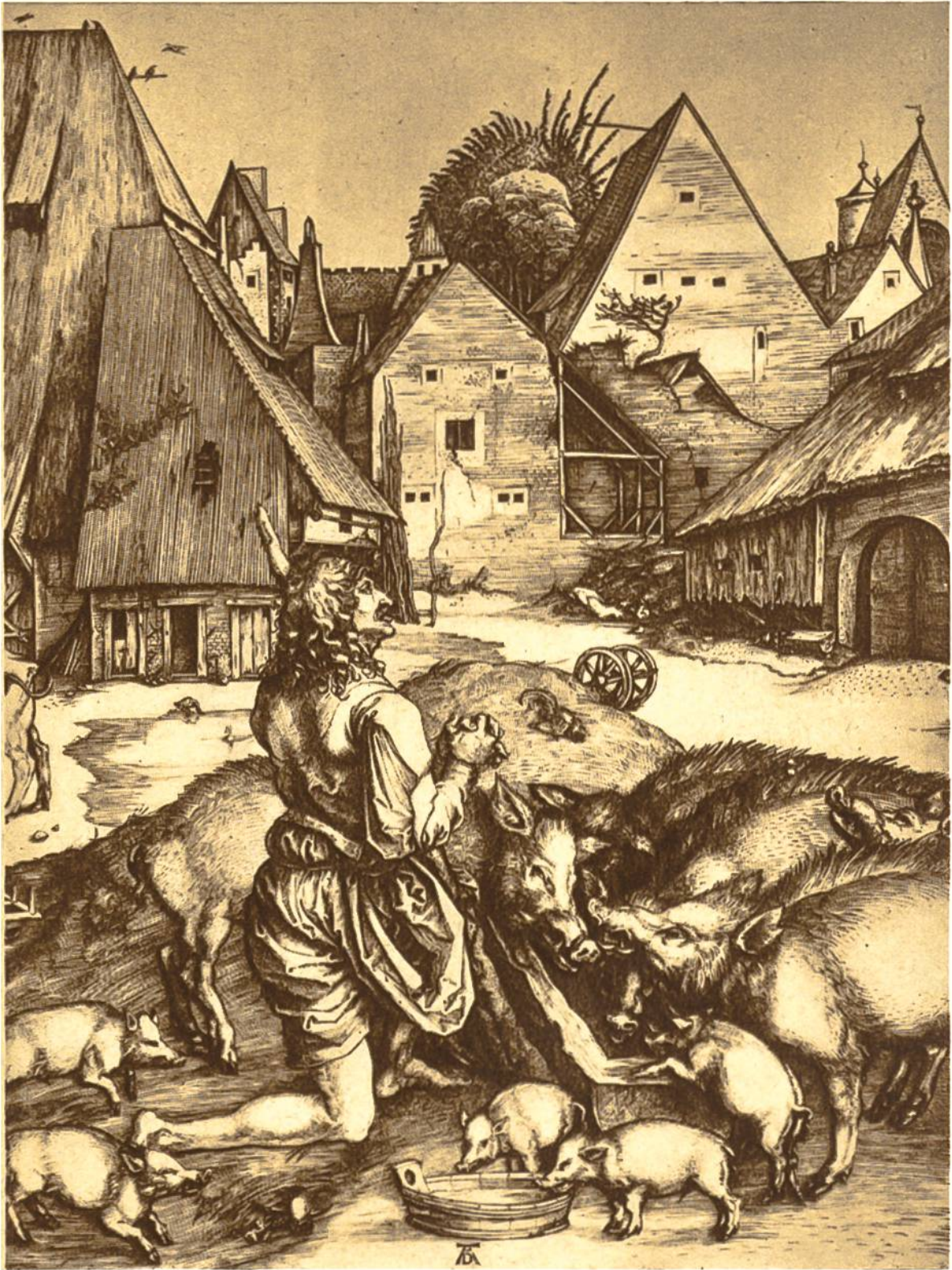
Der verlorene Sohn, Kupferstich von Albrecht Dürer, Nürnberg, 1471—1528.