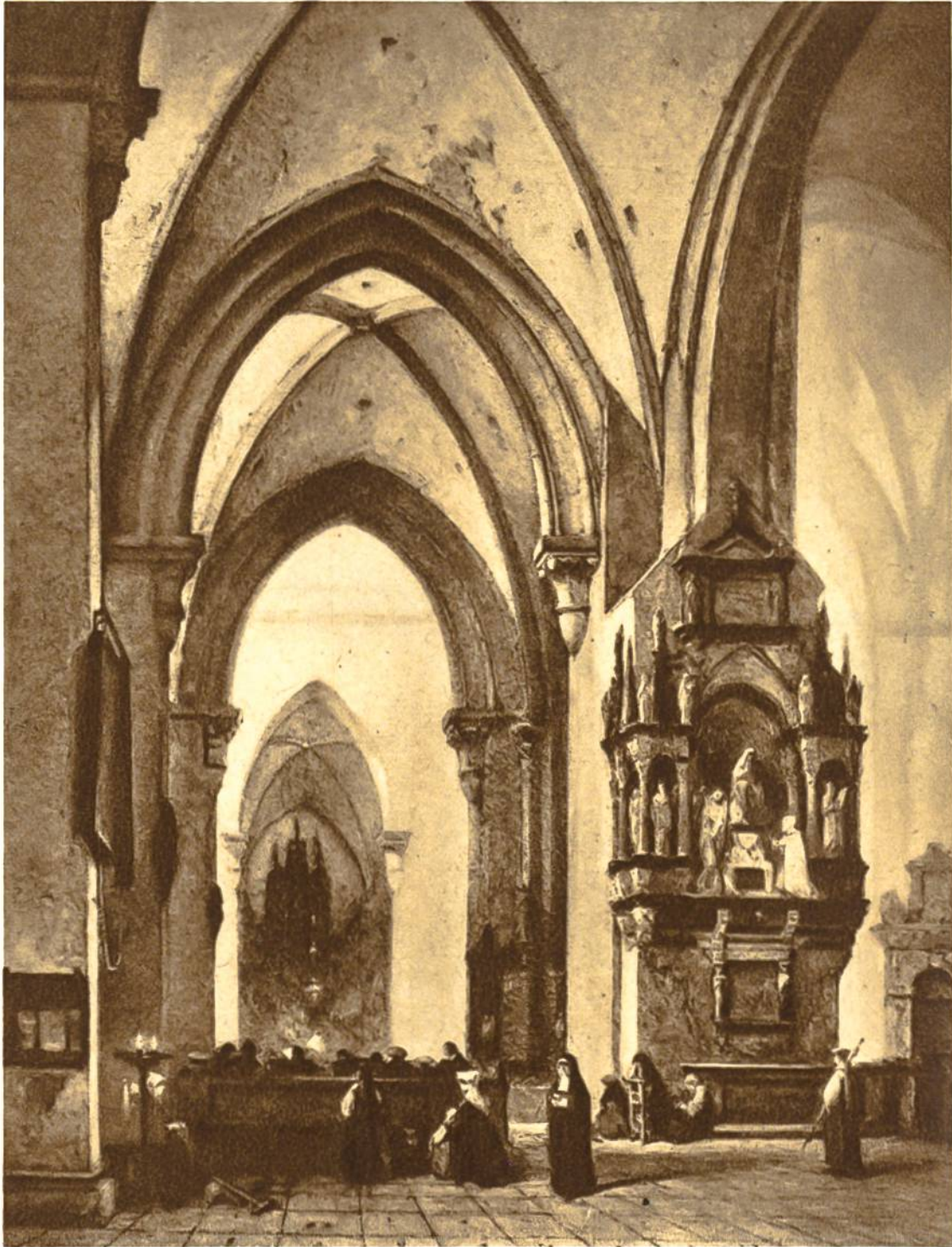
Inneres der Kalvarie von Arie von Jan Vosboom, im Haag, 1817—1891.