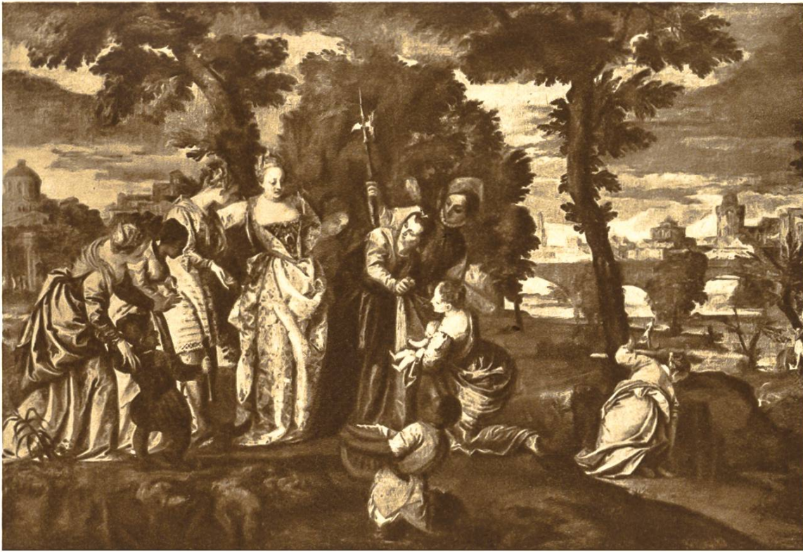
Auffindung Moses' durch die Tochter Pharaos, von Paolo Veronese, Venedig, 1528— 1588. Museum, Dijon.