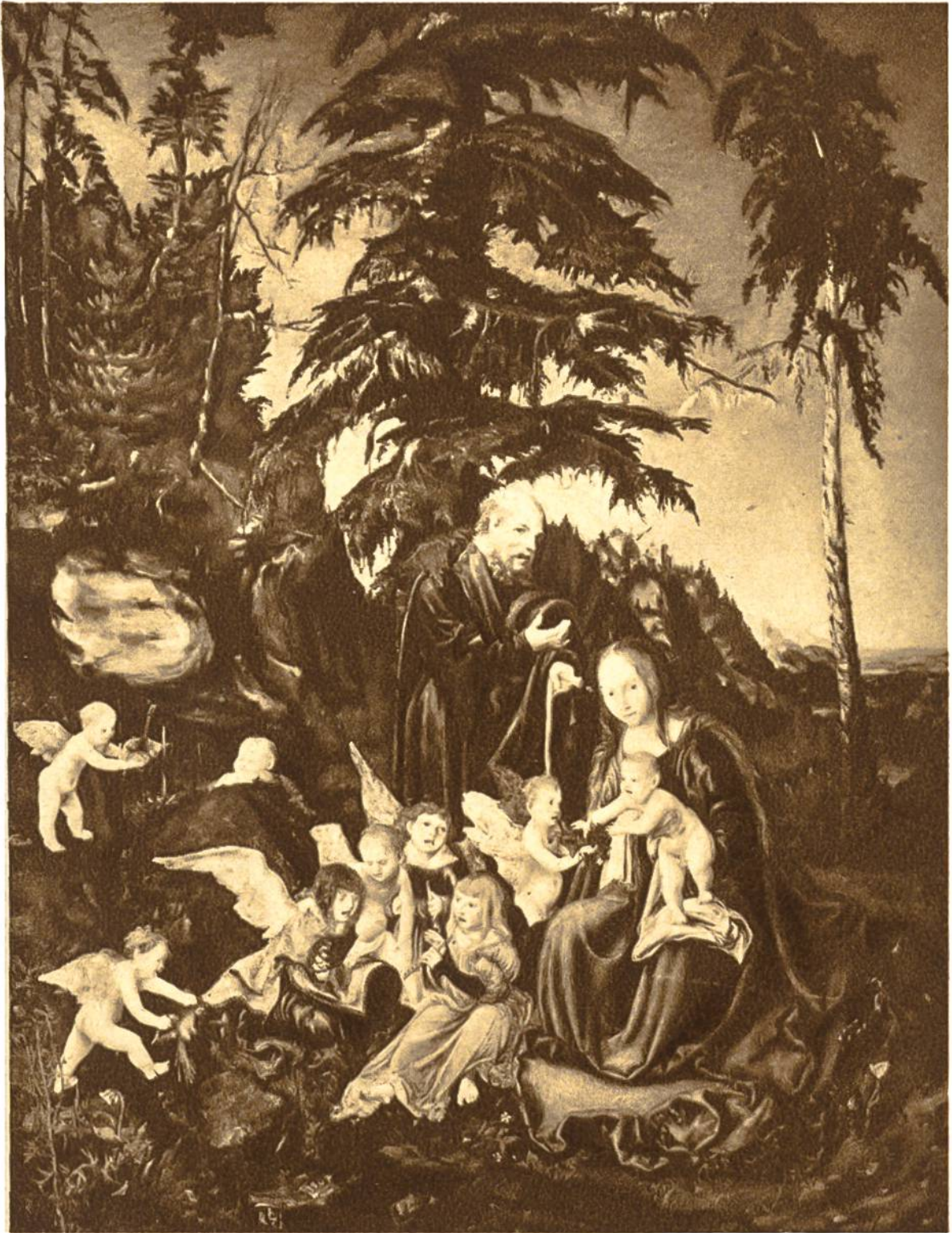
Ruhe auf der Flucht nach Aegypten von Lukas Cranach d. Ältern, Weimar, 1472—1553. Kaiser Friedrich-Museum, Berlin.