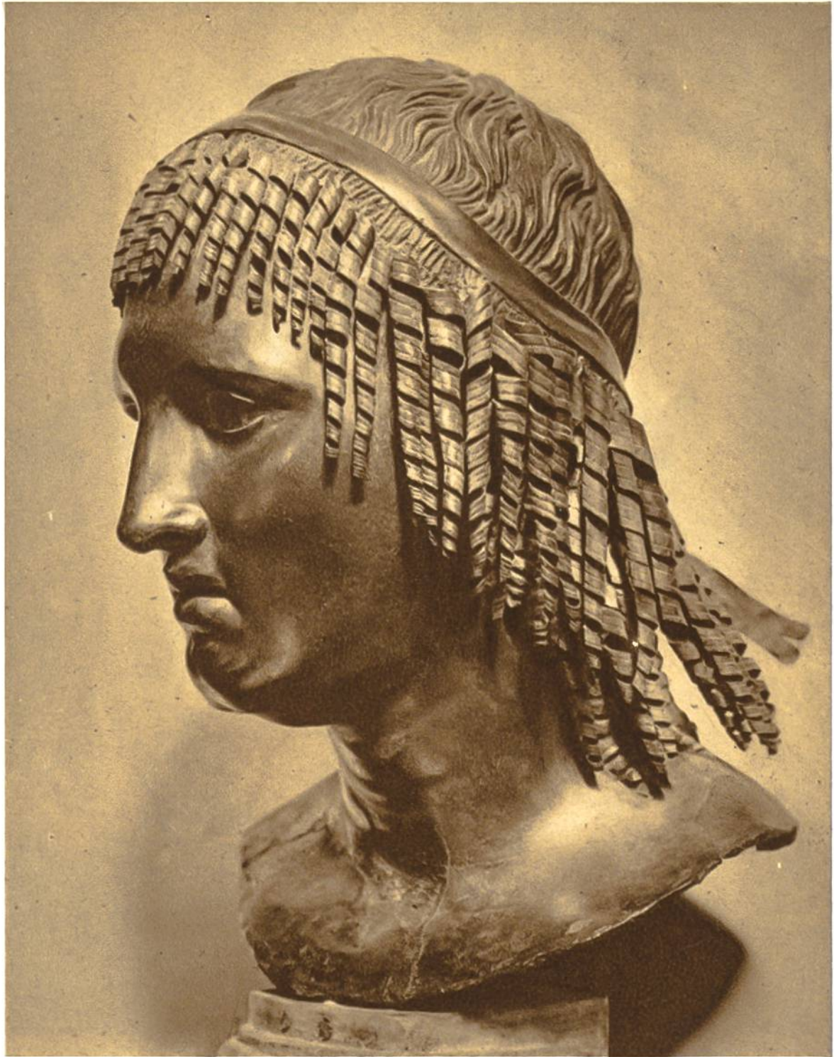
Römischer Bronzekopf aus der Zeit um Christi Geburt, gefunden in Pompeji. Nationalmuseum, Neapel.