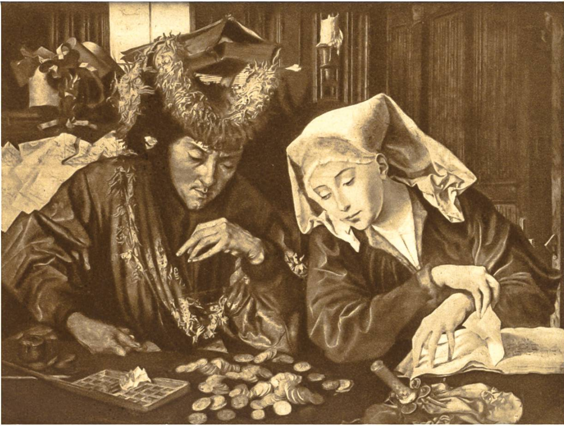
Goldwäger und Frau von Quinten Matsys, Antwerpen, 1460—1530. Prado, Madrid.