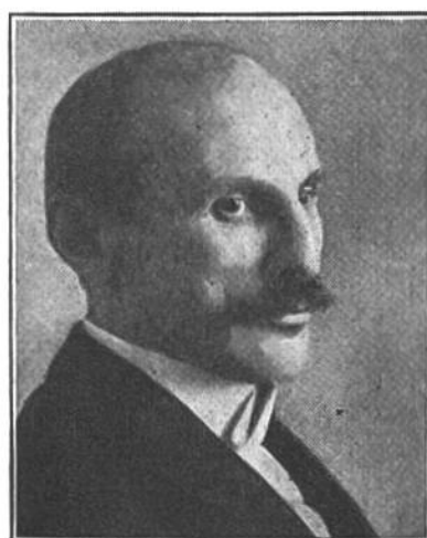
Heinrich Häberlin v. Bisslegg u. Frauenfeld * 1868, seit 1920 i. Amte

Dr. Motta: Chef d. Politischen Departements. Dr. Chuard: Chef d. Departements des Innern. Häberlin: Chef d. Justiz u. Polizeidepartements. Scheurer: Chef des Militärdepartements. Dr. Musy: Chef des Finanz- und Zolldepartements. Schulthess: Chef d. Volkswirtschaftsdepart. Dr. Haab: Chef d. Post- u. Eisenbahndepartements.