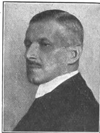
Dr. Robert Haab von Wädenswil * 1865, seit 1918 i. Amte