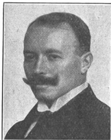
Dr. Jean Musy von Albeuve, Freiburg * 1876, seit 1920 i. Amte