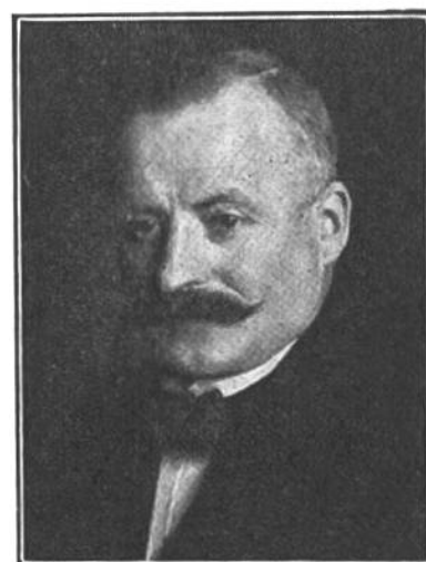
Dr. Giuseppe Motta von Airolo * 1871, seit 1912 i. Amte

Dr. Motta: Chef d. Politischen Departements. Dr. Chuard: Chef d. Departements des Innern. Häberlin: Chef d. Justiz u. Polizeidepartements. Scheurer: Chef des Militärdepartements. Dr. Musy: Chef des Finanz- und Zolldepartements. Schulthess: Chef d. Volkswirtschaftsdepart. Dr. Haab: Chef d. Post- u. Eisenbahndepartements.