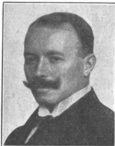
Dr. Jean Musy von Albeuve, Freiburg * 1876, seit 1920 i. Amte