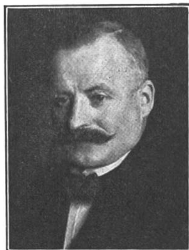
Dr. Giuseppe Motta von Airolo * 1871, seit 1912 i. Amte

Dr. Motta: Chef d. Politischen Departements. Dr. Chuard: Chef d. Departements des Innern. Häberlin: Chef d. Justiz- u. Polizeidepartements. Scheurer: Chef des Militärdepartements. Dr. Musy: Chef des Finanz- und Zolldepartements. Schultheß: Chef d. Volkswirtschaftsdepart. Dr. Haab: Chef d. Post- u. Eisenbahndepartements.