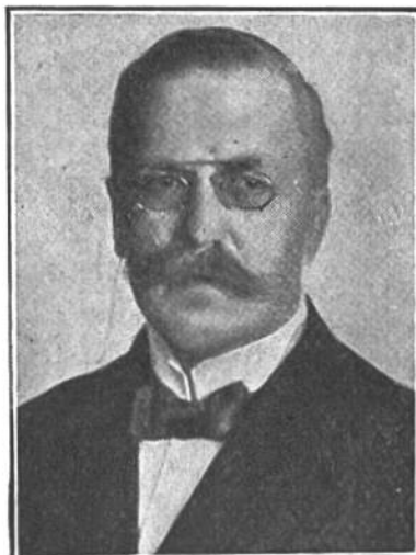
Edmund Schulthess von Brugg * 1868, seit 1912 i. Amte