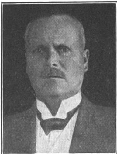
Dr. Ernest Chuard von Corcelles b/Payerne * 1857, seit 1920 i. Amte