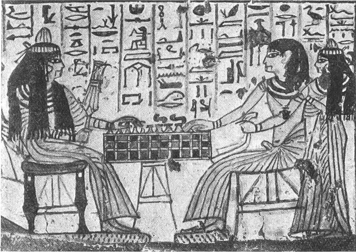
Ehepaar beim Brettspiel vor 3200 Jahren. Ägyptisches Wandgemälde aus dem 13. Jahrhundert vor Christi Geburt.