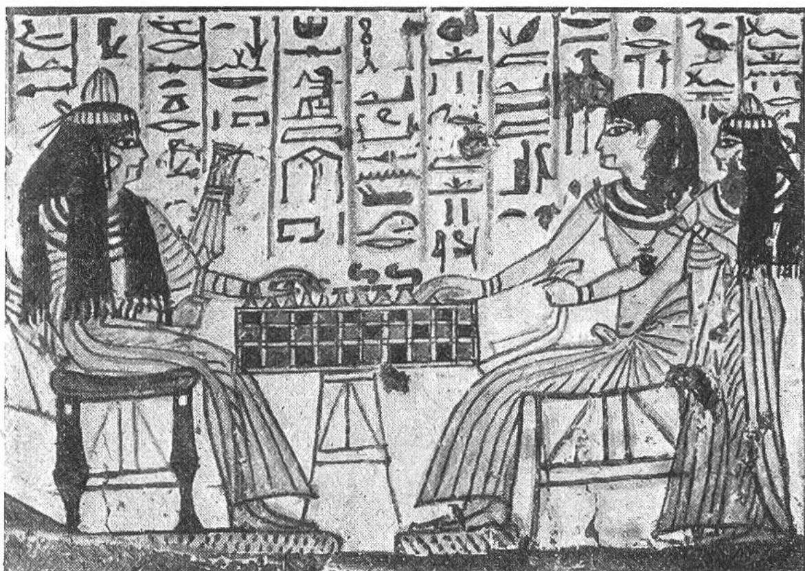
Ehepaar beim Brettspiel vor 3200 Jahren. Ägyptisches Wandgemälde aus dem 13. Jahrhundert vor Christi Geburt.