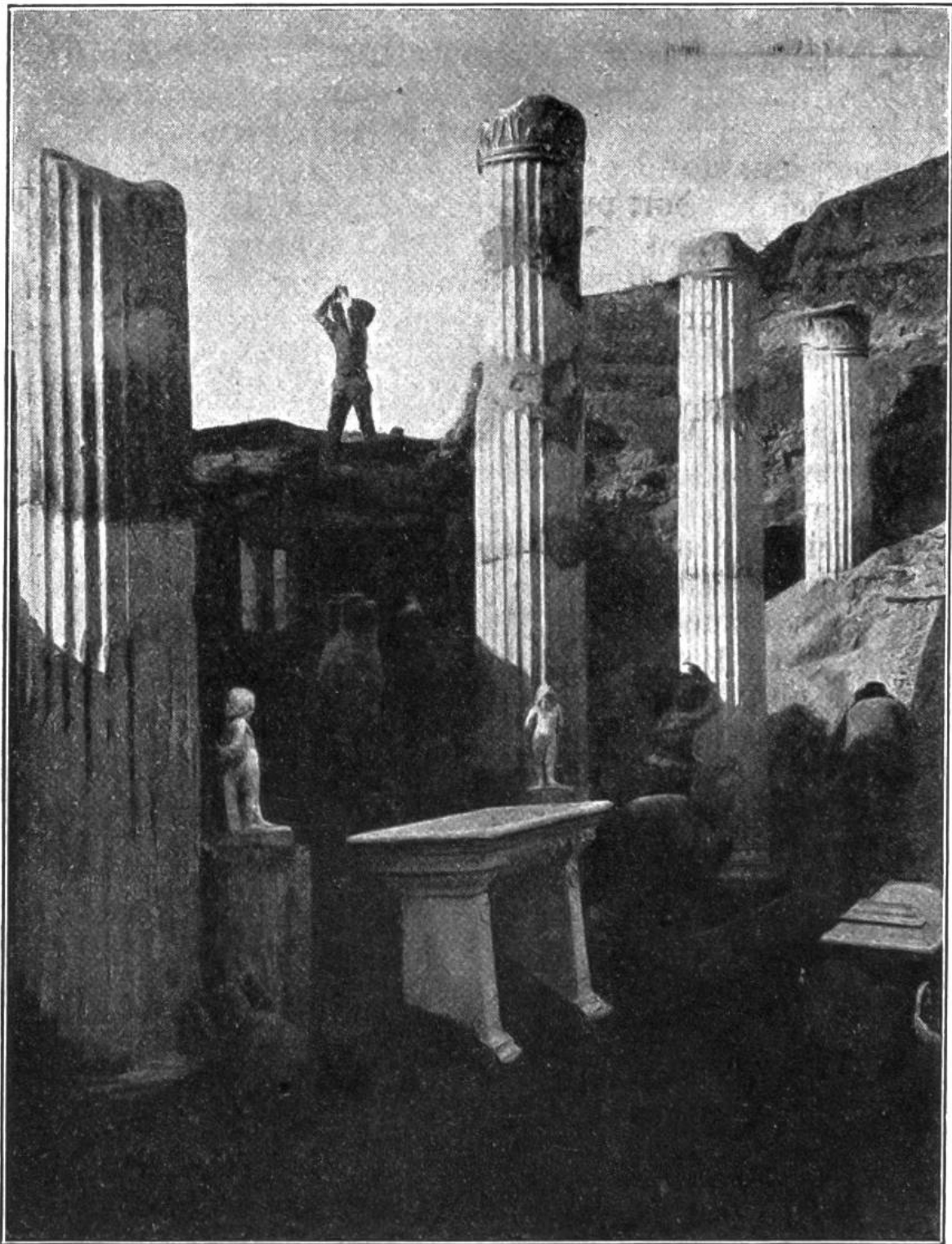
Ausgrabungsarbeit in Pompeji. In Körben wird die 6 Meter hohe Schicht aus Asche und Bimssteinbrocken weggeschafft. Das Bild zeigt, wie ein Teilstück des „Hauses Vetti“, das auf unserer ersten Abbildung im jetzigen Zustande zu sehen ist, freigelegt wurde.