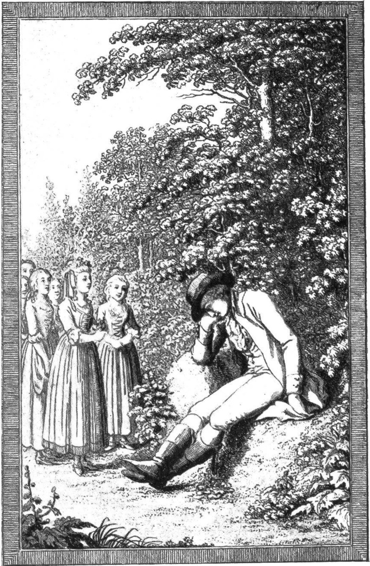
Die Spinnerfinder kommen, dem Junfer mit Freuden zu danken für die erwiesenen Guttaten