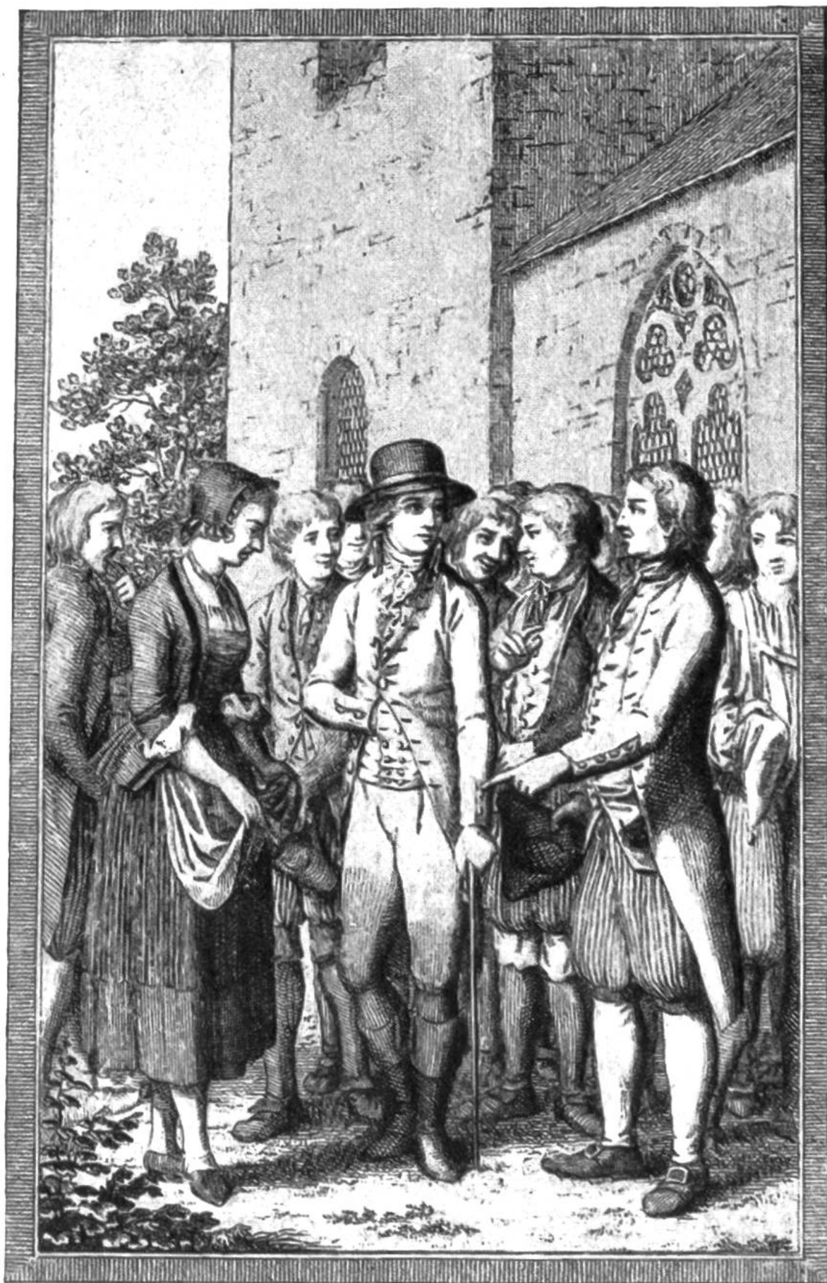
Arner verweist dem Untervogt sein Tun den Armen und Notdürftigen gegenüber.