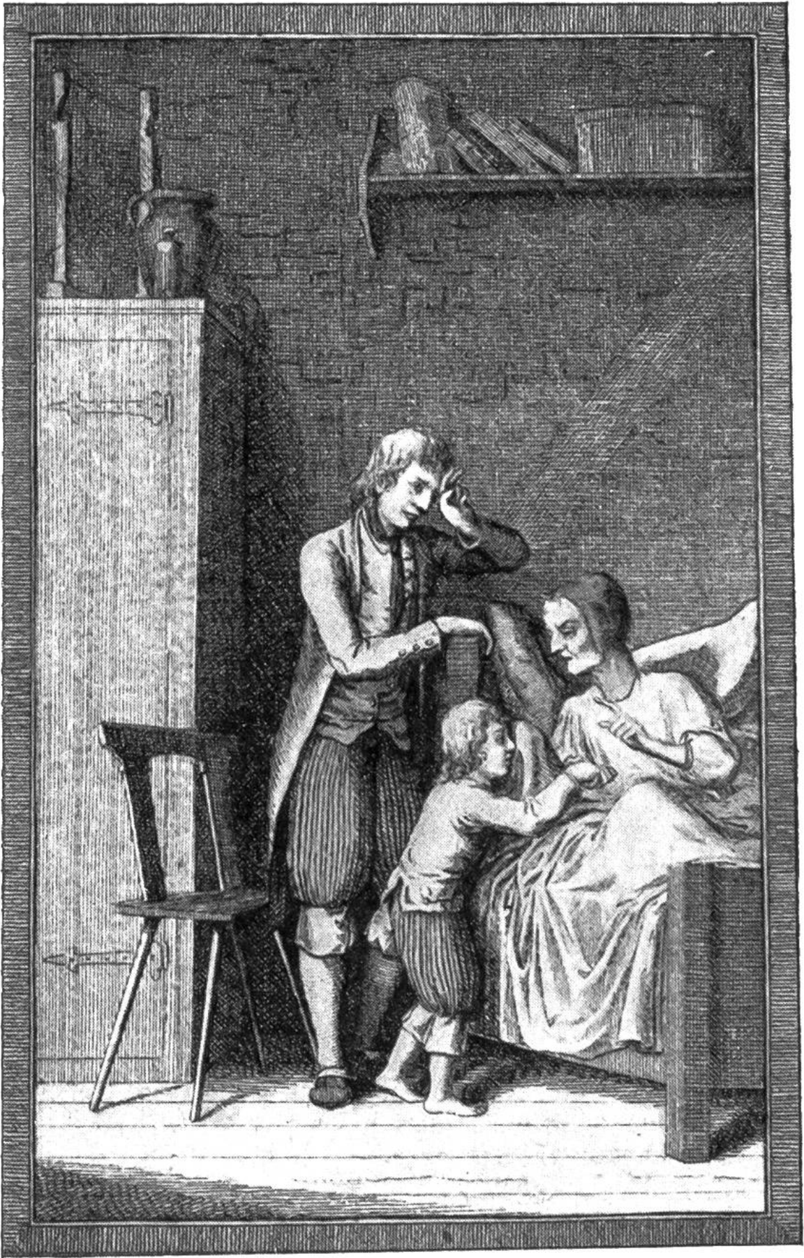
Ruedeli gesteht der Großmutter, er habe Erdäpfel gestohlen.