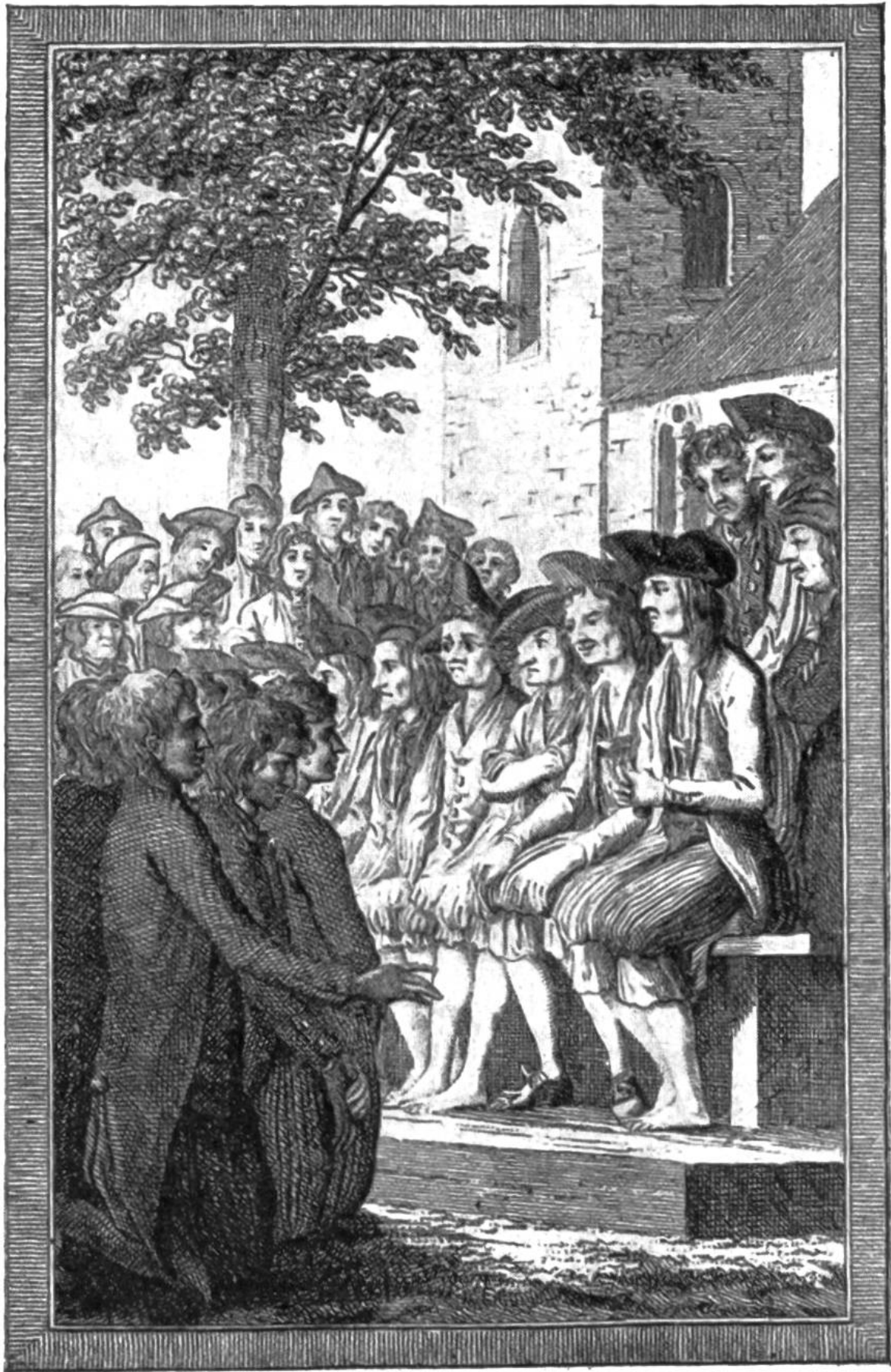
Die schuldigen Vorgesetzten leisten vor allem Volk Abbitte.