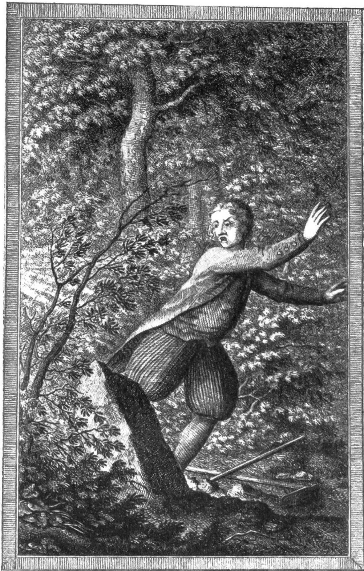
Der abergläubische Hummel glaubt sich vom Teufel verfolgt.