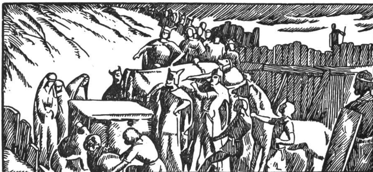
Bestattung Alarichs im Buzento.