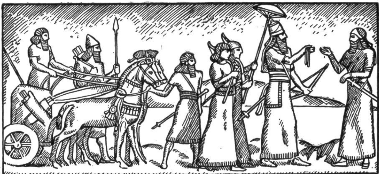
Assyrischer König mit Gefolge.