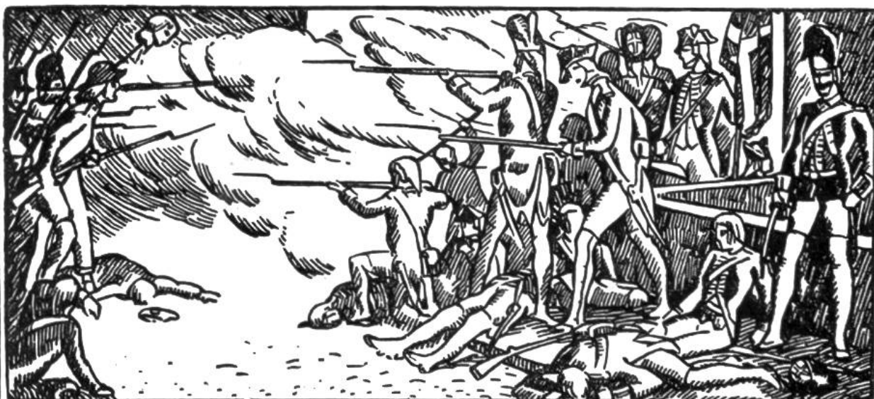
Verteidigung der Tuilerien durch die Schweizergarde.

1675 Der große Kurfürst schlägt die Schweden b. Fehrbellin. 1689—1725 Zar Peter der Große macht Rußland zu einer europäischen Großmacht. 1700—1721 Nordischer Krieg. Peter der Große von Rußland, Sachsen, Polen u. Dänemark geg. Karl XII. v. Schweden. 1701—1714 Span. Erbfolgekrieg. 1712 Zweit. Villmergerkrieg, Niederlage der katholischen Orte. 1713 Friede zu Utrecht. 1714 Friede zu Rastatt. 1740 Friedrich II., d. Große, König von Preußen u. Maria Theresia, Kaiserin v. Österreich. 1749 Henziverschwörung in Bern. 1756—1763 Siebenjähriger Krieg. Preußen behält Schlesien. Frankreich tritt Kanada an England ab. 1761 Gründung der Helvetischen Gesellschaft. Iselin, Balthasar, Hirzel, Zimmermann, Salis, Haller, Gekner, Lavater, Pestalozzi, Joh. v. Müller. 1766 Lothringen und Korsika werden französisch.