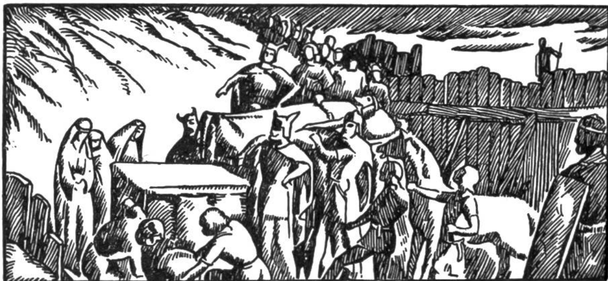
Bestattung Alarichs im Busento.