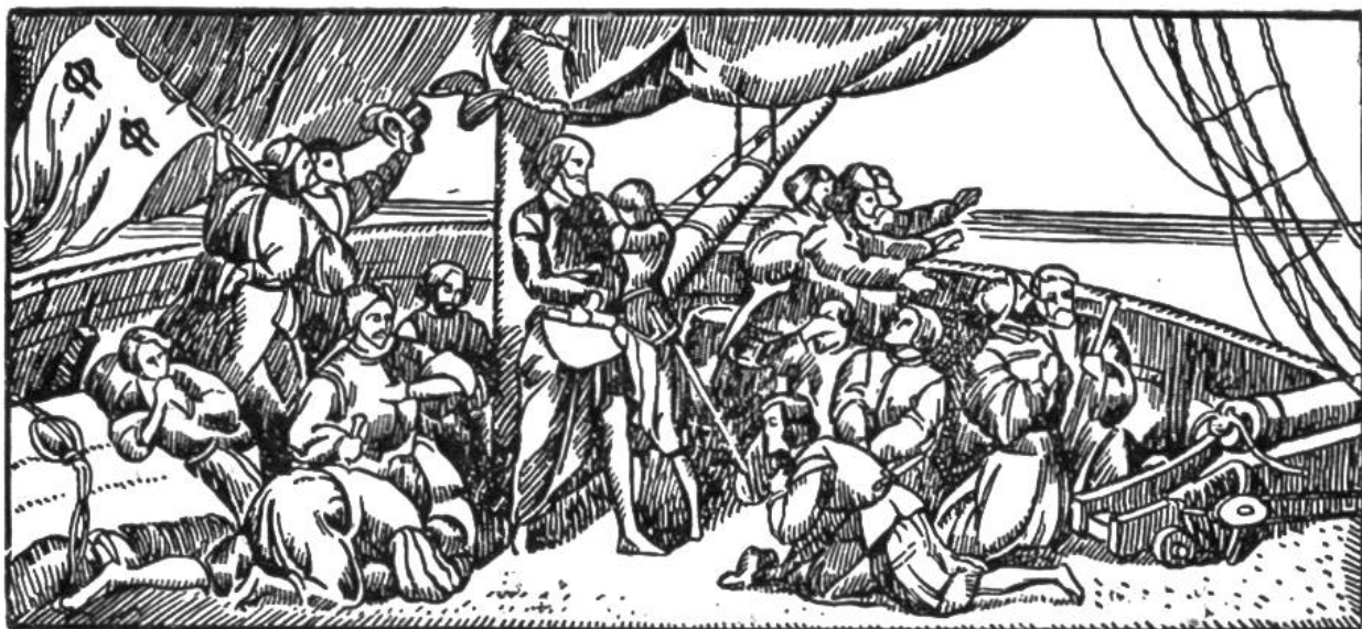
Kolumbus und seine Gefährten angesichts Land.

1481 Stanser Verkommnis, Nikolaus von Glüe als Friedensstifter. Freiburg und Solothurn werden in den eidgenössisch. Bund aufgenommen.