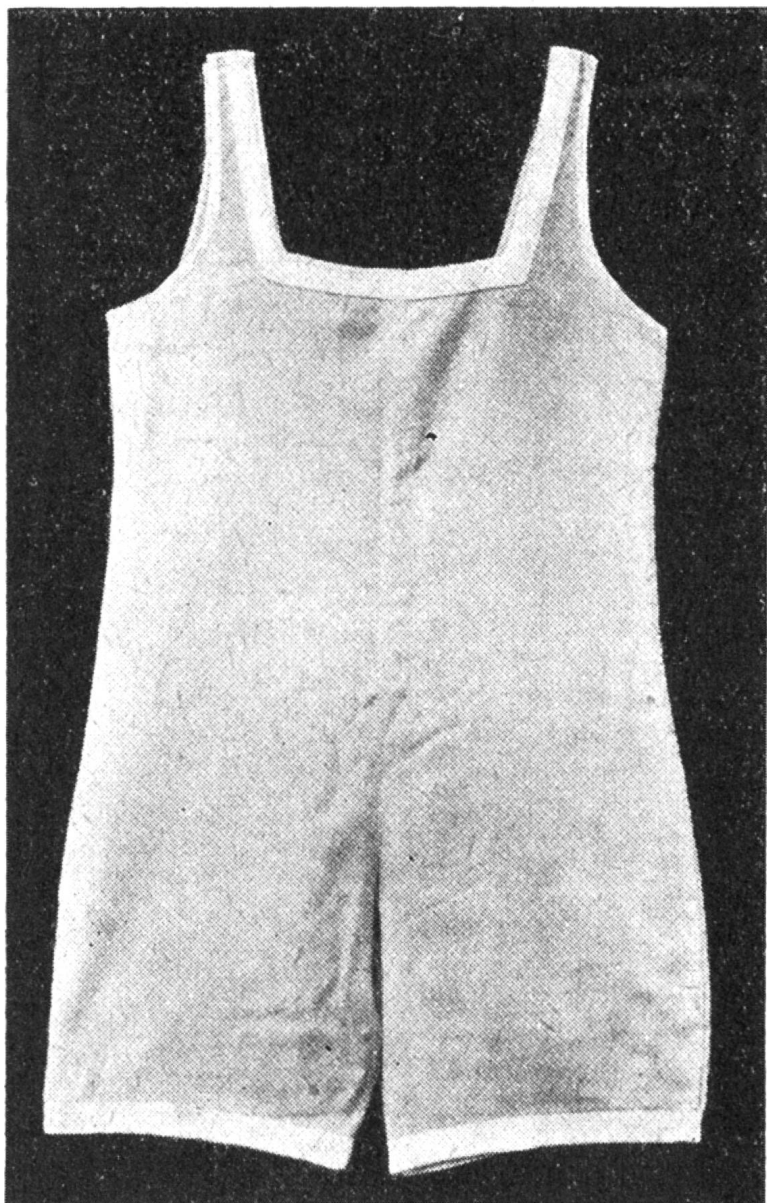
Badekleid mit Achsel schluß.

gestürzt, damit auch die Knopflöcher auf doppeltem Stoff gearbeitet werden können.