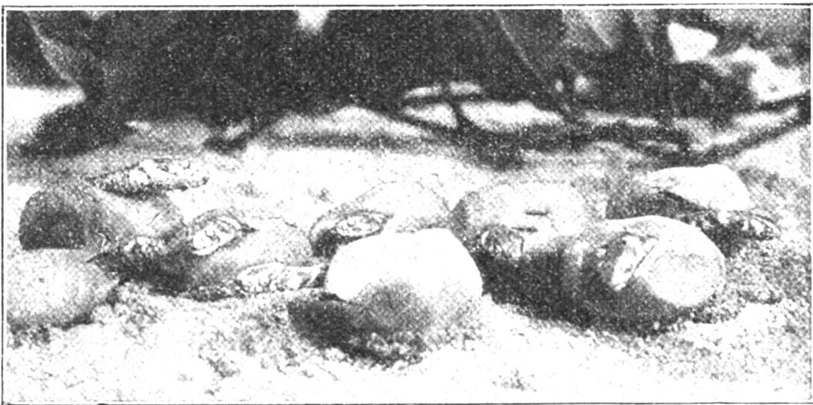
Acht Gras-Schlänglein schlüpfen aus den lederartigen Eierschalen.

Im Umgang mit Menschen gereicht dem Chamäleon seine fabelhafte Farbtechnik nicht zum Vorteil. Die Beschauer necken das Tier, nur um es wütend und farbstrahlend zu sehen; es geht ihm gleich wie den Menschen, die sich nicht beherrschen können, in ihrem Ärger komisch sind und deshalb oft von schadenfrohen Leuten gehänselt werden.