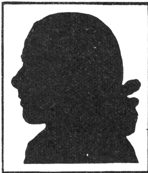
Pestalozzi als Jüngling.

Pestalozzi hat bewiesen, was unerschütterliche Liebe und Herzensgüte vermag; es ist dies