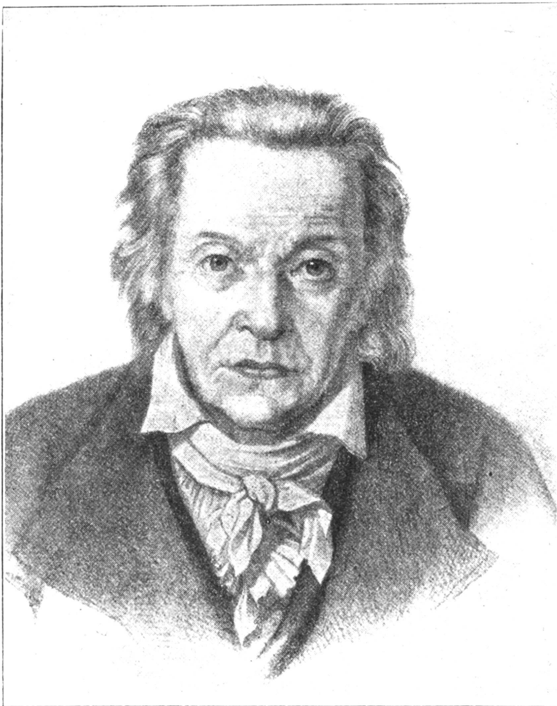
Johann Heinrich Pestalozzi im Alter von 72 Jahren. Nach dem Leben gezeichnet.